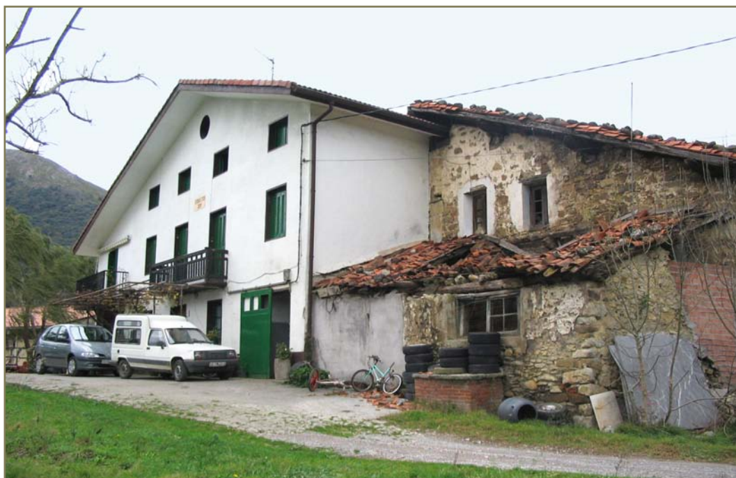
5.2. irudia. Itziarko Zubeltzuzar.