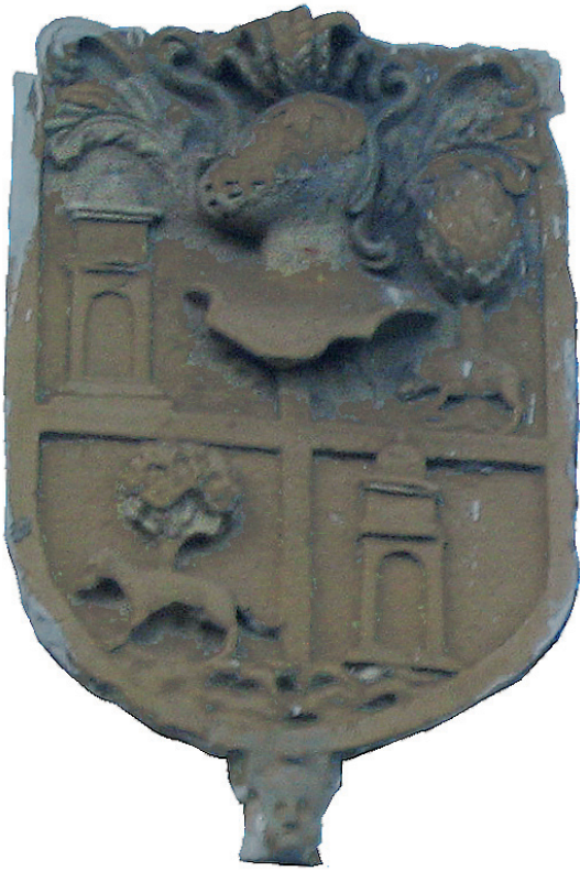
5.9. irudia. Aizarnazabalgo Etxabe jauregiko armarrria.