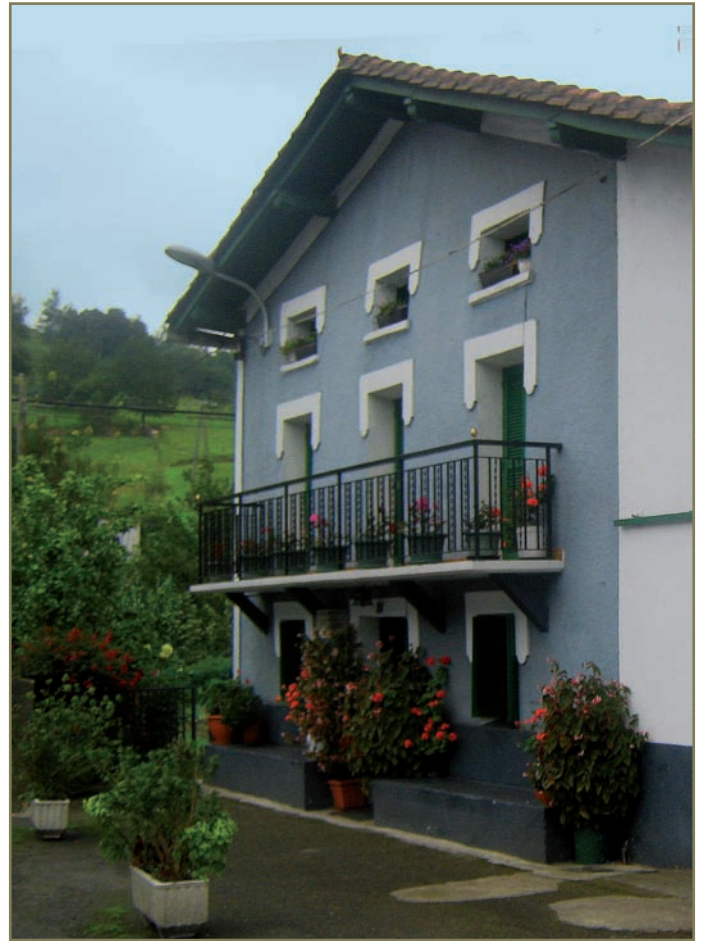
5.7. irudia. Zestoako Txiribogaberri.