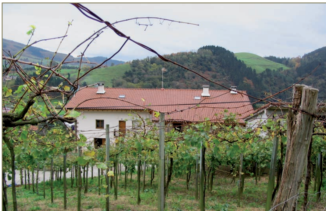
5.11. irudia. Zumaiako Artadiko Dornutegi.