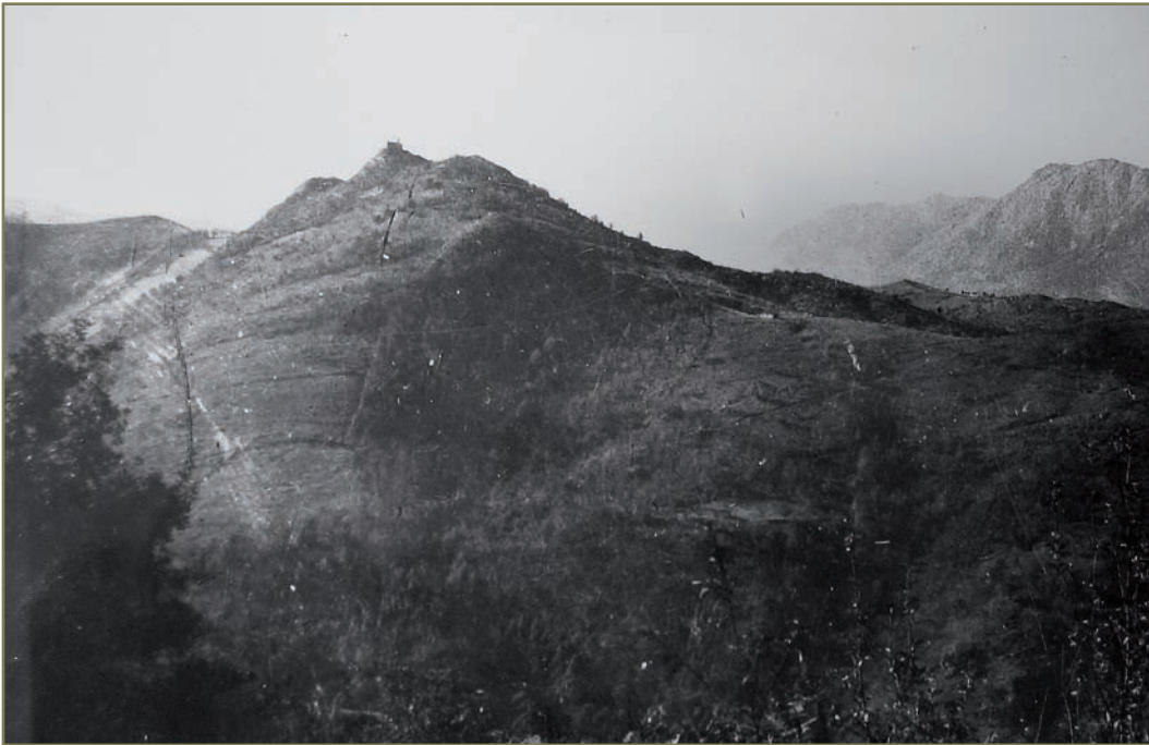
5.12. irudia. Aizarnako Santa Engrazia.