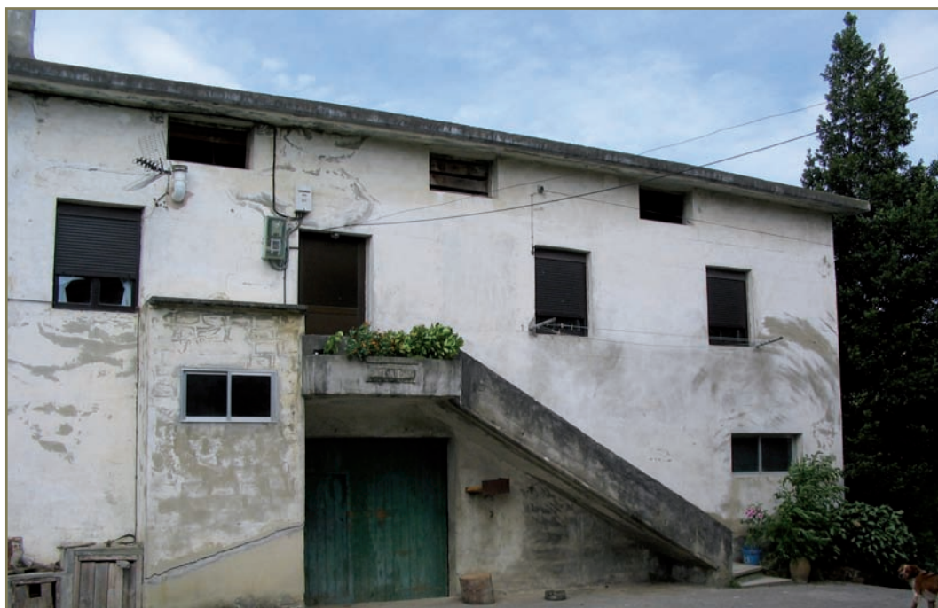
5.14. irudia. Arroako Igartzatzikiberri.