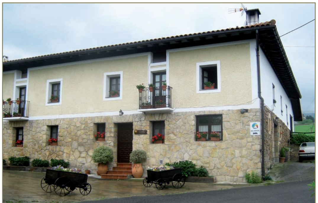
5.16. irudia. Arroako Areitzaga Zelaikoa.