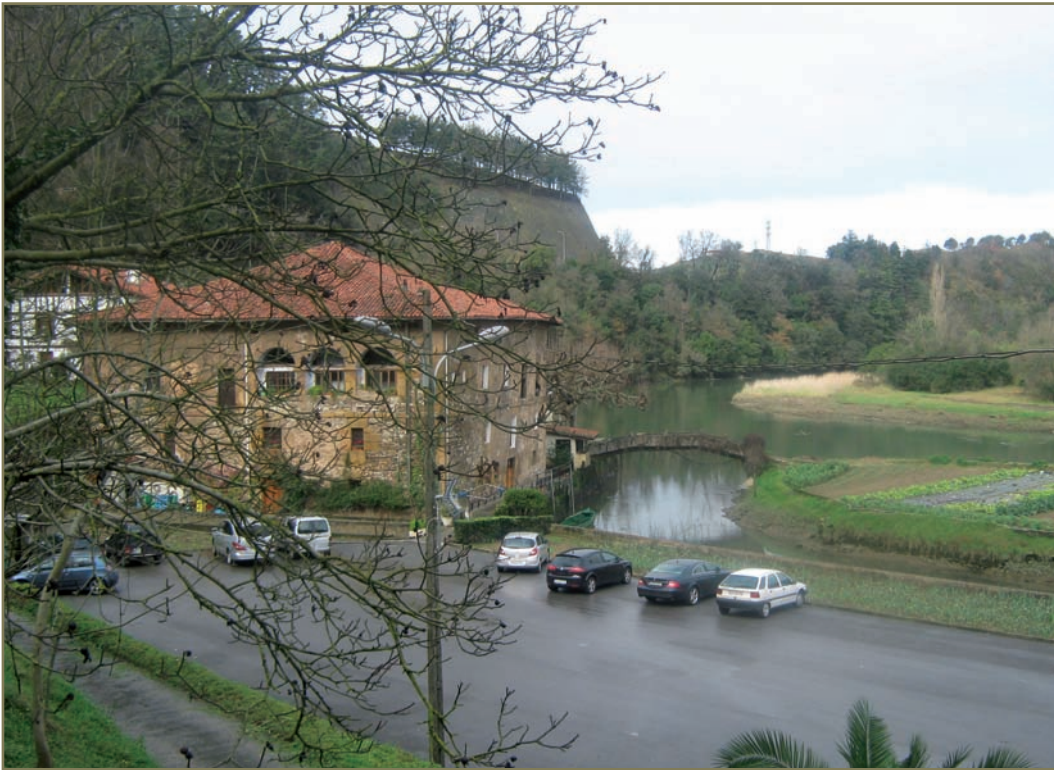
5.8. irudia. Zestoako Beduaundi eta erria.