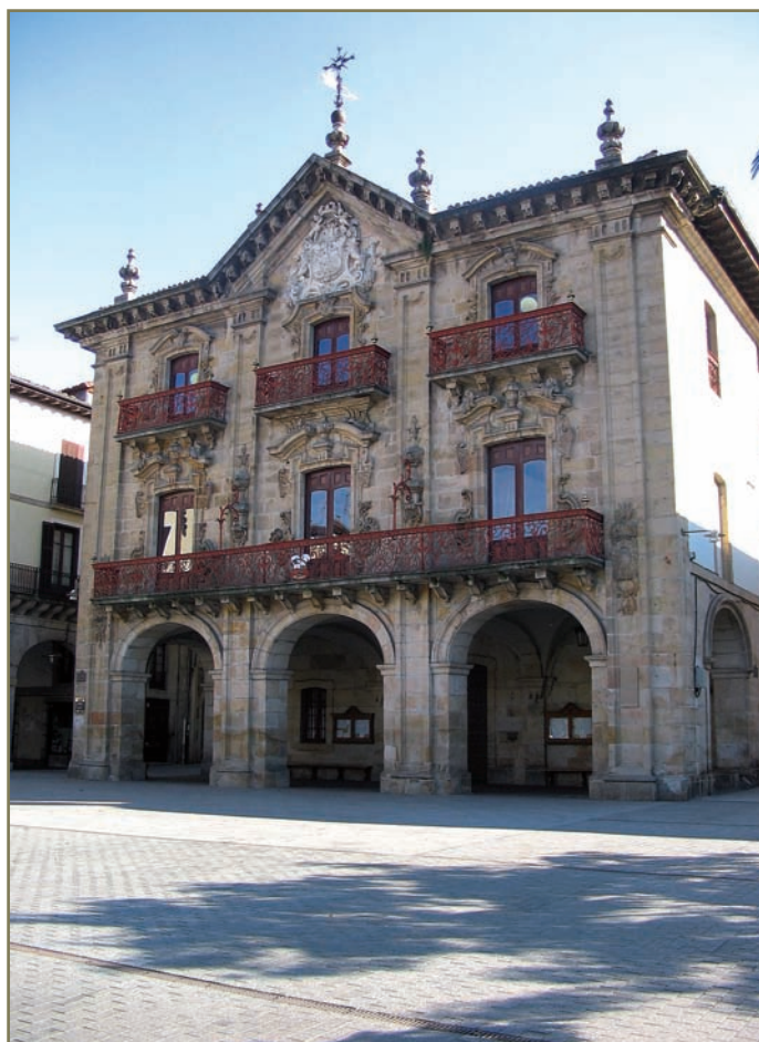
5.17. irudia. Oñatiko udaletxea.