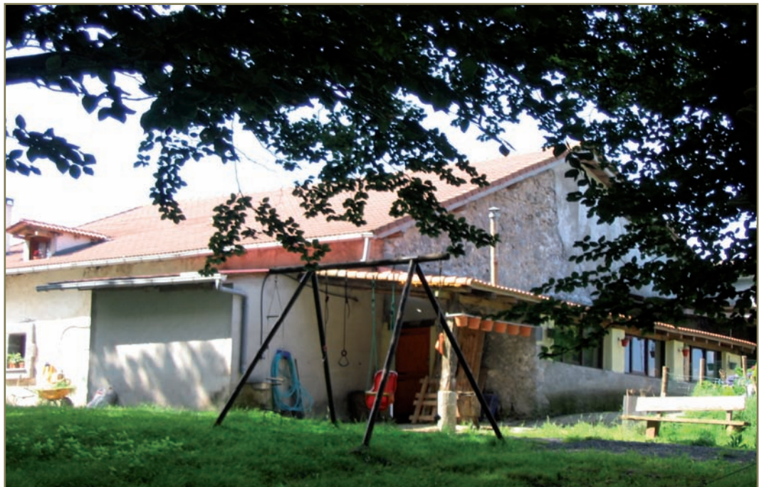
5.3. irudia. Urdanetako Saroeberri.