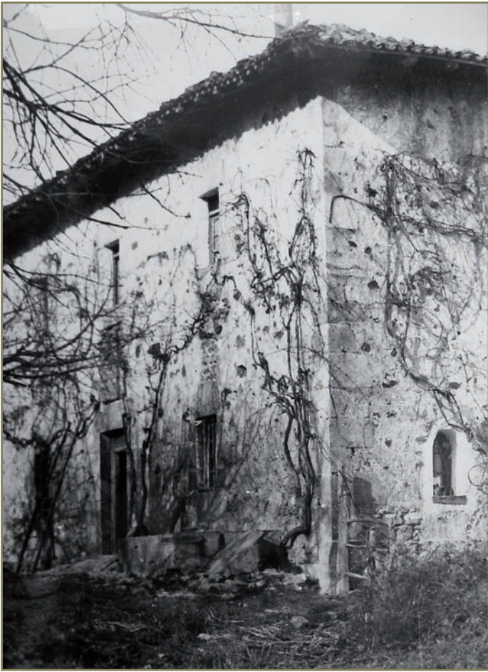
5.19. irudia. Baltzola baserria.