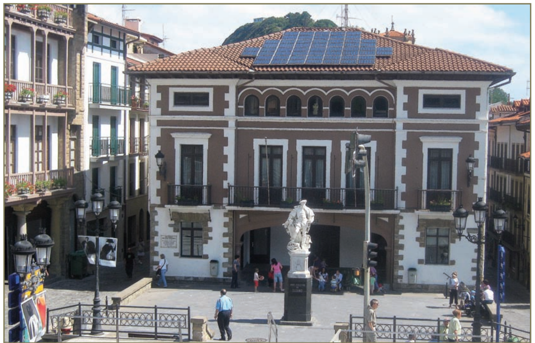
5.20. irudia. Getariako udaletxea eta plaza.

Urte hartan Loiolako San Inazio Paristik Azpeitira (Errezilgo Etumetatik igarota 5 ) itzuli zen, osasunez makal zebilelako. Azpeitiko Madalenan bizi izan zen pobreekin batera. Azpeitian apiriletik uztaila arte egon zen, eta bertan jende ugariaren aurrean sermoiak egin zituen. Umeei dotrina irakasten ere saiatu zen. Azpeititik Iruñera joan zen, eta gero Valentziatik Veneziara abiatu zen itsasoz 6 .