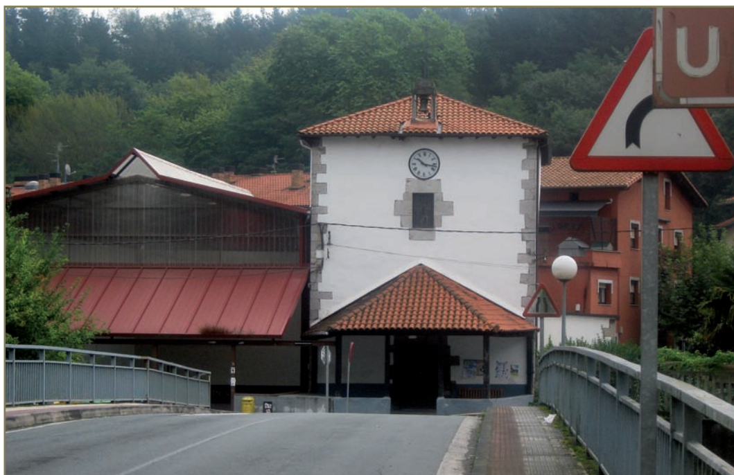
5.13. irudia. Iraetako eliza eta frontoia.