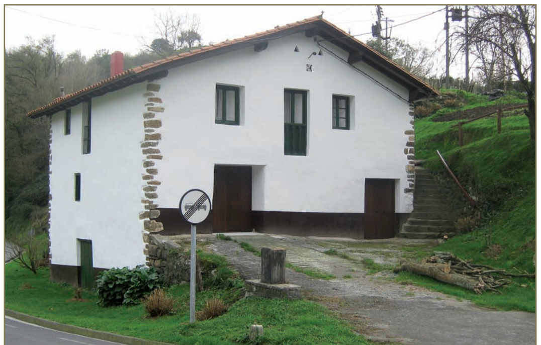
5.1. irudia. Aiako Mañarinzelai errota.