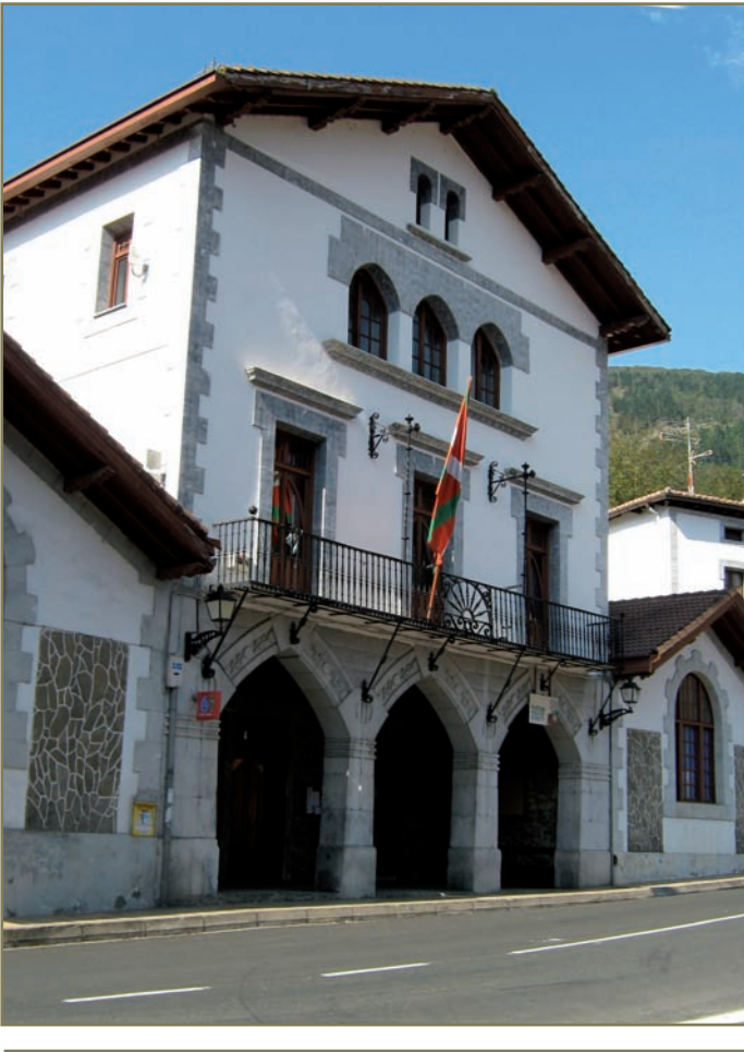
5.5. irudia. Errezilgo udaletxea.

zen, eta beste erdia hurrengo urteko San Migel egunerako. Karga ikatzaren prezioa 3 txanpon eta 3 sosekoa izango zen.