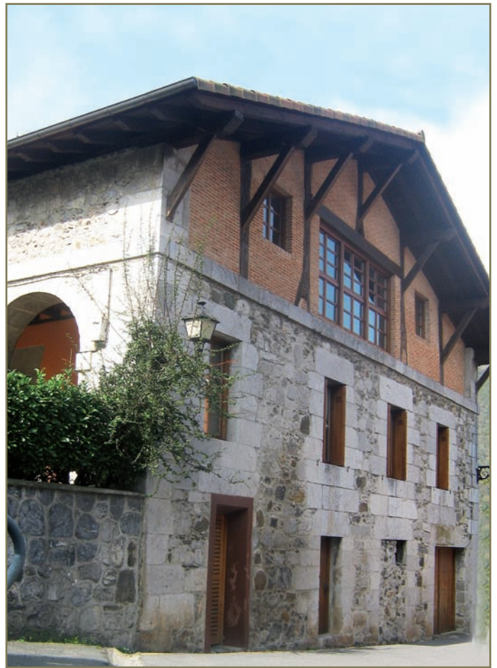
5.4. irudia. Zestoako Lizarrarats.