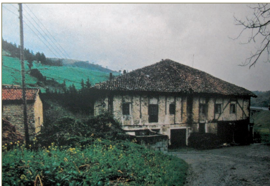
4.2. irudia. Oikiako Mantzizidor (desagertua).