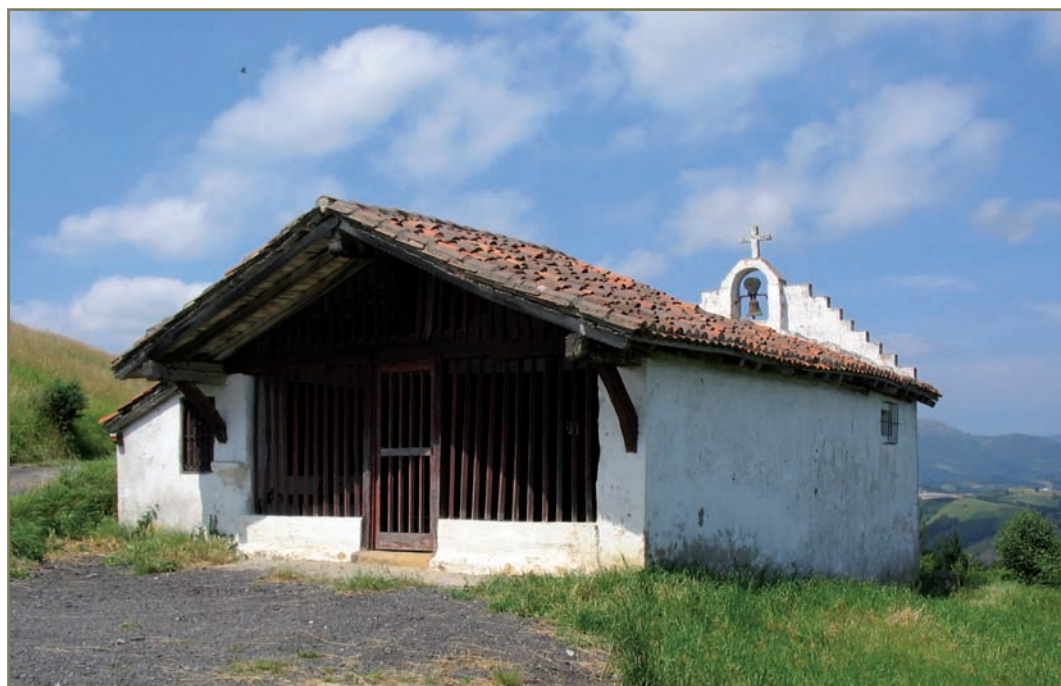
4.7. irudia. Elkanoko Santa Kruz ermita.