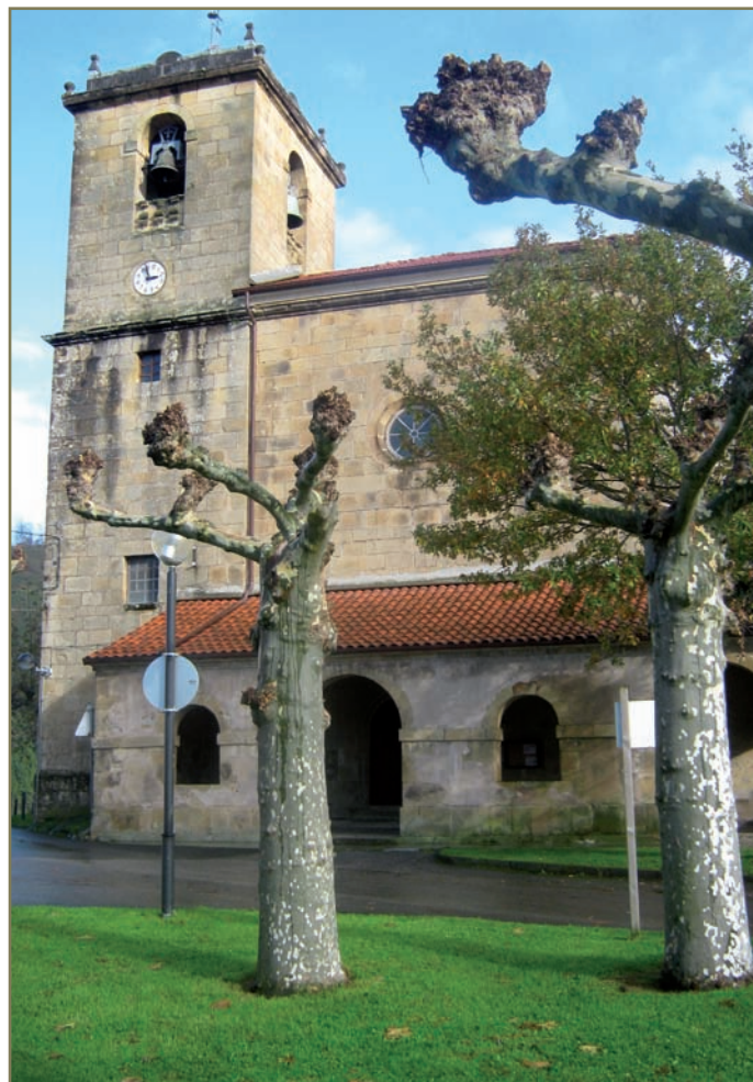
4.1. irudia. Aizarnazabalgo eliza.

- 1534-IV-1ean, Donostian, korrejidoreak epaia eman zuen. Lau egun barru zin egitera azalduko ziren bi aldeak, eta elkarrentzat prestatu galderei erantzungo zieten. Alde bakoitzak bere lekukoak aurkeztuko zituen.