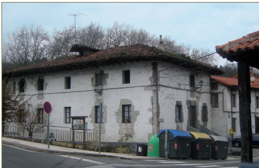
4.6. irudia. Iraetako Granero.