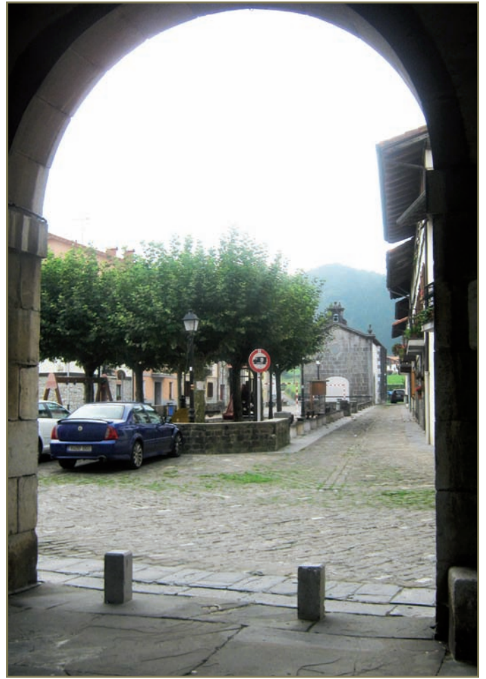
3.3. irudia. Aizarnako plaza.