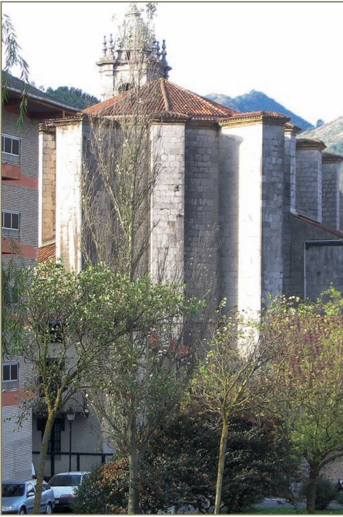
3.8. irudia. Zestoako parroikia. Korropea.