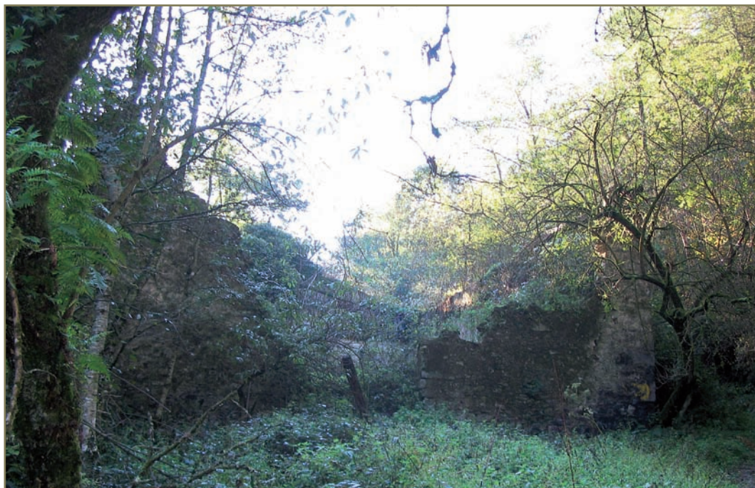
3.5. irudia. Granadaerrekako Errotabarrenaren aurriak.

guren Bekolako olagizonei bizarra mozten ibili omen zen. Galderei, oro har, baiezkoa erantzun zien.