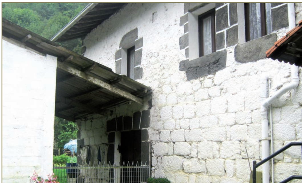
3.2. irudia. Bekola etxea.