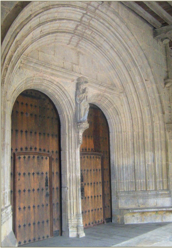
3.9. irudia. Aizarnako elizako portalea.

zioenez, hark erretore-kargua sei hilabetez bakean eduki omen zuen. Beraz, ordura arte kendu zizkioten etekinak eskatu zituen.