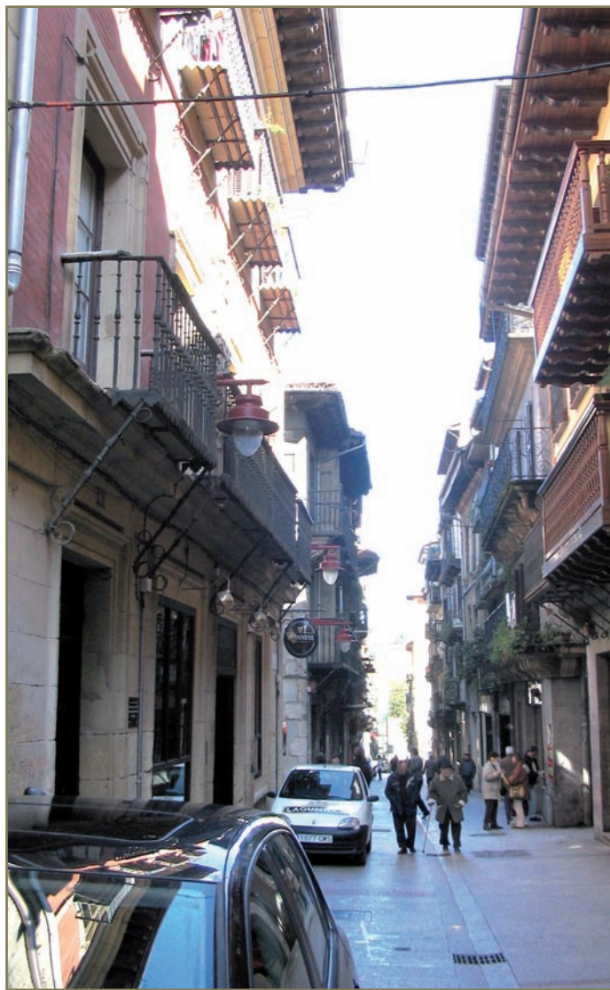
3.11. irudia. Hernaniko Kale Nagusia.

Urte hartan Legazpiko ordenantzatan debekatu egin zuten arrantzarako ibaira karea botatzea. Azpei-