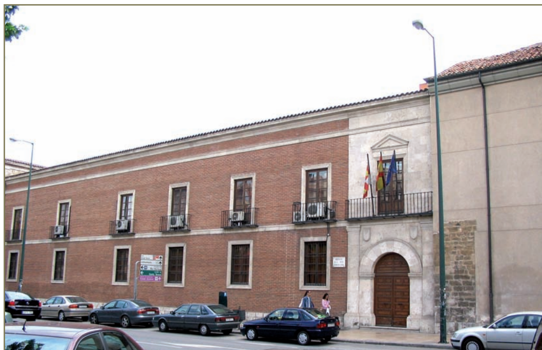
3.1. irudia. Valladolidko Kantzelaritza.