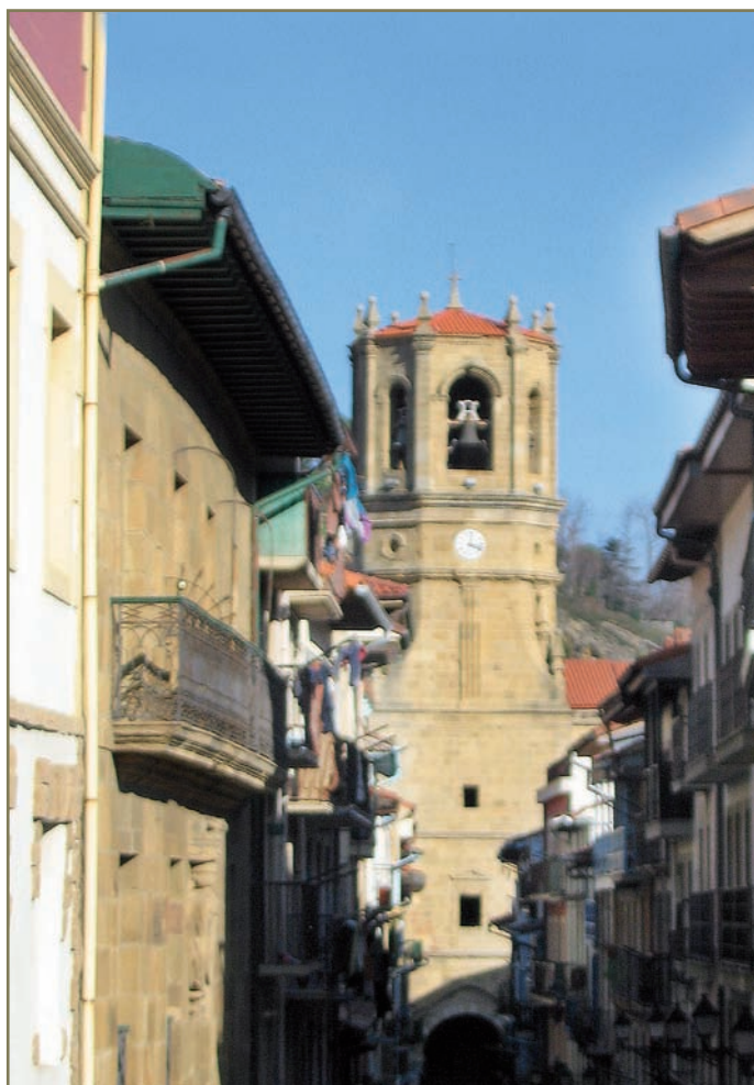
3.10. irudia. Getariako Kale Nagusia.