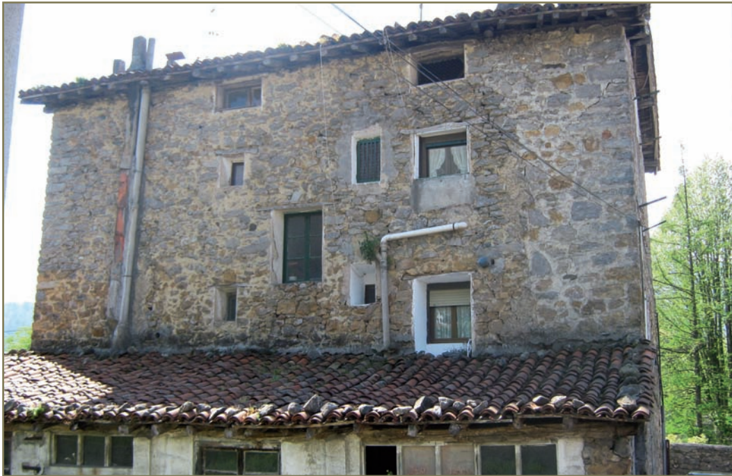
6.1. irudia. Azkoitiko Ubaiar etxea.