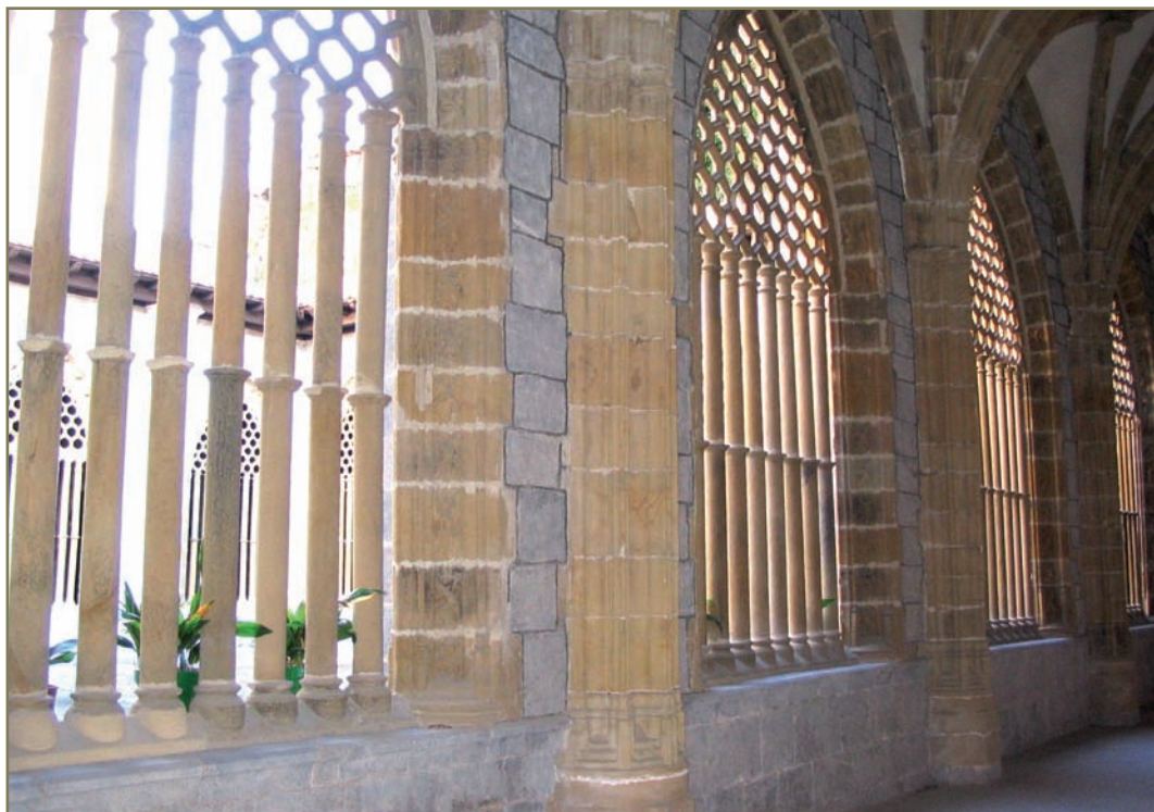
6.9. irudia. Debako Andre Mariaren elizako klaustroa.

nez, baldintzak ipini zizkieten barkamena lortzeko (bakoitzak 100 dukat ordaintzea, besteak beste) 14 .