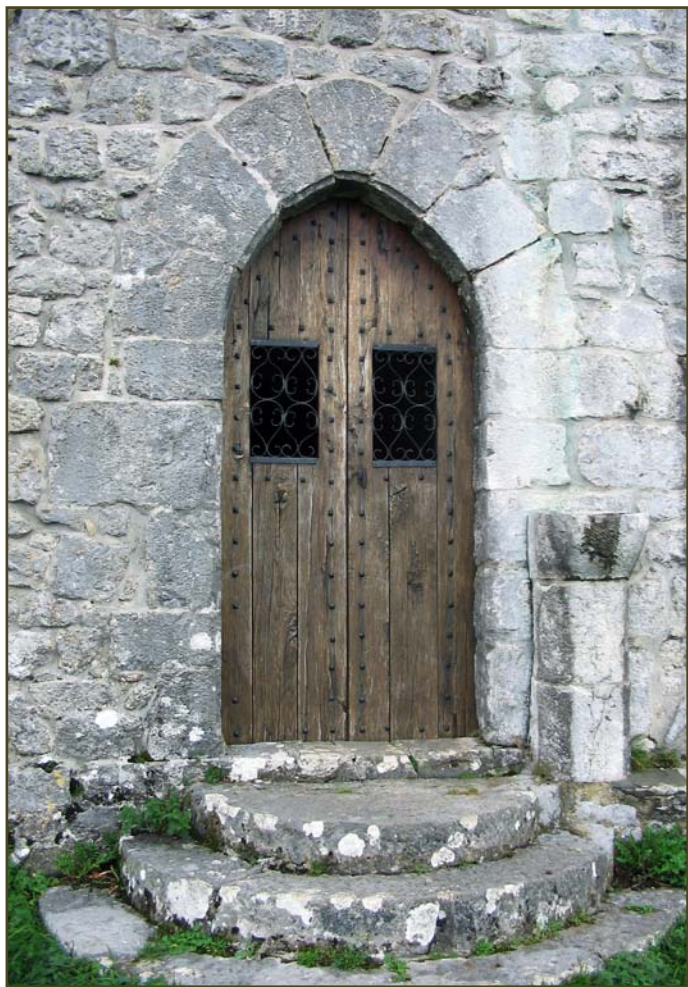
6.17. irudia. Santa Engraziako ataria.