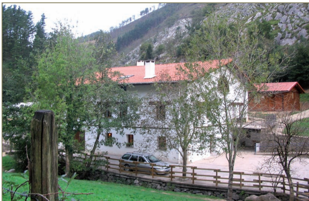
6.10. irudia. Sastarrain baserria.