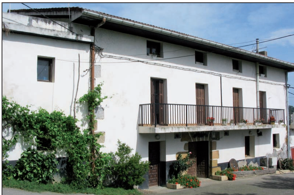
6.19. irudia. Arroako Larretxezar.