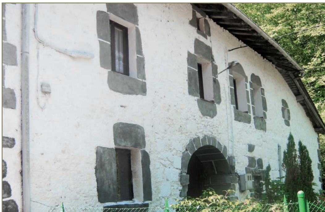
6.3. irudia. Altzolarats (behekoa) edo Bekola.