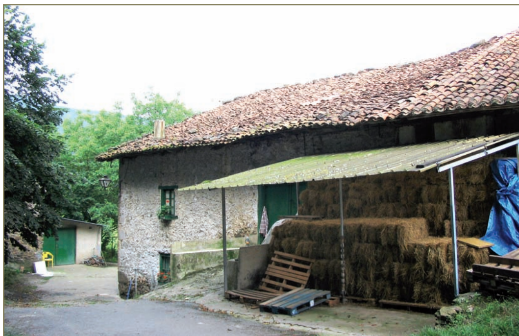
6.2. irudia. Arroagoia. Armendi baserria.