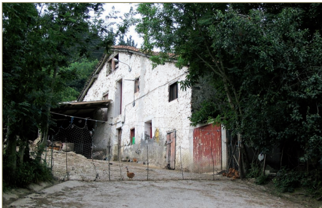
6.7. irudia. Arroagoiko Goikoetxe baserria.