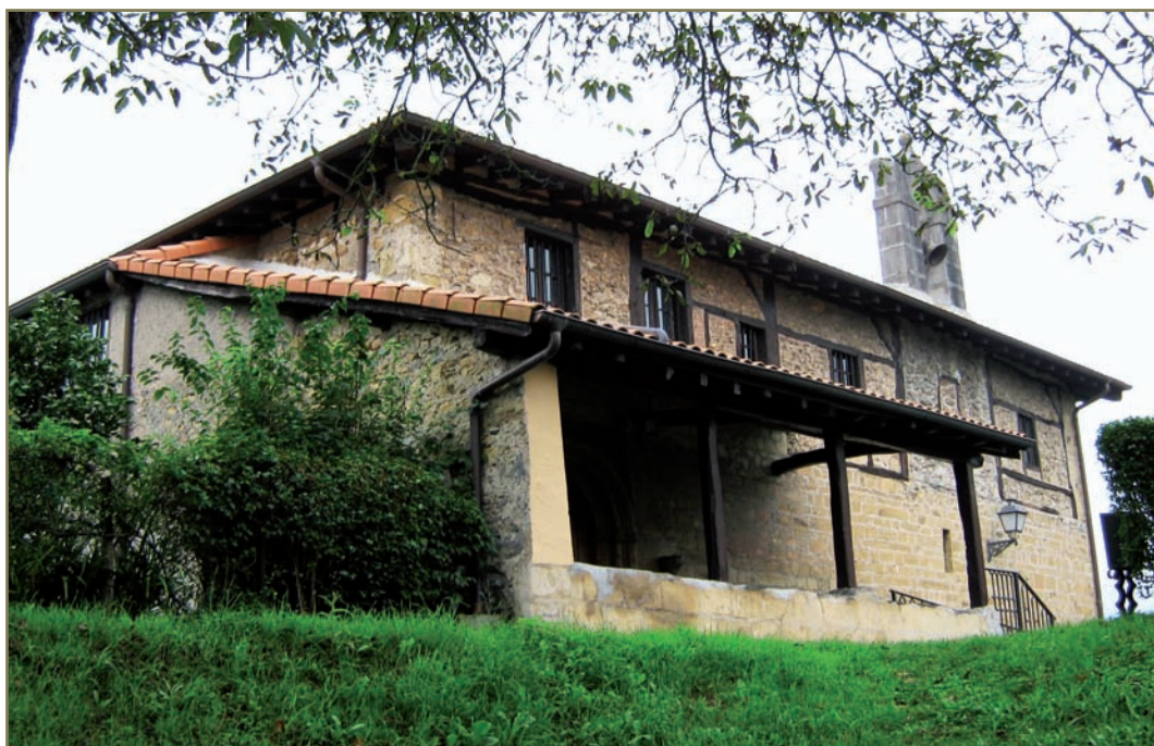
6.5. irudia. Azpeitia. Olazko ermita.