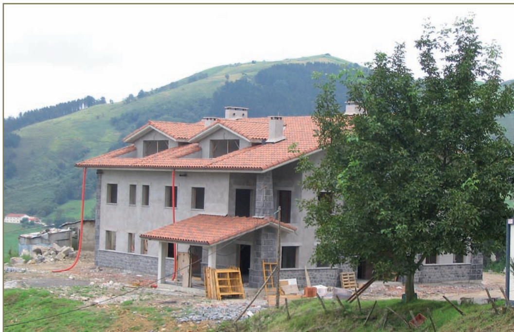
6.11. irudia. Aizarnabate edo Aizarnatea.