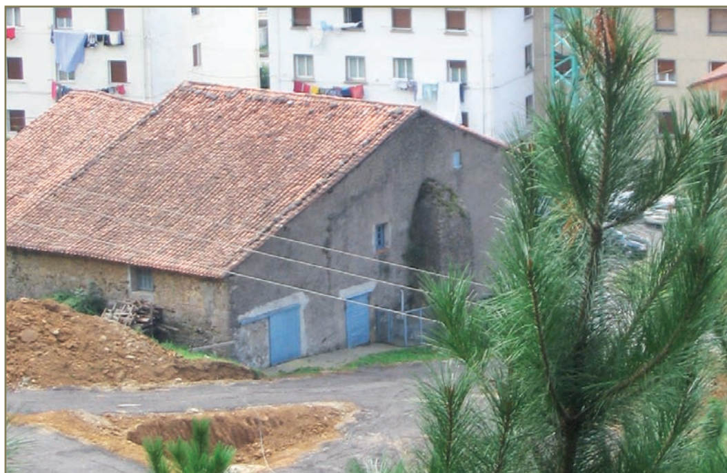
6.4. irudia. Artiga edo Artia baserria (desagertua).