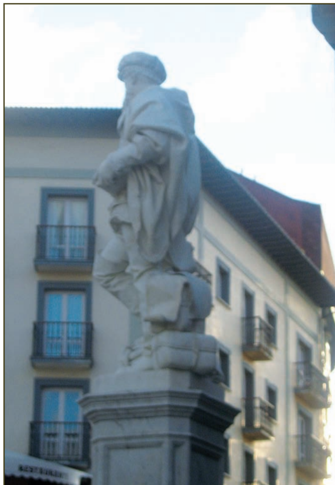
6.6. irudia. Getariako Joan Sebastian Elkano.