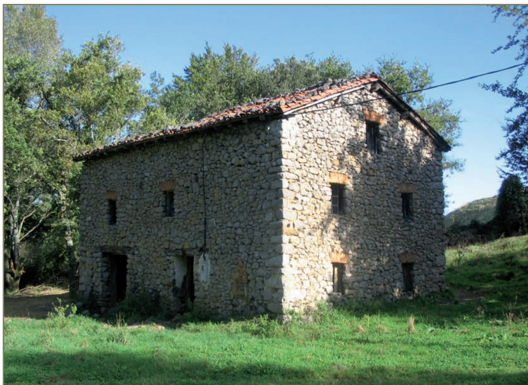
6.18. irudia. Aizarnako Aisoro (Autsoro) baserria.