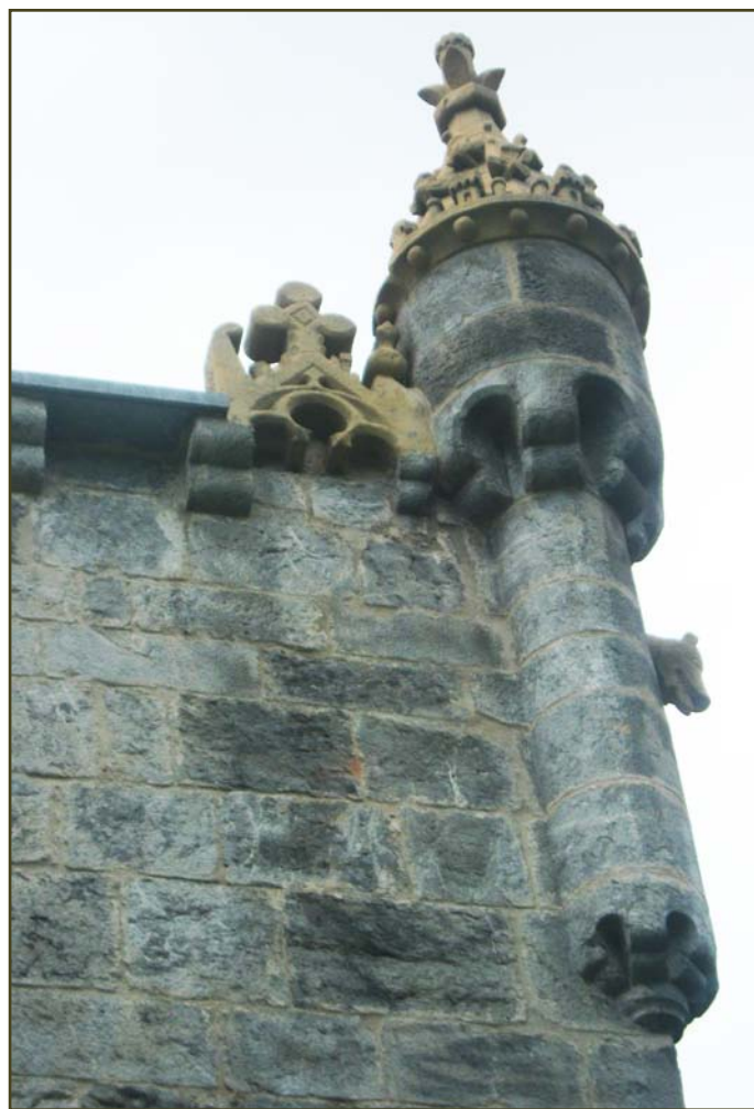
6.20. irudia. Lili jauregiko eskuineko garita.