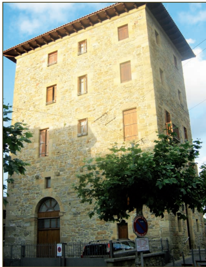
6.14. irudia. Getariako Aldamar etxea.