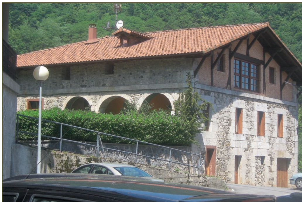
6.12. irudia. Lizarrarats (Lizarraitz) etxea.