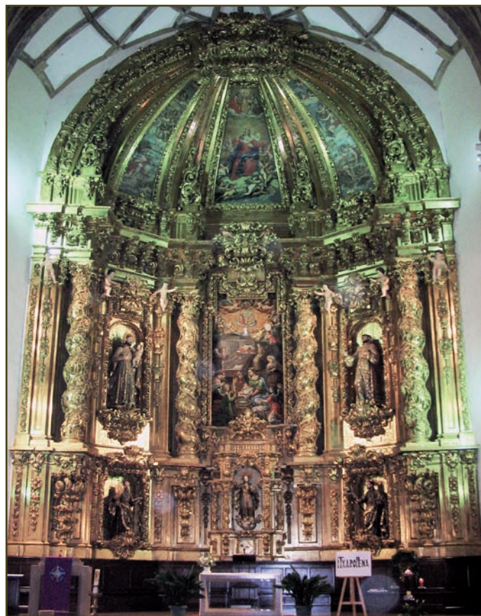
6.15. irudia. Zestoako elizako erretaula.