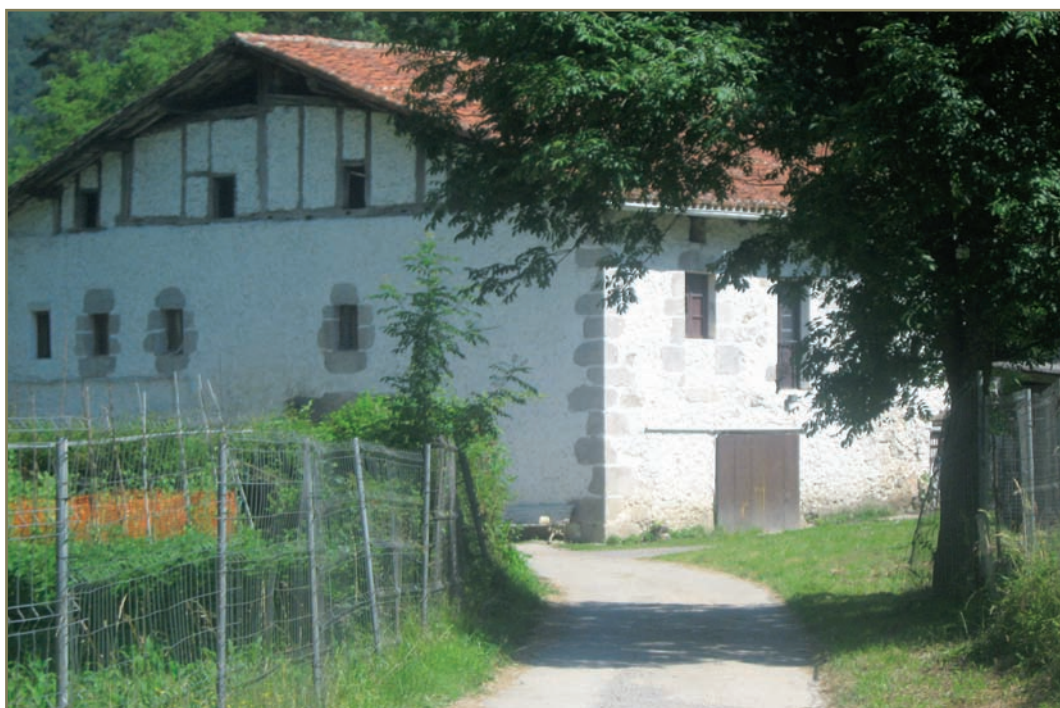
6.8. irudia. Altzolarats jauregi ondoko Olalde (lehen burdinola).