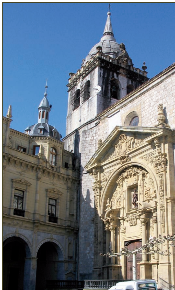
6.21. irudia. Hernaniko eliza.