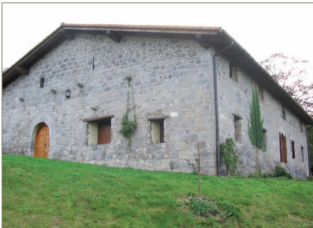
6.16. irudia. Aizarnako Egaña baserria.