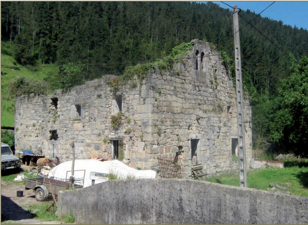
5.1. irudia. Altzolarasko jauregiaren aurriak.