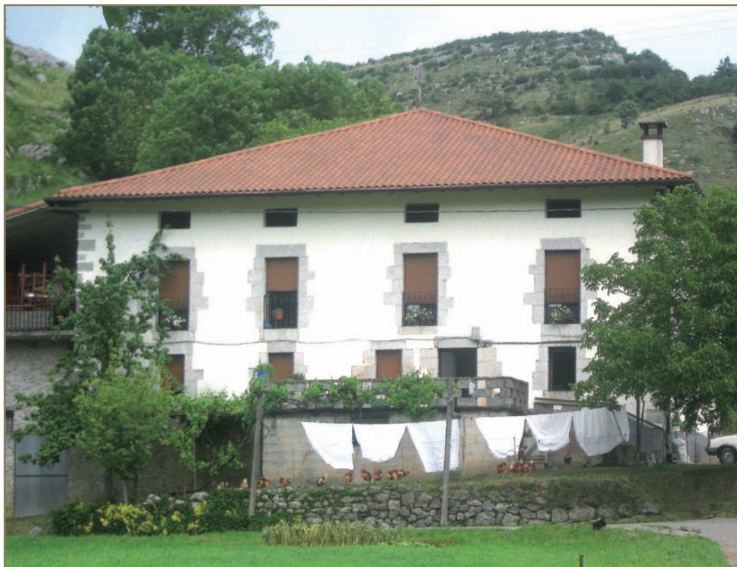
5.9. irudia. Aizarnako Apategi baserria.