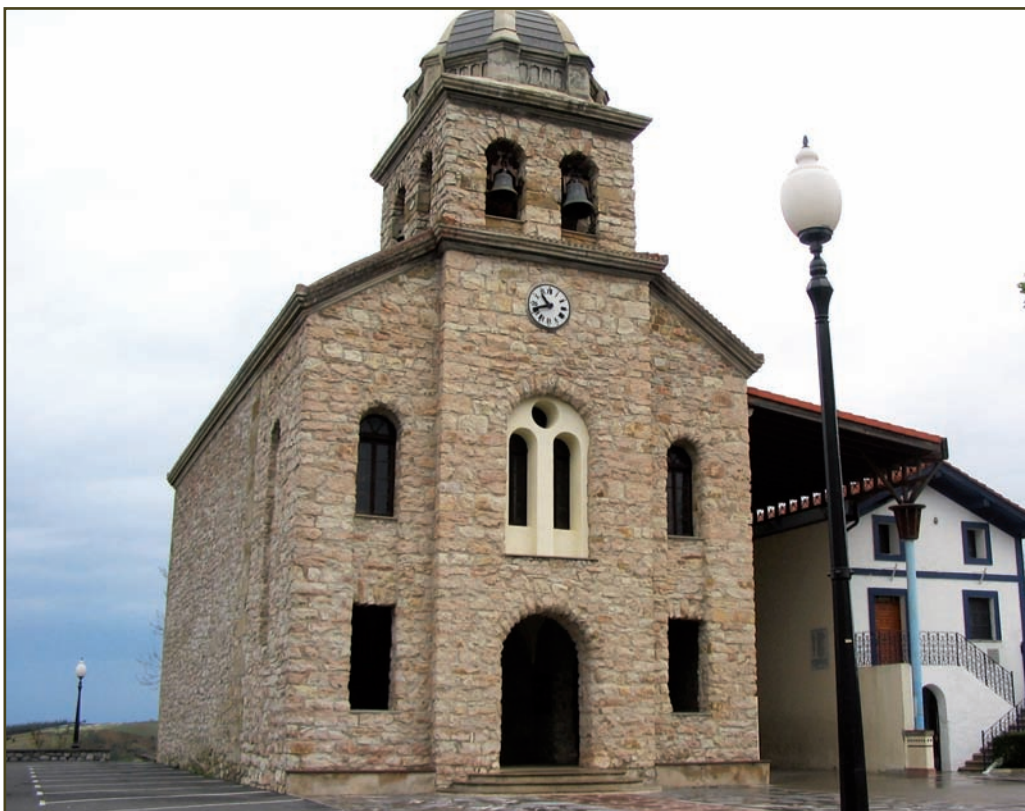
5.15. irudia. Zumaiako Artadiko San Migel.