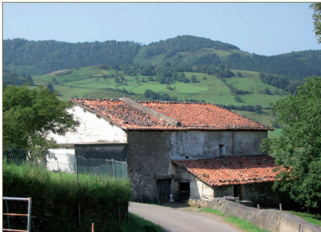
5.7. irudia. Zestoako Ondalde baserria.