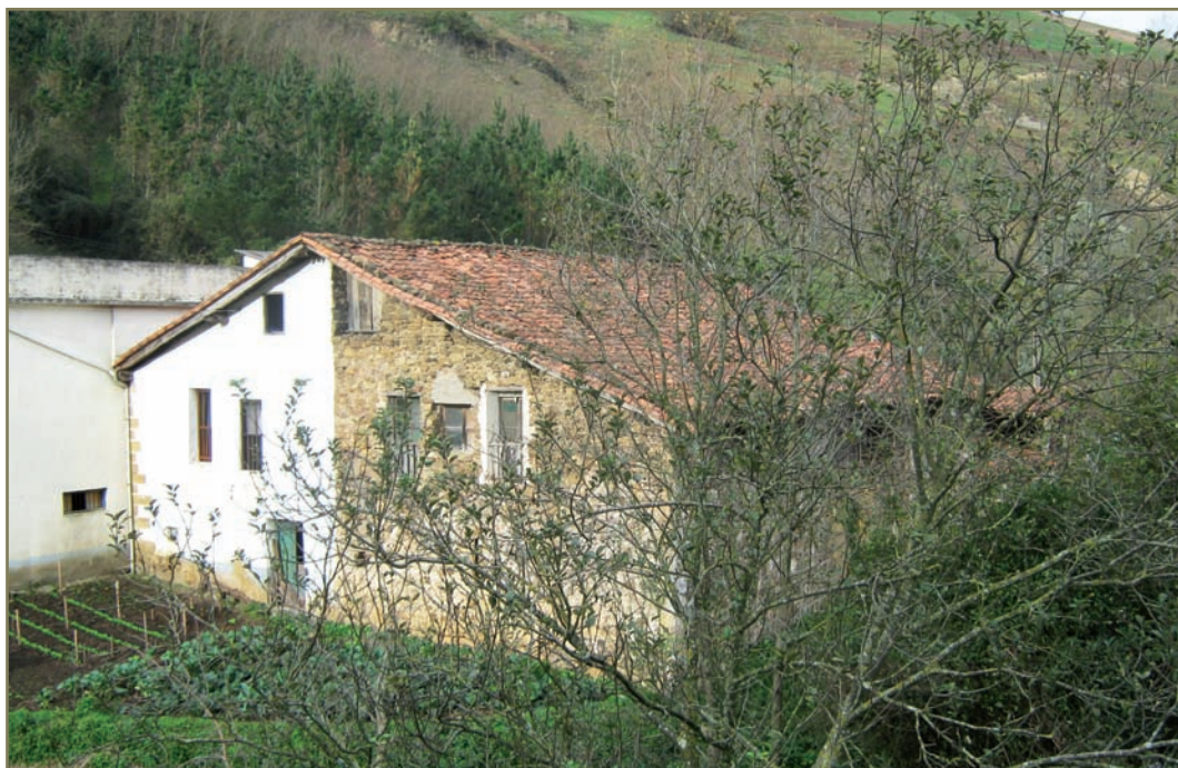
5.17. irudia. Aiako Segurola baserria.