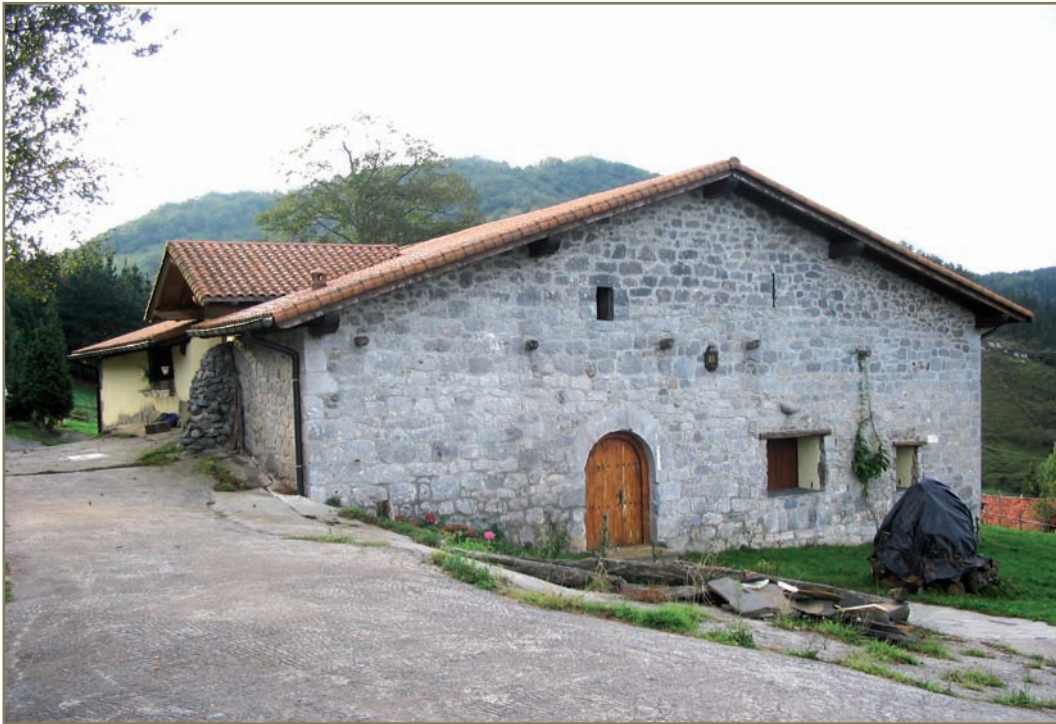
5.5. irudia. Aizarnako Egagoikoa.