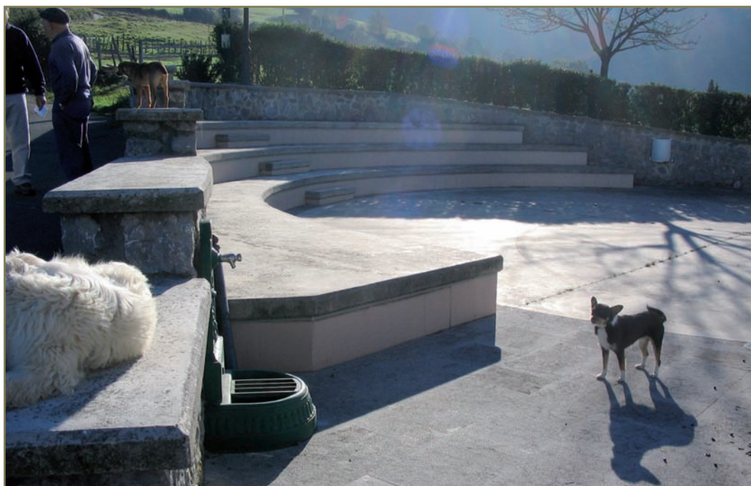
5.14. irudia. Aizarnazabalgo Saiazko plazatxoa.

- 1517-VI-10ean, Valladoliden, Gipuzkoako korrejidoreordeak emandako epaiaren aurkako apelazioa