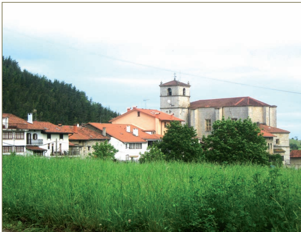
5.8. irudia. Aizarnako bista.