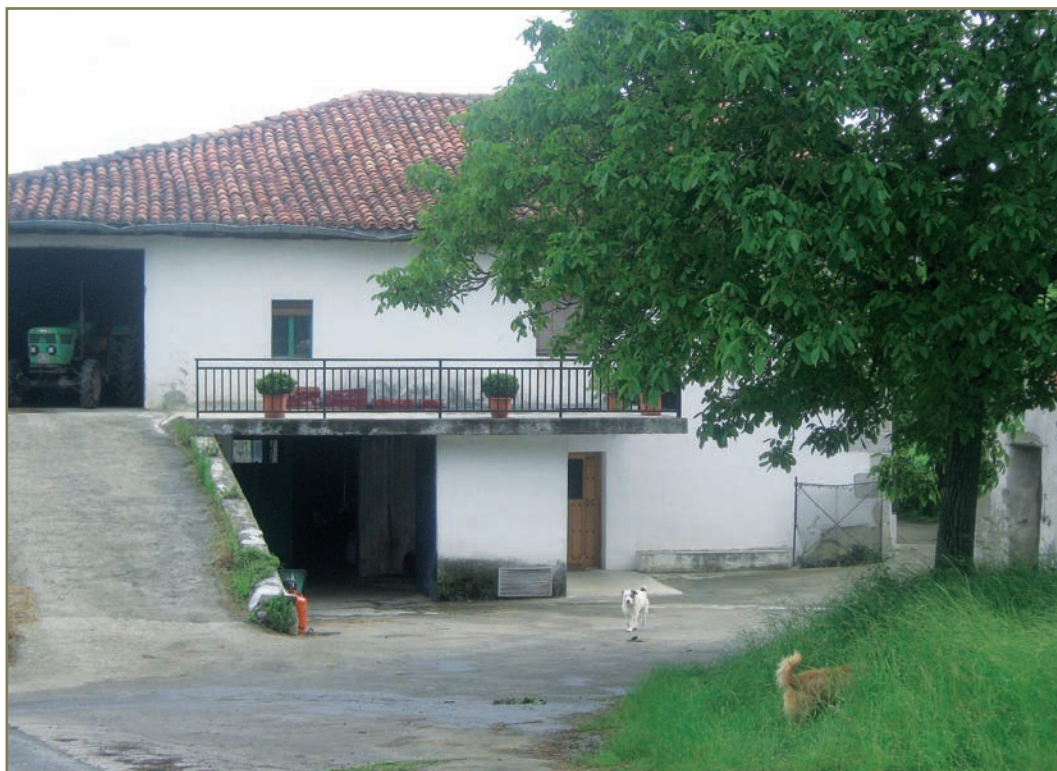
5.10. irudia. Aizarnako Etxeberri.

Migel eguna arteko epean zorraren beste 3 dukatak eman egin beharko zizkioten.