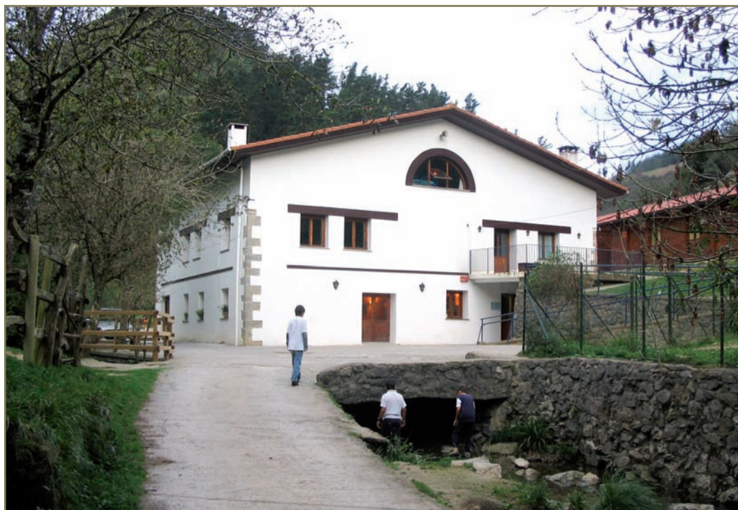
5.11. irudia. Zestoako Sastarrain baserri- eskola.