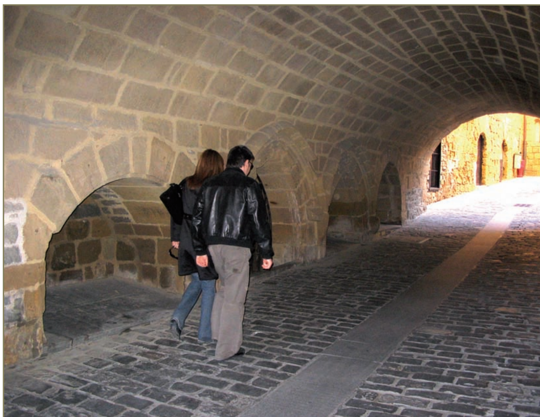
5.2. irudia. Getariako eliz azpiko pasabidea.

naren amari) 650 kintal zor zitzaizkion; baita diru eta burdina asko ere beste zenbait pertsonari.