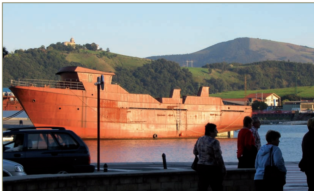
5.16. irudia. Zumaiako itsasadarra.

- 1517-X-12an, Tolosan, korrejidoreordeak agindua eman zien Zumaiako Kontzejukoei, aurkeztu zituzten eskrituren kopia Saiazkoen esku utz zezaten.