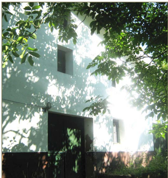
5.12. irudia. Zestoako Ausoroetxea baserria.

- 1517-IV-30ean, Valladolidtik, auziaren amaiera gisa errege-gutun betearazlea bidali zuten. Bertan prozesu osoaren laburpena eta emandako epaiak jakinarazten dira, hau da, guk aipatutako ataletan azaldutakoaren laburpena egiten du (ikus [XVI. m. (17) 21] agiria).