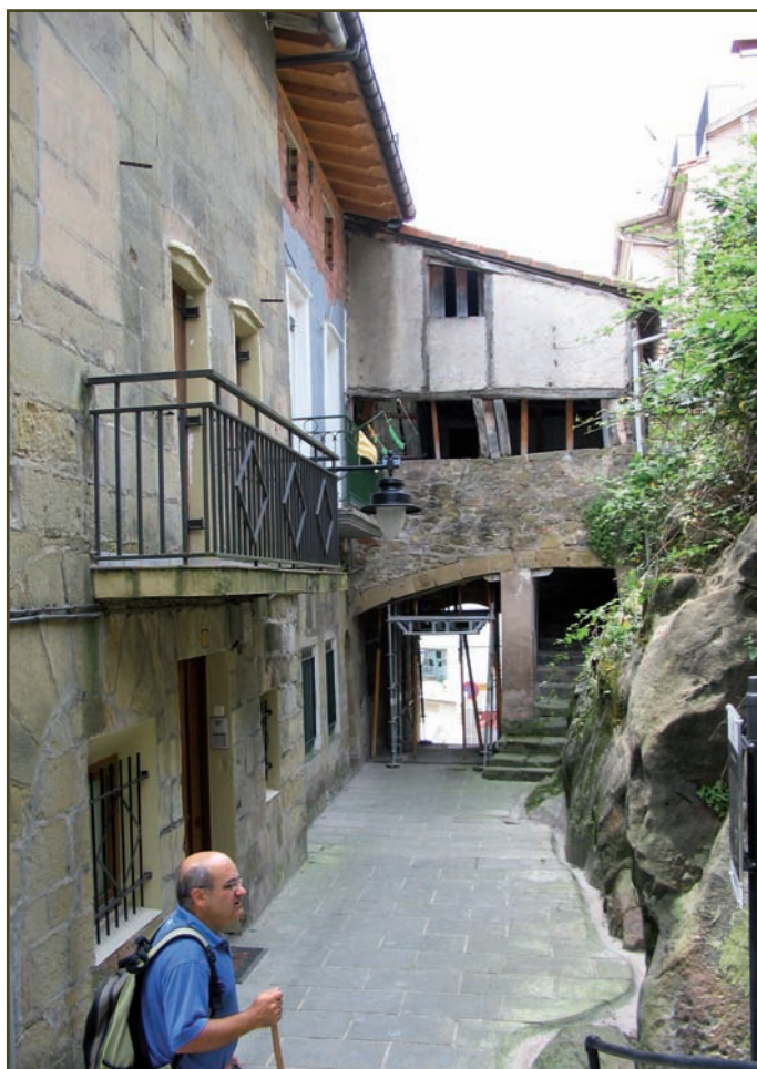
5.4. irudia. Orioko San Nikolas kalea.