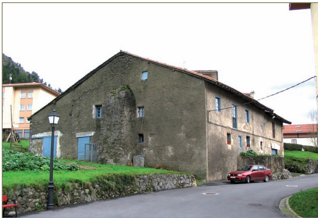
5.6. irudia. Zestoako Artiga edo Artia (desagertua).