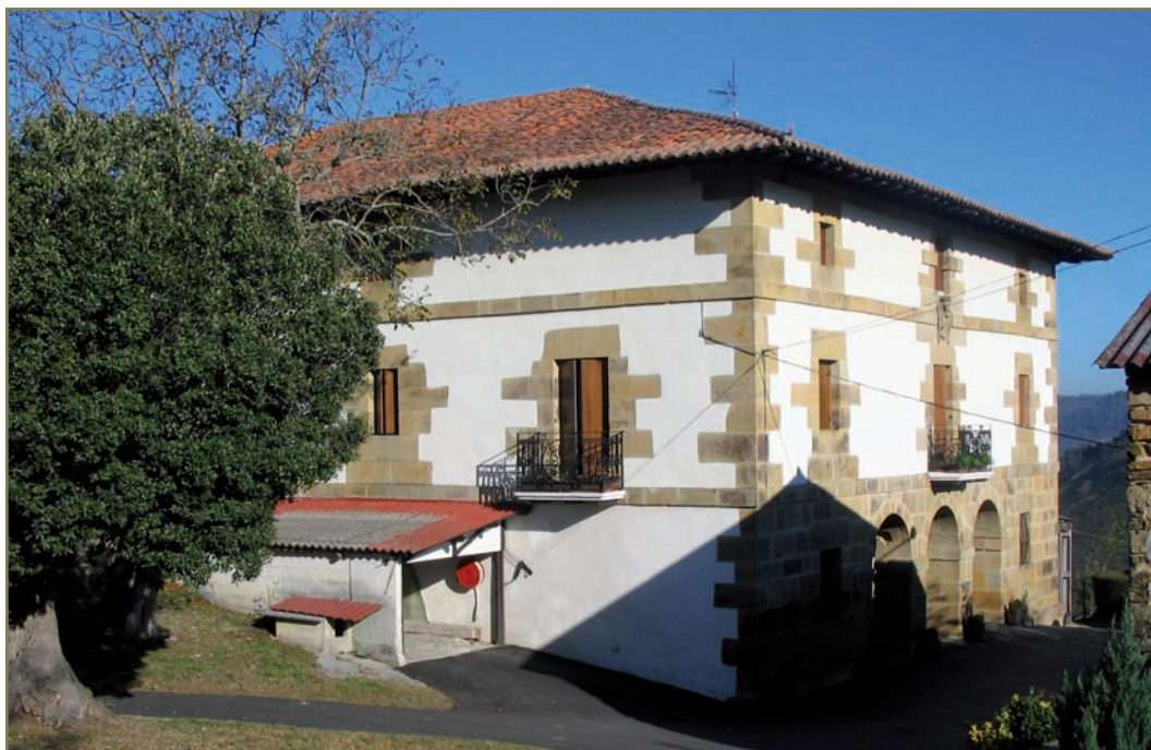
1.3. irudia. Aizarnazabalgo Atristain baserria.