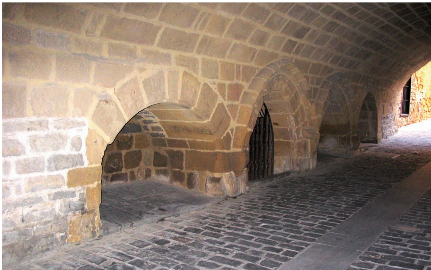
1.15. irudia. Getariako eliza ondoko pasabidea.