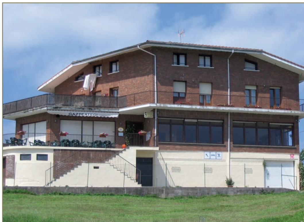
1.22. irudia. Zarautz. Elkanoko Gasteategi etxea.