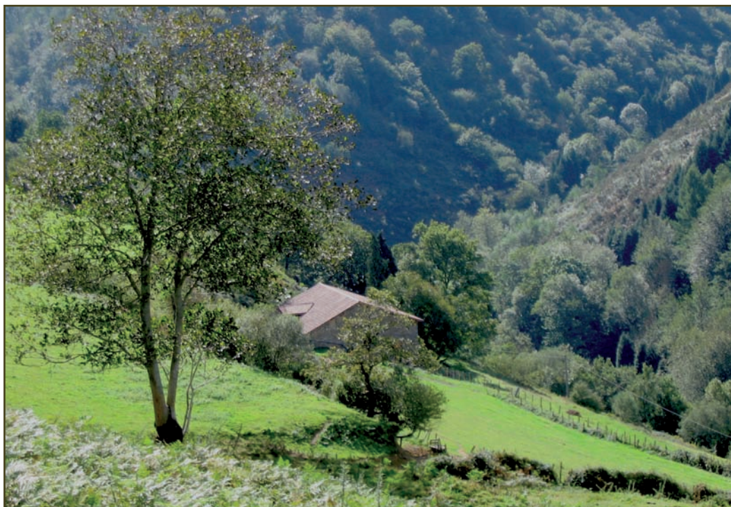
1.8. irudia. Bedamako Barrenaroe (oraingo Barrenaroe).