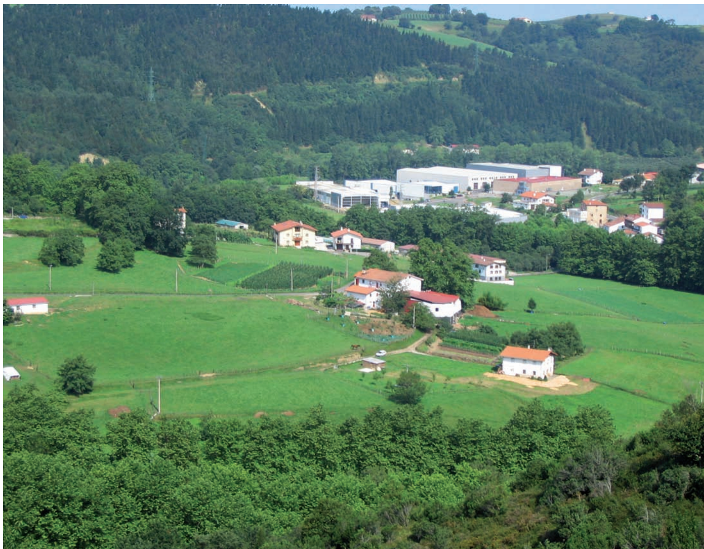
1.7. irudia. Aizarnazabalgo Zubialde.

Gastuak guztira 18.039 maraikoak ziren. Herena, hau da, 6.013 marai, Saiazek (Aizarnazabal eta Oikiak) ordaindu behar zuten.