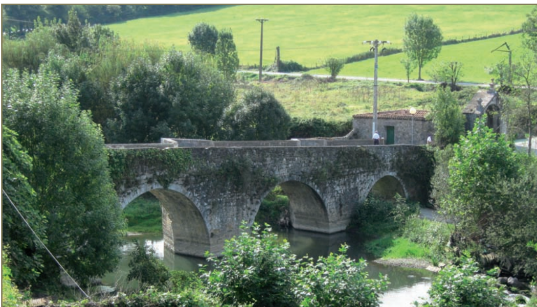
1.25. irudia. Zubimusuko zubia eta presa.

Joan Perez Eizagirrekoa erreginaren eskribau zela aipatzen da, eta ez erregearen eskribau. Bestalde, Aizubiko erroten presa, gure ustez, orain bezala Zubimusun zegoen.