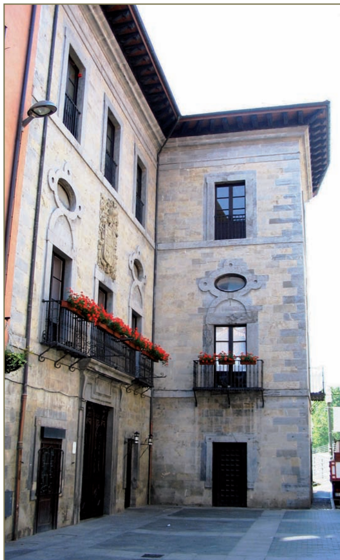
1.16. irudia. Tolosako Idiakaitz jauregia.