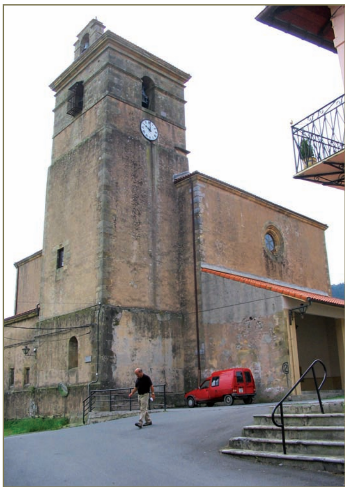
1.2. irudia. Arroagoia. Eliza.