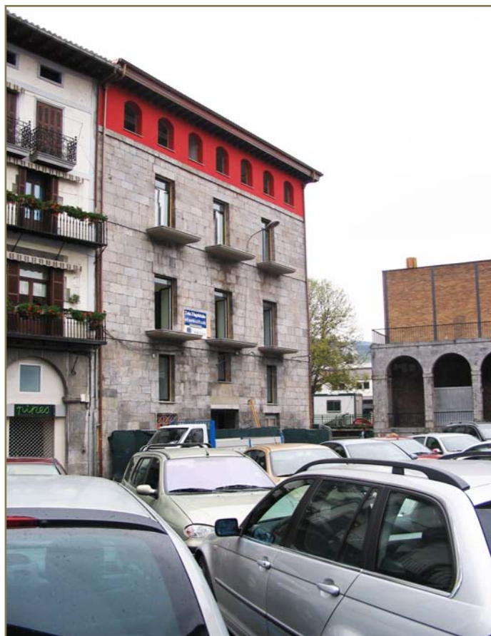
1.14. irudia. Azpeitiko plaza.