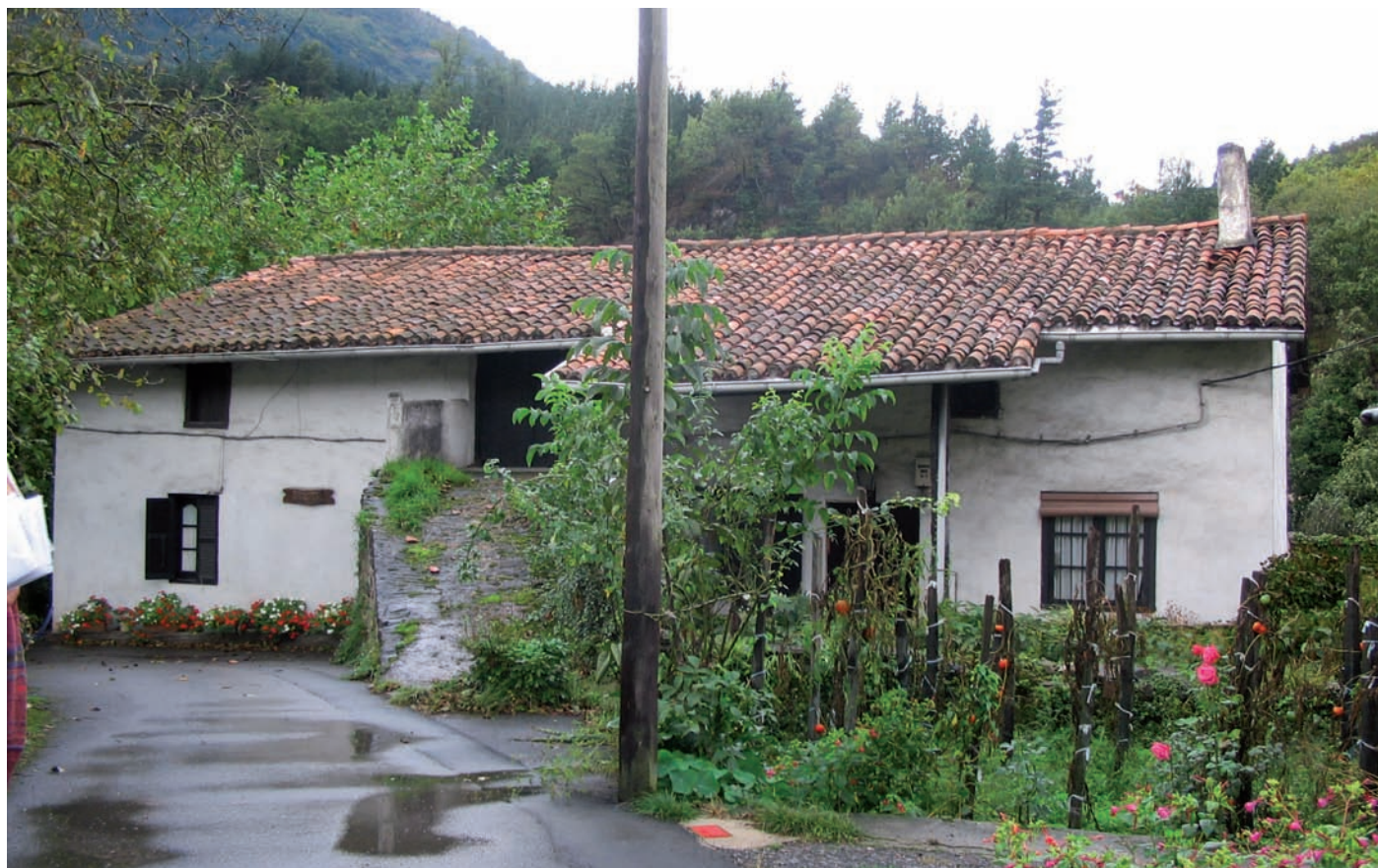
1.13. irudia. Lasako errota.