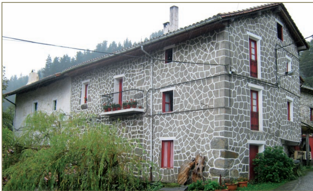
1.26. irudia. Azpeitia. Matxinbentako Isurola.