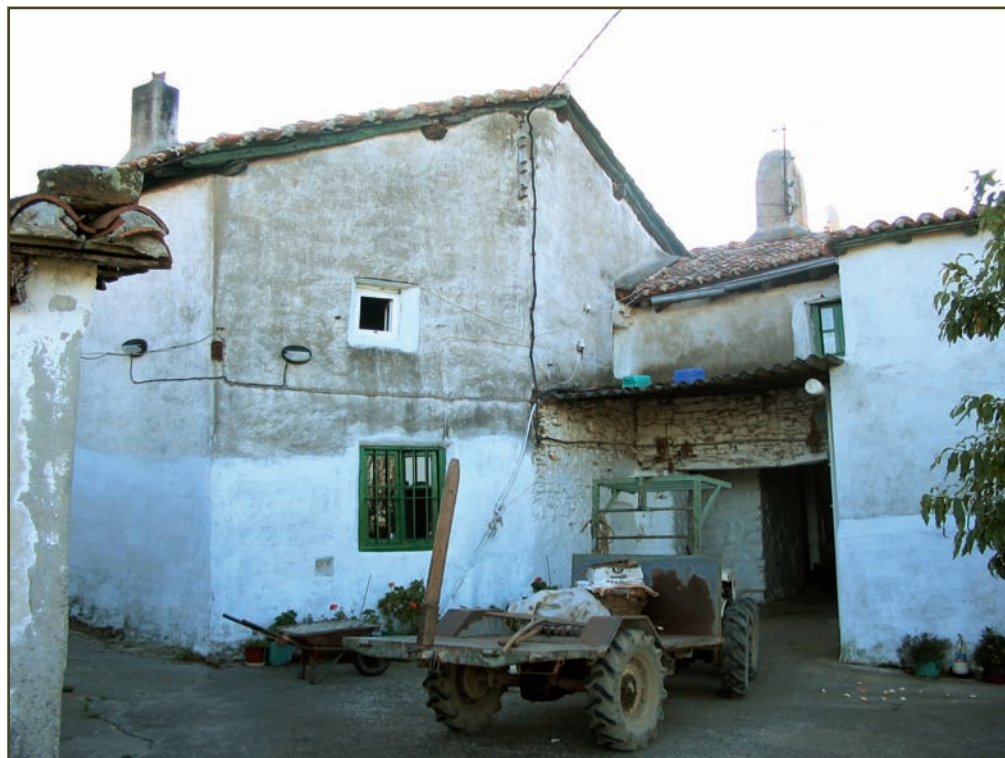
1.10. irudia. Aizarnazabalgo Saiazko San Kristobal Iroztegikoa ermita.

- Zumaia eta Saiazek 34 sukalderena probintziari ordaintzeko, 2.297 marai.