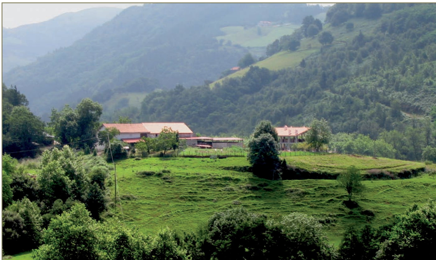
1.19. irudia. Aizarnazabalgo Amilibiaundi.