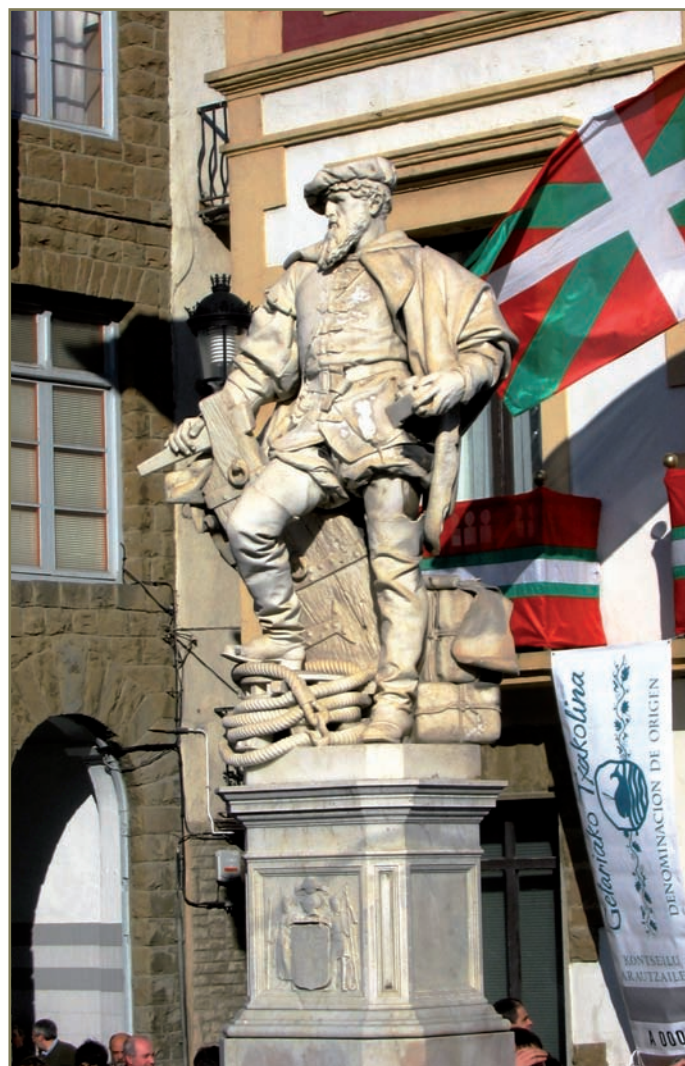
1.17. irudia. Getaria. Joan Sebastian Elkanoren monumentua.