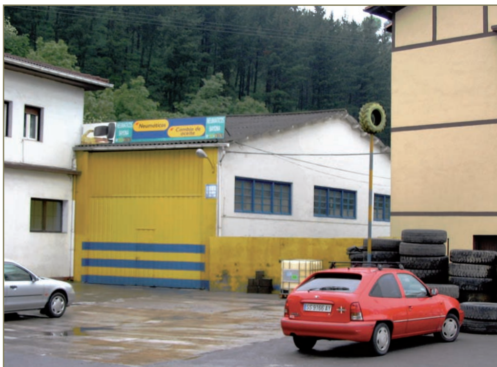
1.1.1. irudia. Narruondoko Baiona-Peña garajea.