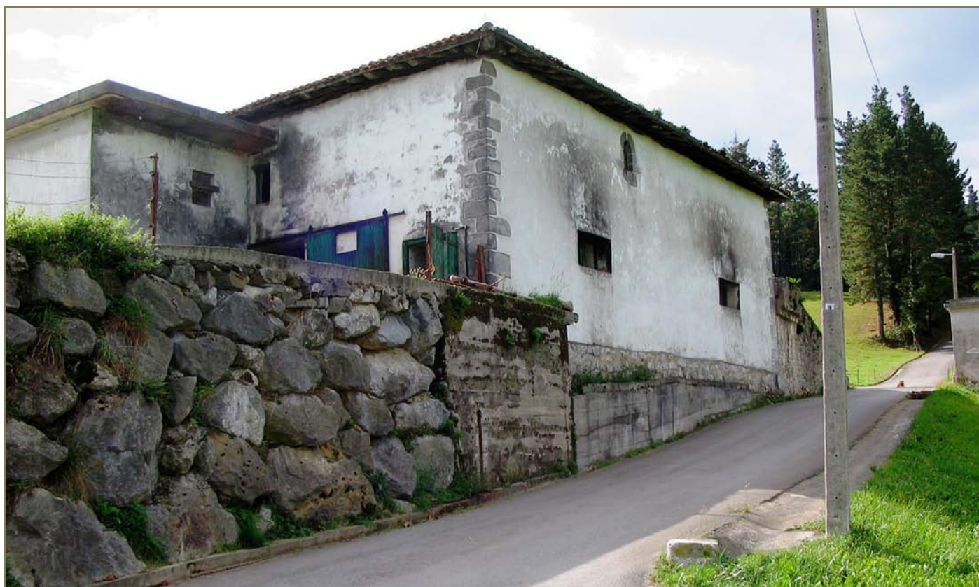
1.12. irudia. Aizarnako Etxeberri baserria.