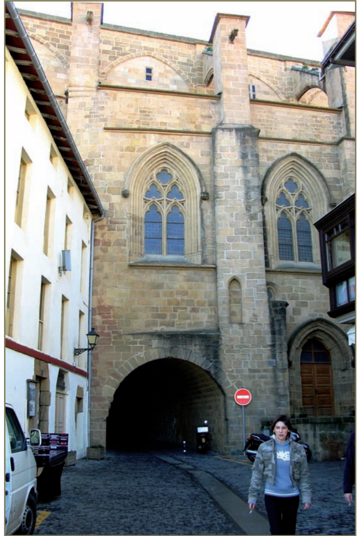
1.18. irudia. Getariako Salbatore eliza.