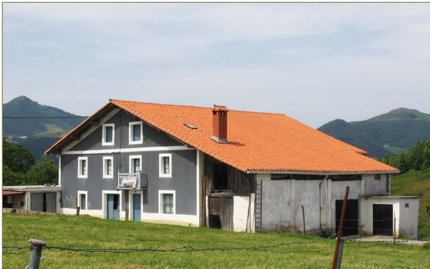
1.23. irudia. Zestoako Ibañarrietako Irureaundi.