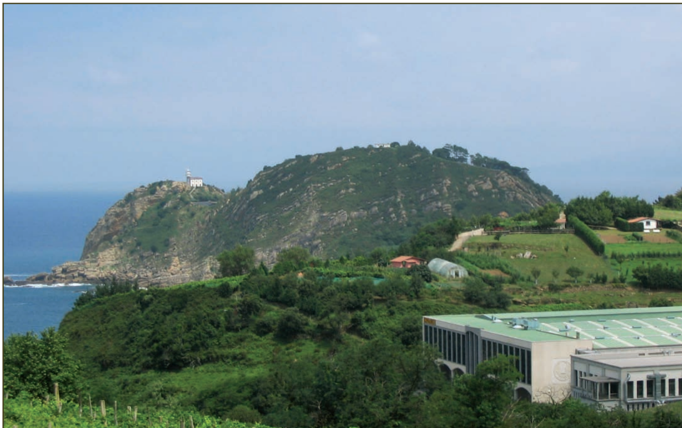
1.6. irudia. Getariako San Anton San Prudentziotik.