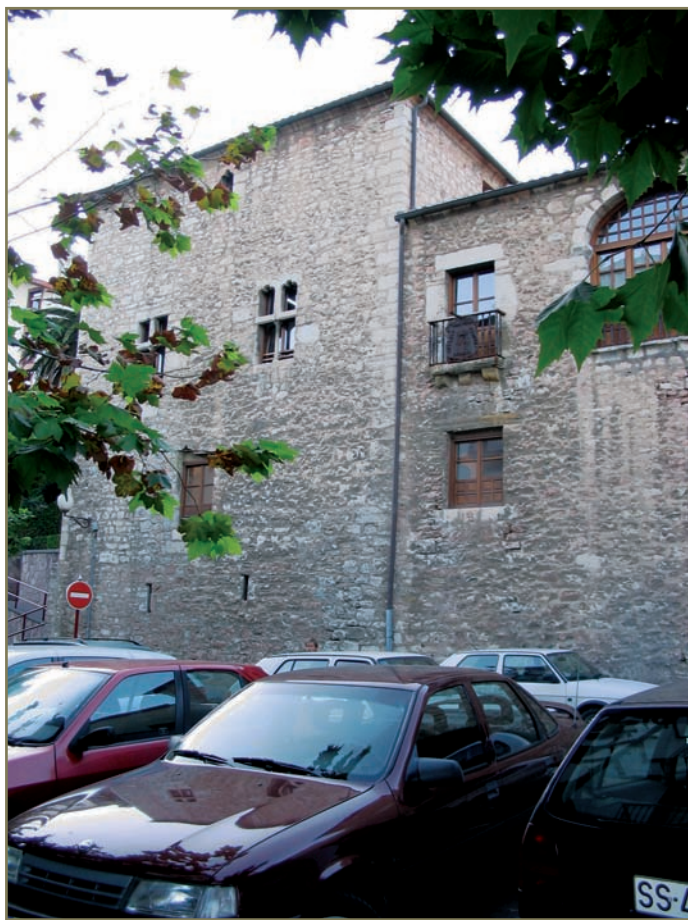
1.20. irudia. Zumaiako Ubillos jauregia.