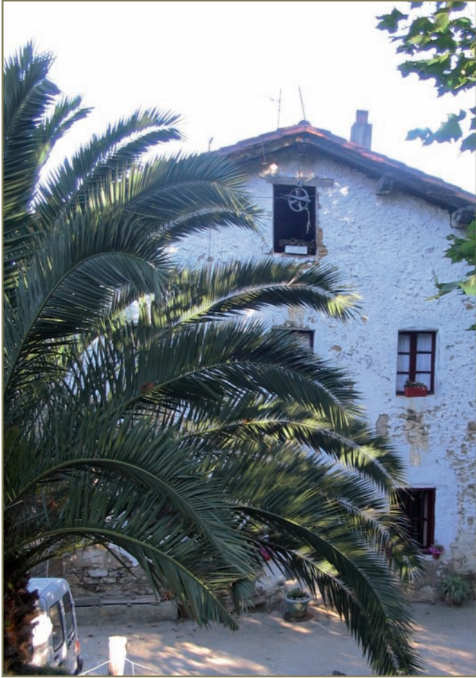
1.24. irudia. Aizarnazabalgo Enbil baserria.