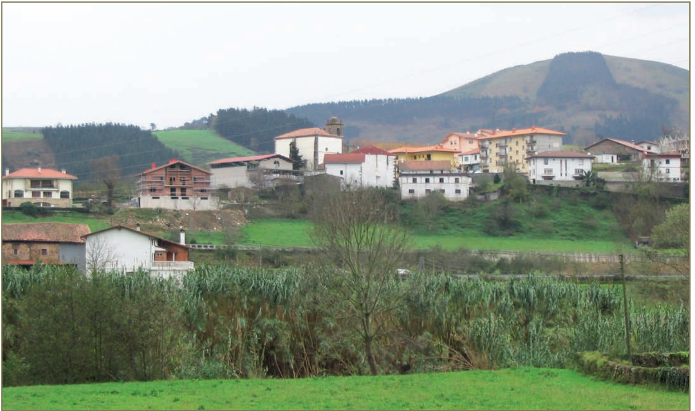
1.4. irudia. Oikia Dornutegitik.