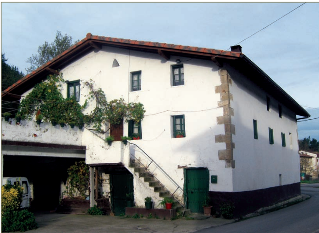
1.21. irudia. Aia. Arrazubiko Olazabal.