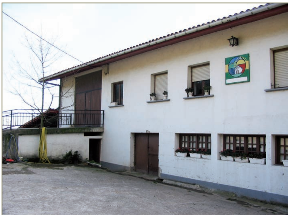
1.5. irudia. Azkoitiko Aitolazar baserria.

1502. urtean bertan, Gaztelako erreinuko mudejarrak (kristau-lurraldean bizi ziren musulmanak) behartu egin zituzten kristau bihurtzera edo erreinua uztera 16 . Otsailaren 14an eman zuten agindua, beren intolerantziatzko bideari jarraipena emanaz, Errege Katolikoek .