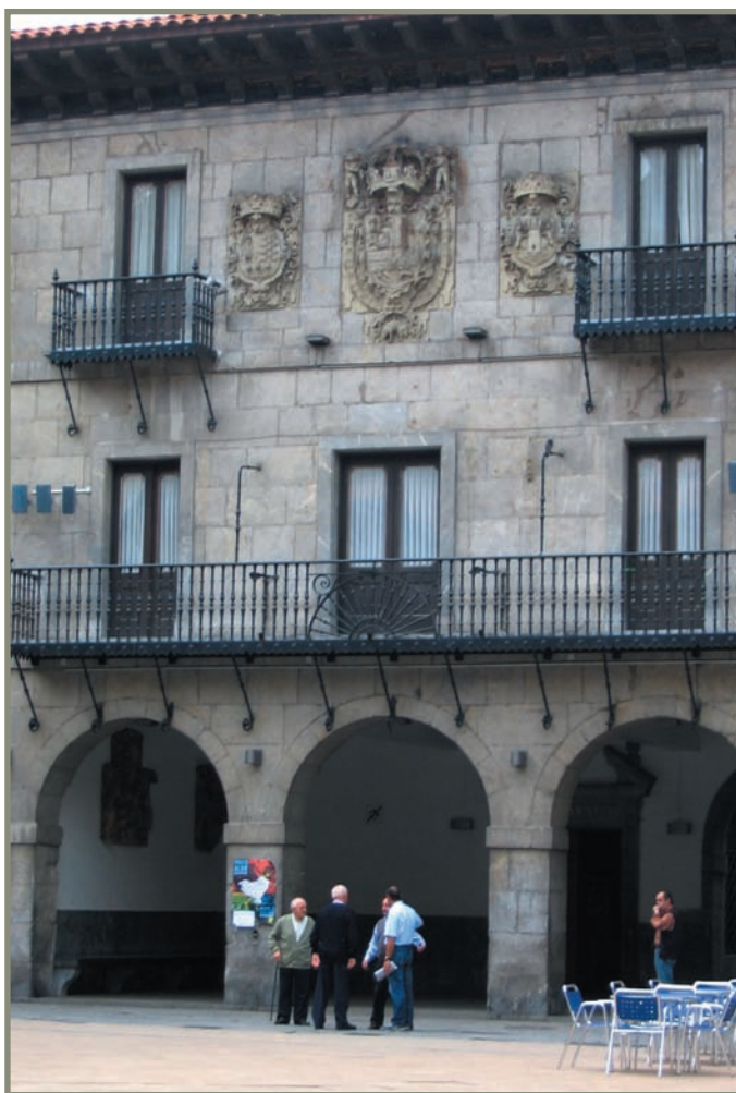
9.2. irudia. Debako udaletxea.

Urte hartan Bizkaiko itsasoaren kostaldeko herrietatik (besteak beste, Bizkaitik eta Gipuzkoatik) itsasontziak joan ziren Portugalgo erregearen ontzidiarekin batera Ceutari erasotzera. Handik ontzi batzuk Kanarietara abiatu ziren 9 .