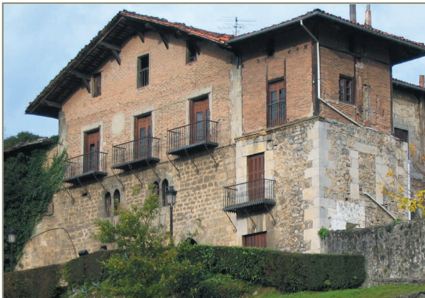
9.9. irudia. Azkoitiko Balda jauregia.