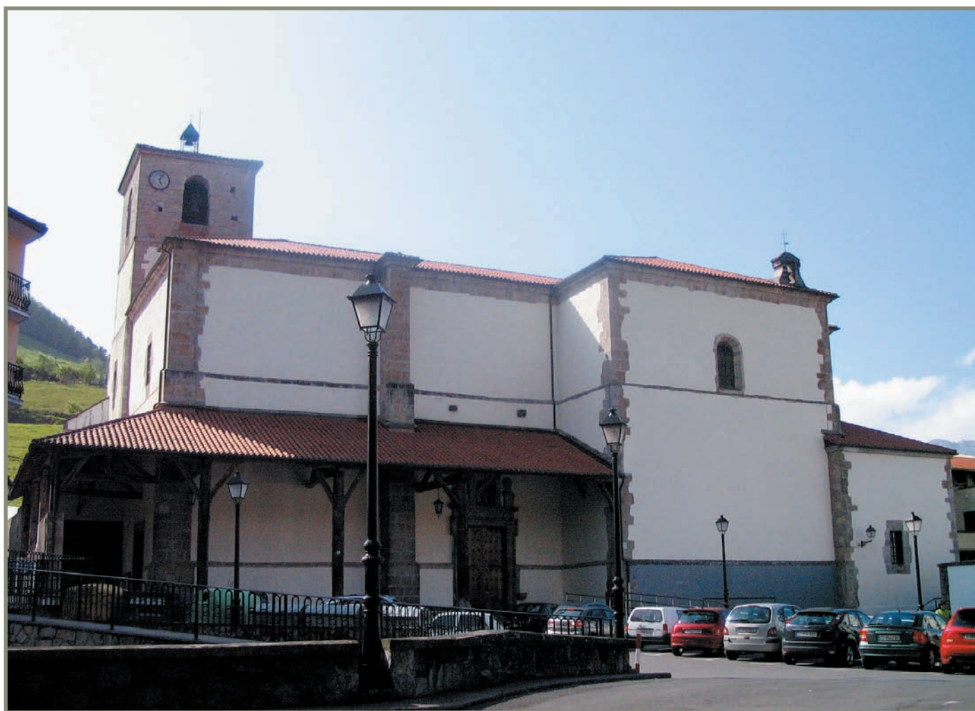
9.6. irudia. Azpeitiko Urrestillako eliza.

kargua utz zezala eskatzearren. Lehen eskea Perpinyan egin eta, handik hiru egunera (1515-XI-13an) Benedikto kostaldean Perpinyatik hegoaldera Collioure herrian zen. Han bigarren eta hirugarren aldiz eskatu zioten Aita Santu kargua utz zezan, baina berriz ere ezezkoa eman zuen. Orduan guztiek