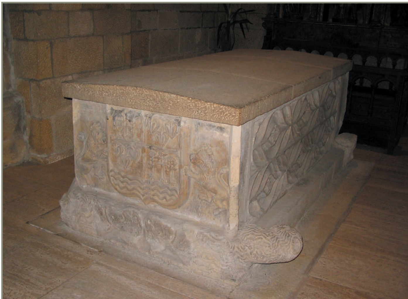
9.8. irudia. Zarauzko Andre Mariaren parrokia. Zarautz-ganboatarren hilobia.