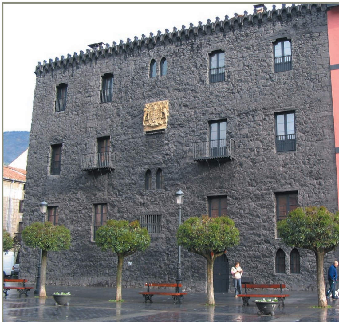
9.3. irudia. Azkoitiko Idiakaitz jauregia edo "Etxebeltz".

1413-III-19an Azkoitian Kontzejuan bilduta hiru talde elkartu ziren: harresi barruan bizi zirenak, harresi kanpo herri inguruan bizi zirenak, eta Udalerriko lurretan bizi zirenak. Denak hiribilduko jurisdikziopean egongo ziren. Kontzejuko karguak nola hautatu, zergak nola ordaindu, larreez nola baliatu, etab. erabaki zuten. Horretarako Ordenantzak egin zituzten.