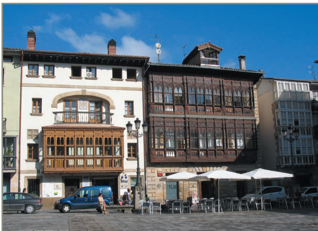
9.1. irudia. Arrasateko plaza.

Nafarroan urte hartan beste arazo bat ere izan zuten. Izurrite beltzak, izan ere, gogor kutsatu zuen biztanleria 6 .