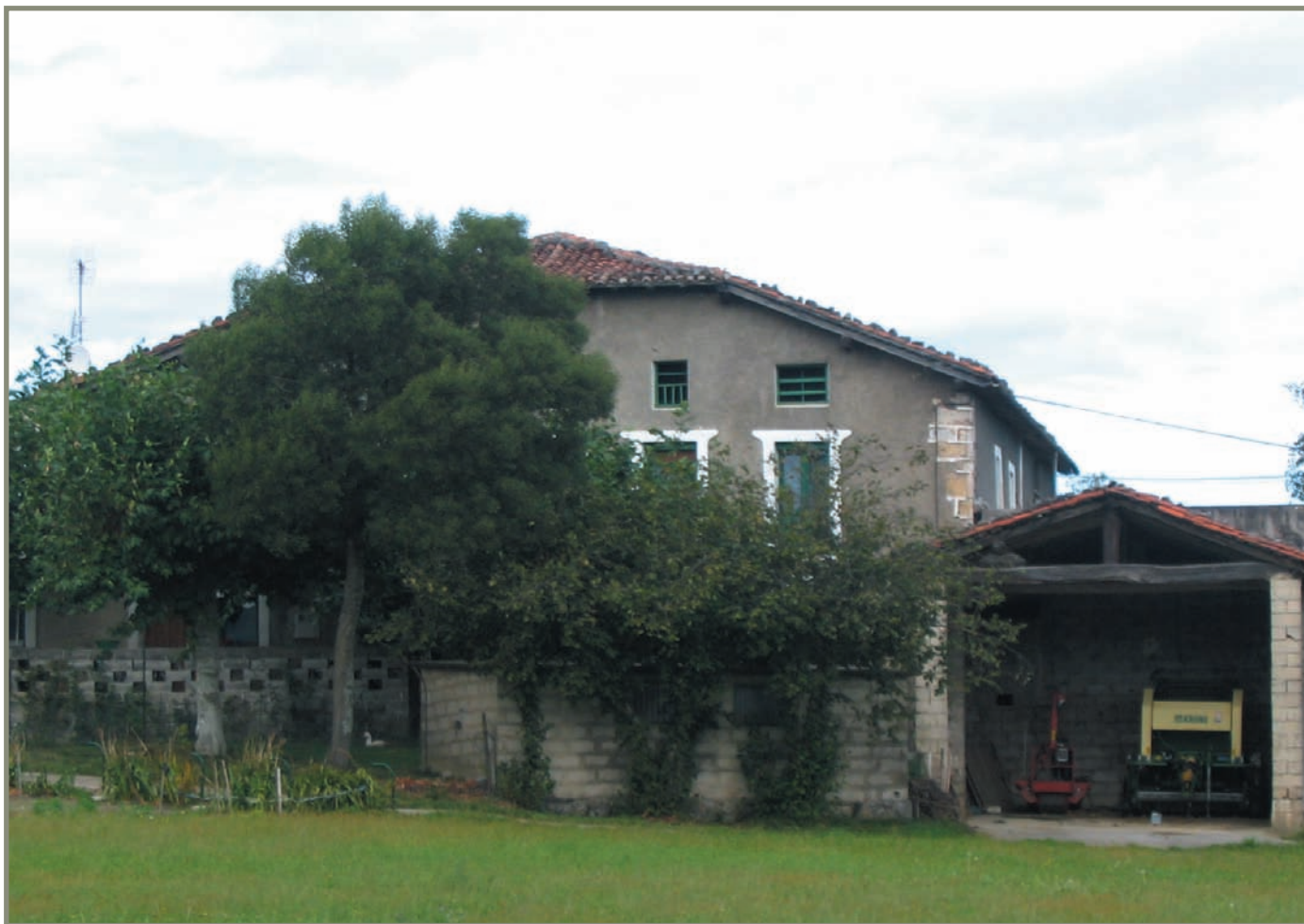
9.5. irudia. Zestoako Ezenarrogoikoa baserria.

- Merioak jasotzen zituen korrejidoreak ezarrirako isunak, eta haien herena zegokion.