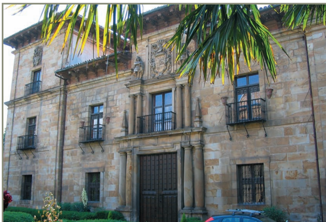
9.10. irudia. Lazkao. Infantadoko dukearen jauregia.

Getarian, bestalde, Salbatoreko eliza gotikoa amaituta zegoen 1420. urtean. Lehenagoko eliza gotiko zaharraren gainean eraiki zuten 16 . Bai Getaria eta bai Zestoa, lehenago ere esana dugunez, Iruñeko elizbarrutikoak ziren, eta 1420an, hain zuzen, Lantzelot Nafarroakoa (elizbarrutiko burua) urtarrilaren 8an hil egin zen Erriberrin. Diru-gosea eta luxu-zaletasuna izan zituen bizilagun, eta zor handiak utzi zituen. Baita sasiko semea eta alaba ere. Antso Santxez Oteitzakoa izan zen 1420-III-27az gero (1425. urtera arte) Iruñeko apezpiku, Martin V.a aita santuak izendatuta 19 .