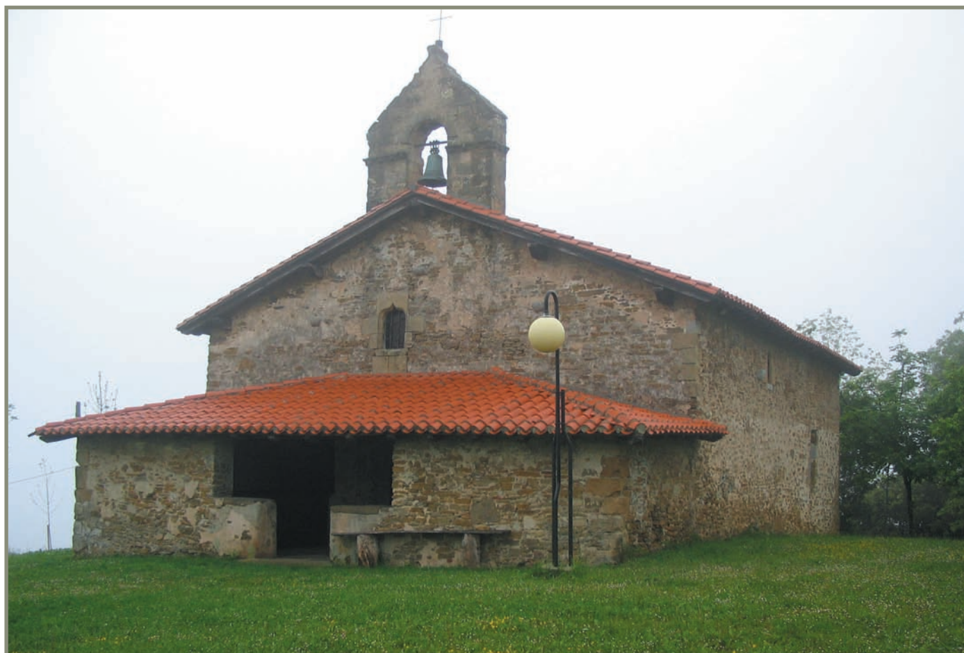
7.9. irudia. Zestoa. Beaingo San Lorente ermita.

eta, bestalde, 1399-XII-6a arte Zumaiak zituen zorretan ere ez.