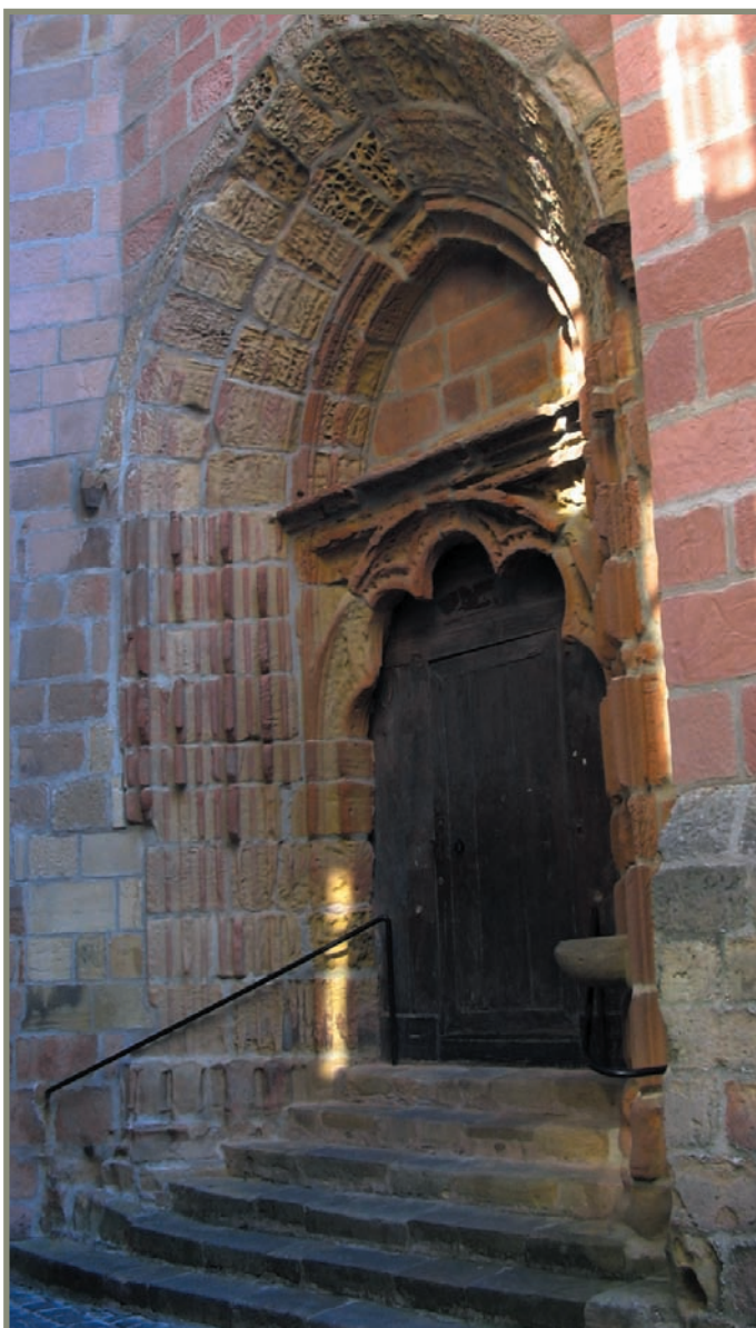
7.7. irudia. Getariako Salbatore elizako ate gotiko bat.

Getariako Batzarrean hiribilduetako eta Alkatetza Nagusietako prokuradore bakoitzak sukalde kopuru bat ordezkatzeko zuen, eta kopuru horren arabera boto kopurua zuen gero Batzarrean egiten ziren hautaketetan. Gastuak ere sukalde kopuruaren arabera ordaintzen ziren 24 .