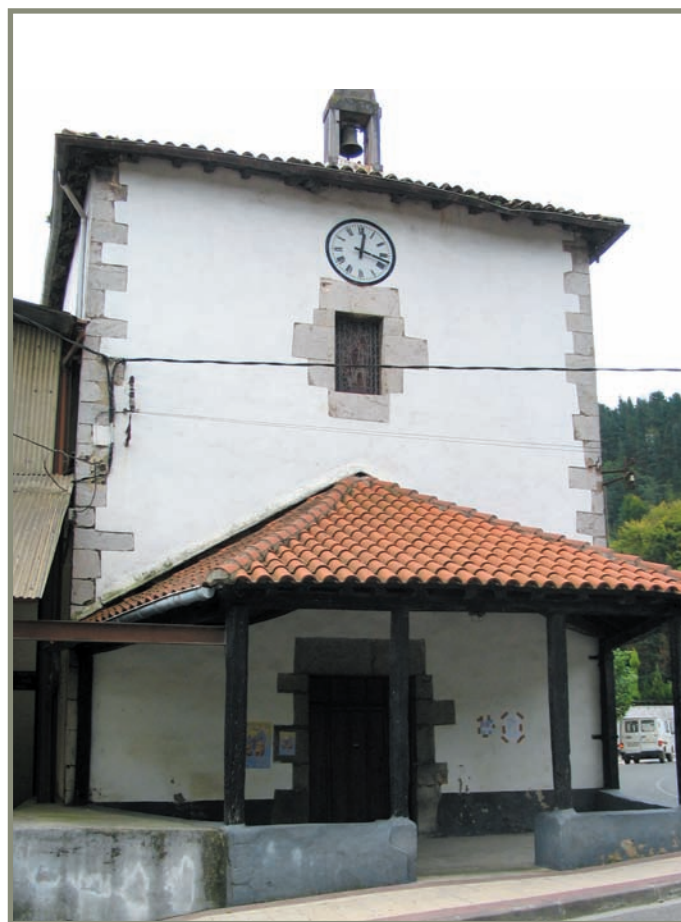
7.3. irudia. Iraetako Santa Ines ermita.