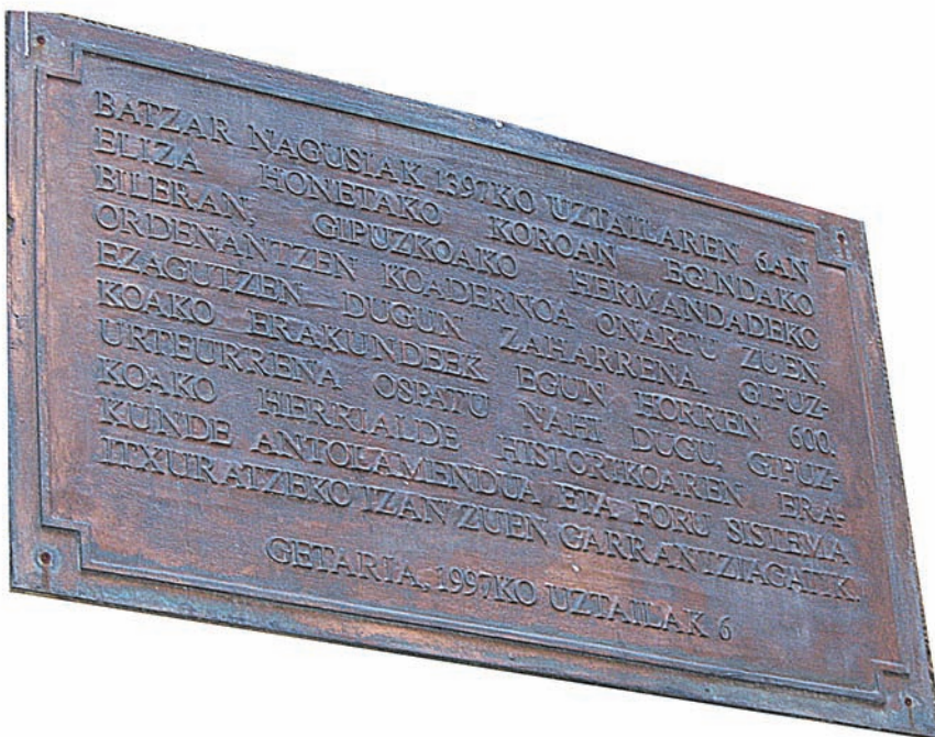
7.6. irudia. Getariako elizako plaka, ordenantzen seigarren mendeurrenean ipinia.

Getariako 1397-VII-6ko Batzarrera bildutako prokuradoreek honako herri, auzo eta alkatetza nagusi hauek ordezkatu zituzten: Hondarribia, Oiarzun, Donostia, Hernani, Urnieta, Usurbil, Zarautz, Arrasate, Orio, Getaria, Zumaia, Deba, Mutriku, Bergara, Elgeta, Azpeitia, Segura, Leintz-Gatzaga,