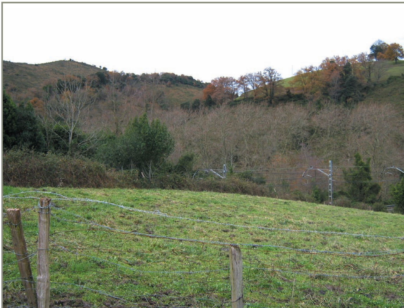
7.1. irudia. Itziar. Otabartza edo Utartza trenaren tunelaren gainean.

- Barrutian zeuden etxe eta burdinolek zeuzkaten eskubideak mantendu egingo zituzten.