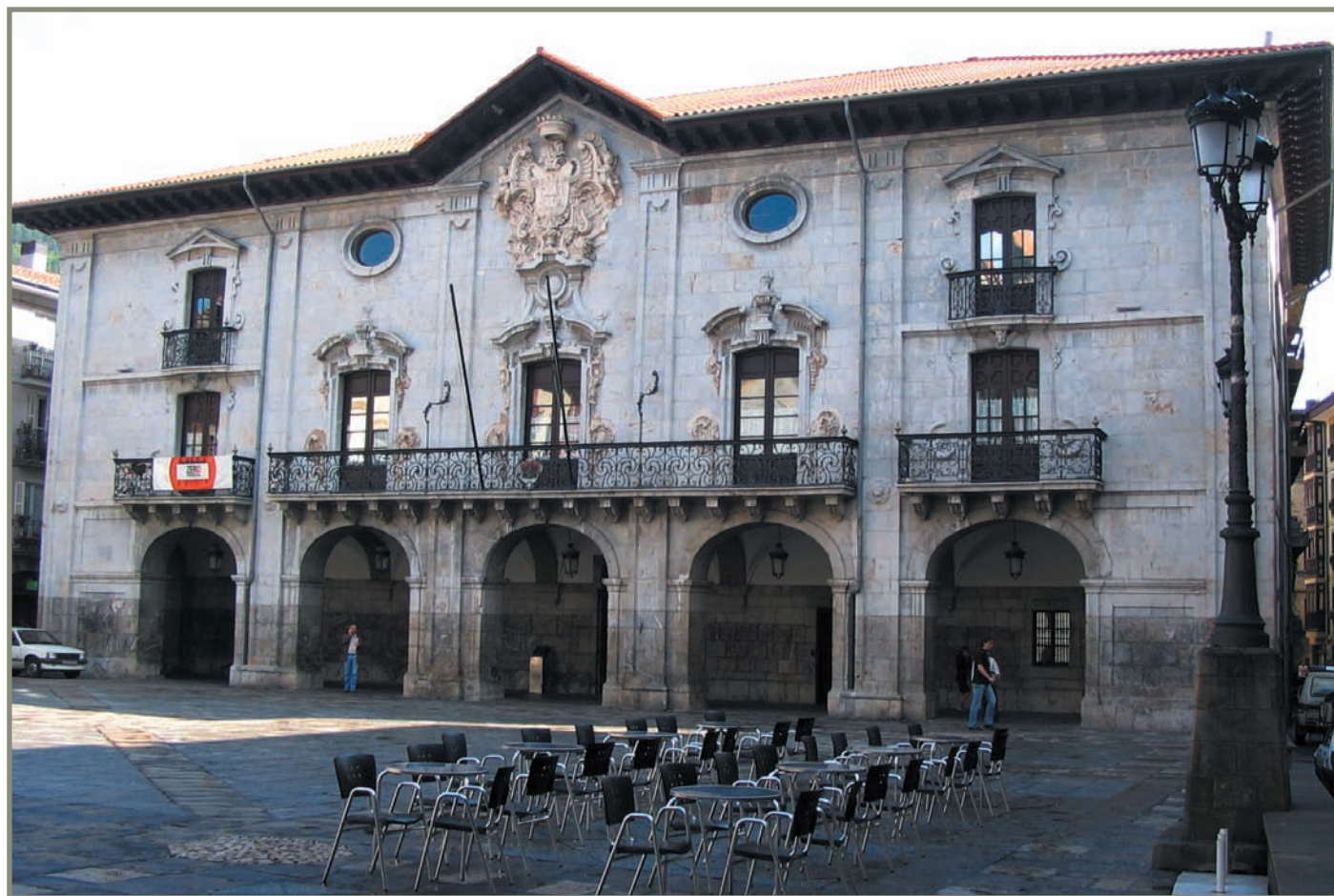
7.8. irudia. Arrasateko udaletxea.