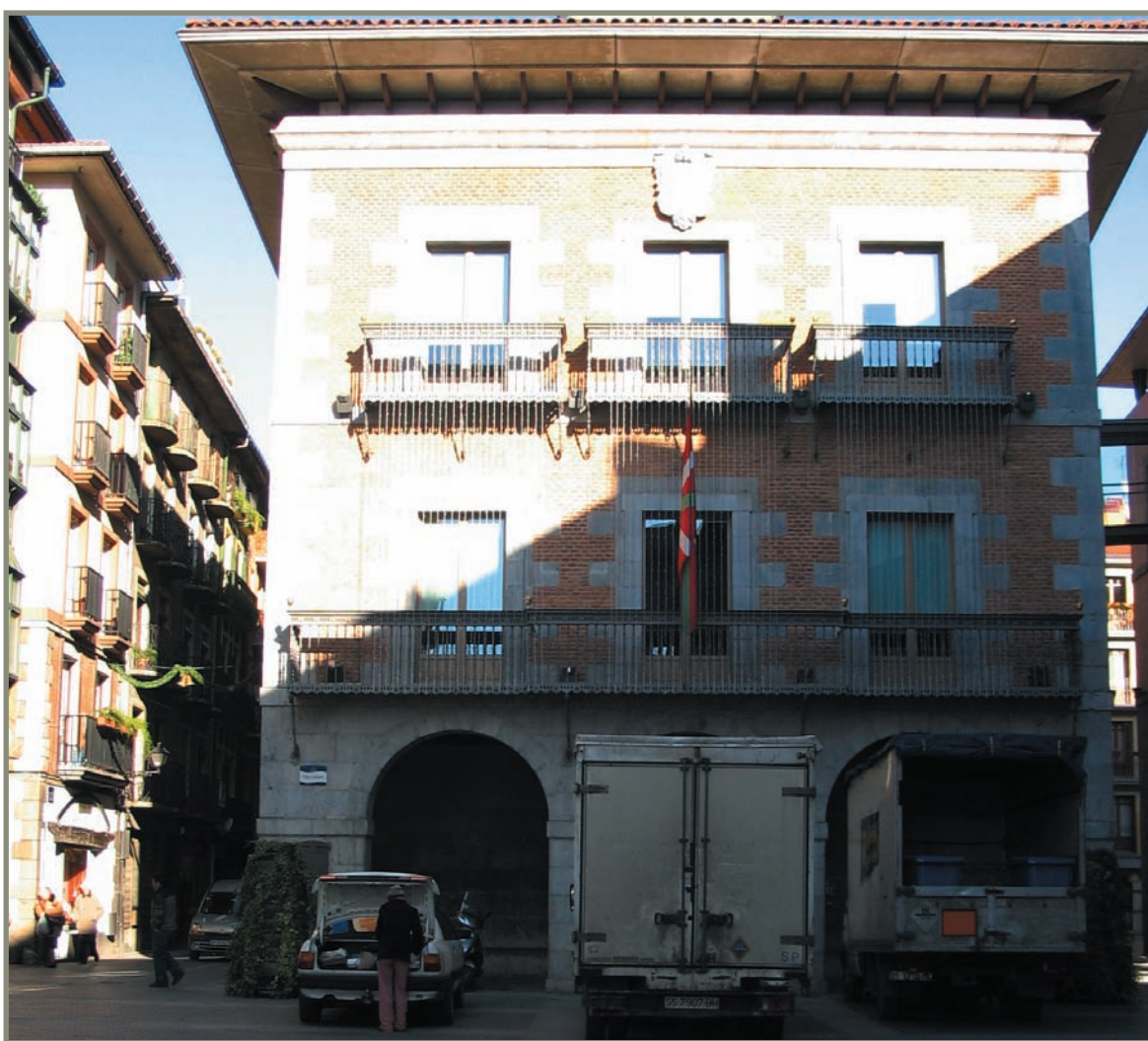
7.2. irudia. Tolosako udaletxe zaharra.

Gaztelako Enrike III.a erregeak Madrilgo Gortetan egindako agirietan sinatzaile azaltzen dira Oñatiko Beltran III.a Belez Gebarakoa eta honen seme Pedro II.a Belez Gebarakoa nobleziako kide gisa 7 .