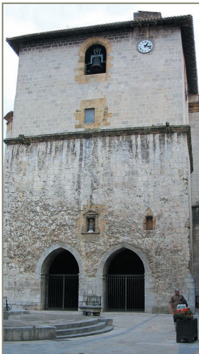
7.5. irudia. Debako Andre Mariaren eliza.