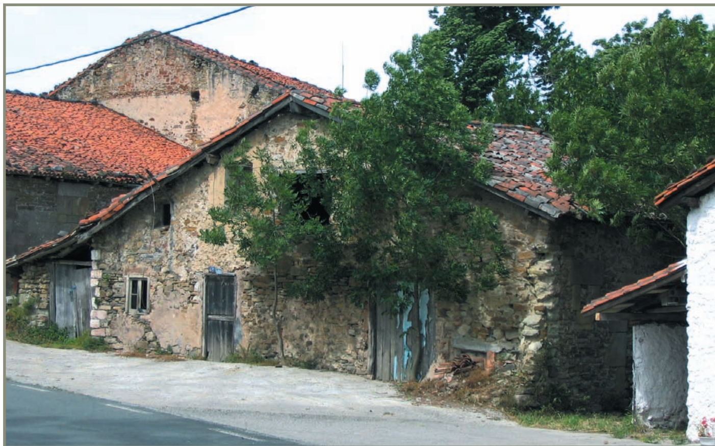
7.4. irudia. Ibañarrietako Bentazarra.

Ez dugu inon ikusi abuztuaren 15a baino lehenagoko epairik. Aitzitik, 1394ko zenbait agiritan (ikus [XIV. m. 17] agiria) Aizarnazabal Zestoari loturik azaltzen da.