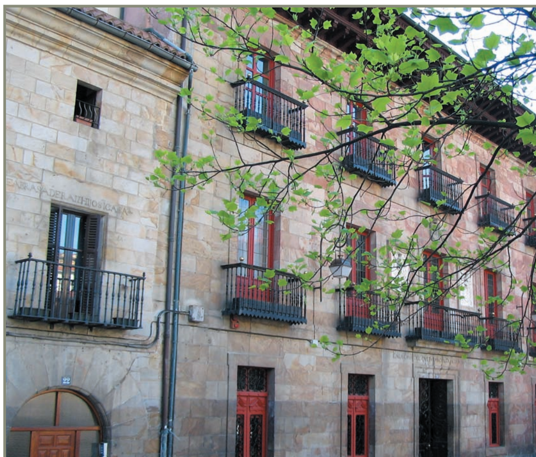
6.17. irudia. Urretxuko udaletxea.

Urretxun batzartutakoek bazekiten Gipuzkoako Ermandadeak ohiko batzarrak eta ohizkanpokoak