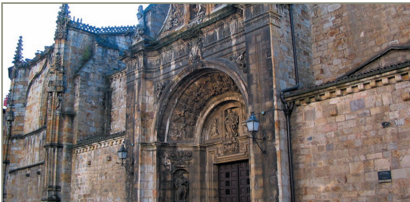
6.16. irudia. Oñatiko San Migel eliza.

Oñatiko jaunak dei egin zien Oñatiko biztanleei San Migelen monasterioan harengana joan zitezen. Beltran III.a Belez Gebarakoa egun osoan egon zen elizan oñatiarren zain, baina ez zitzaion inor aurkeztu. Aitzitik, armatu egin ziren Oñatiko biztanleak, eta kofradiak sortu zituzten gebaratarren aurka elkarri laguntzeko.