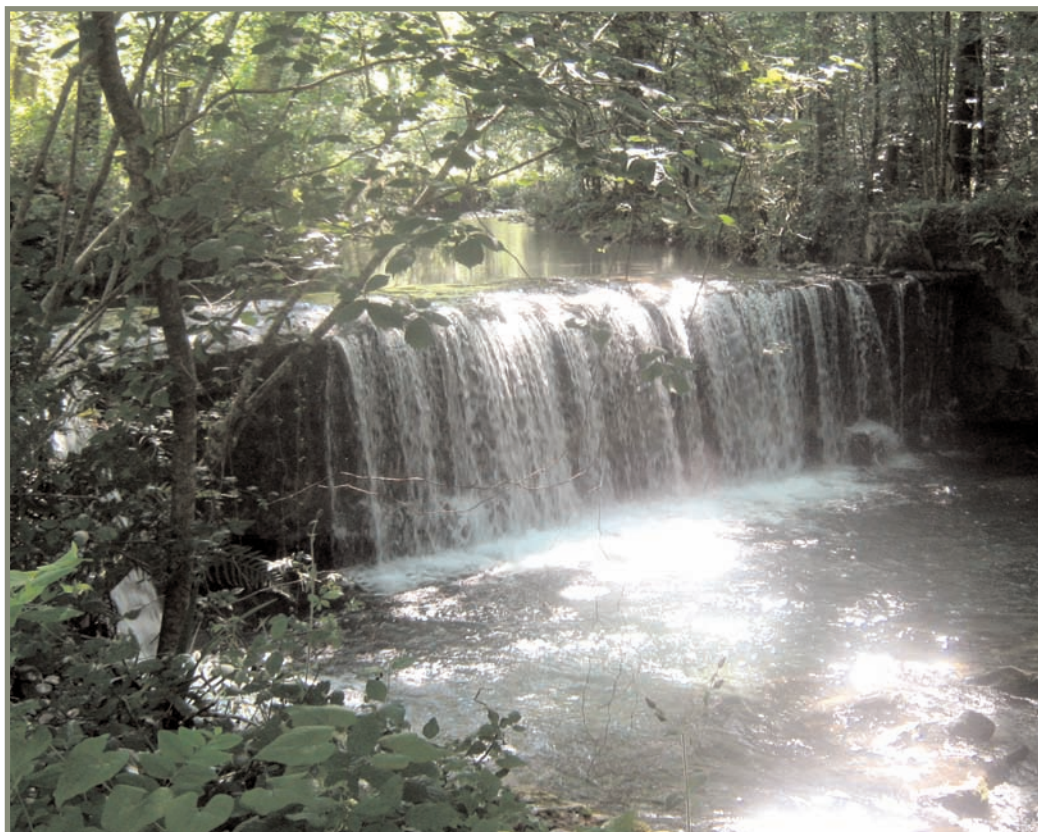
6.12. irudia. Altzolaratspe edo Bekolako presa.

Lilitik errekan gora joanda Agireta (Agitta) izeneko lekura iritsi ziren, eta hor bi iturri elkartzen diren lekura. Hortik gora Urdanolaeta izeneko muinoraino joan ziren, mugarritik mugarrira, eta handik gurutze-marka zuen haritzerraino; izan ere, zuhaitzak enborrean gurutzea markatuta mugarriztat hartzen zituzten. Handik gurutze-markaz hornitutako pagoraino joan ziren gora. Zuhaitzez zehaztutako bi muga-puntuetan pagoa haritza baino altitude handiagoan agertzen zaigu, eta, hain zuzen, pagoak haritzak baino maiteagoak ditu goi-mendiak.