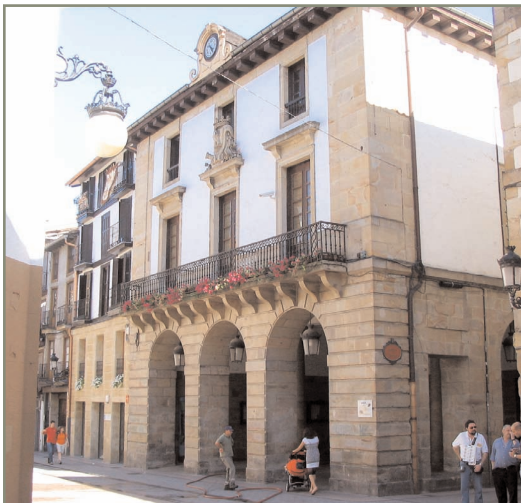
6.15. irudia. Ordiziako udaletxea.

Ordiziako Batzar Nagusietan aipatutako hiribilduez gain beste bat ere bazen, baina agiria hautsita dagoelako ez dago jakiterik zein zen. Alkatetza Nagusiek, Hernanik eta Eibarrek prokuradore bana bidali zuten, eta gainerako hiribilduek bina. Ituna betetzen ez zuen alderdiak 20.000 marai ordaindu beharko zituen, erdia erregearentzat eta beste erdia kontratua zuzen bete zuen alderdiarentzat 49 .