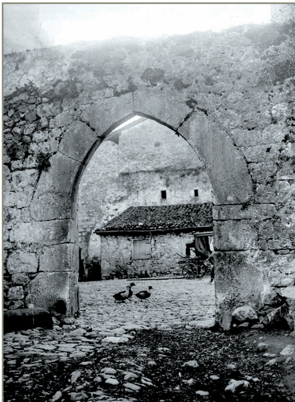
6.7. irudia. Zestoako "Lizarrarasko" portalea, 1935ean eraitsia.

koa, oraingo Pio Baroja plazaren iparraldean zutik egon zen 1935. urtera arte. Errepublikaren garaian bota zuten bidea zabaldu asmoz. Zorionez, bota baino lehen Indalezio Ojanguren eibartarrak argazkia atera zion, eta, hari esker, badakigu nolakoa zen 36 . Portale hura botatzeko aldeko eta aurkako iritziak izan zituzten beren garaian herritarrek 37 . Plazaren erdialdean "Palankadoko" portalea zegoen. Erdarazko "palanca" izenaren adiera bat hesola eta lurrez egindako gotorlekua da, eta agian horrelako zerbait izango zuen kanpo aldetik.