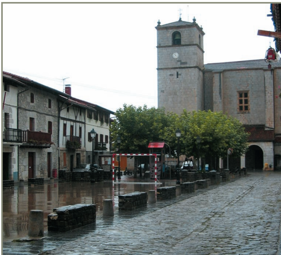
6.4. irudia. Aizarnako plaza eta eliza.

Kapitulu honetan behin eta berriz aipatu ditugun bi agirietan Aizarna, Akoa eta Zestoako kolazioak azaldu zaizkigu, baina parrokia Aizarnan baino ez zegoen, hiru urte geroagoko Zestoako hiri-gutunean (1383-IX-15ekoan) azaltzen denez. Bertan “... los ffiijosdalgo e omes buenos de la parrochia de Santa Maria d’Axarna...” argi eta garbi esaten da 1 .