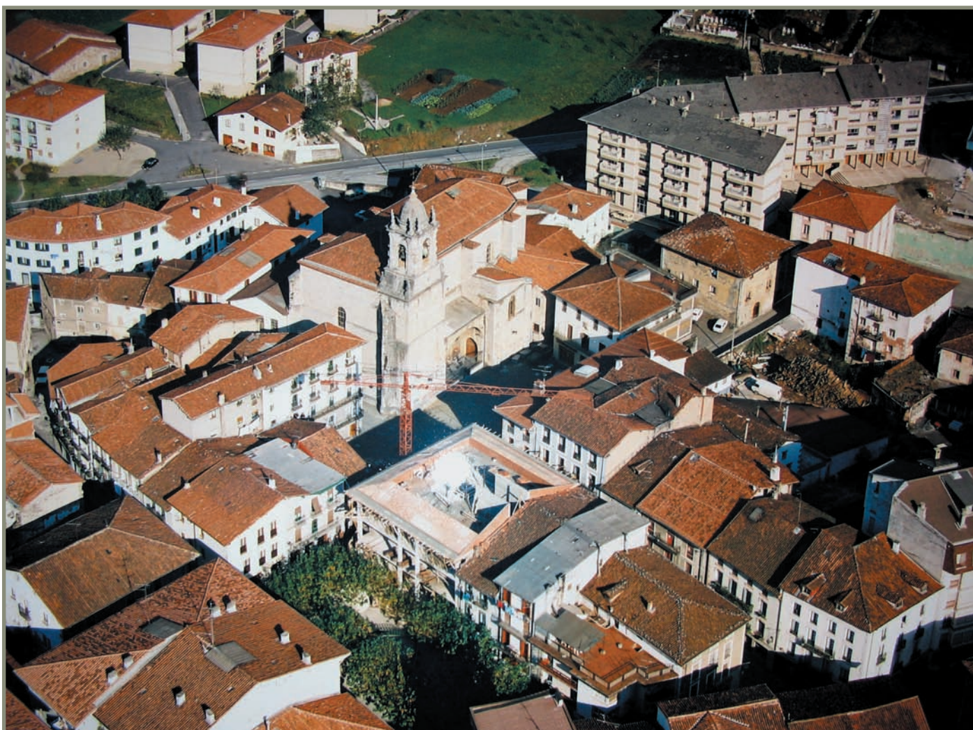
6.6. irudia. Zestoako hiribildua.

Zestoa eraikitzeke hiri-gutunaren berri “Agiritegia” deitutako atalean ematen dugu [XIV. m. 6] agirian.