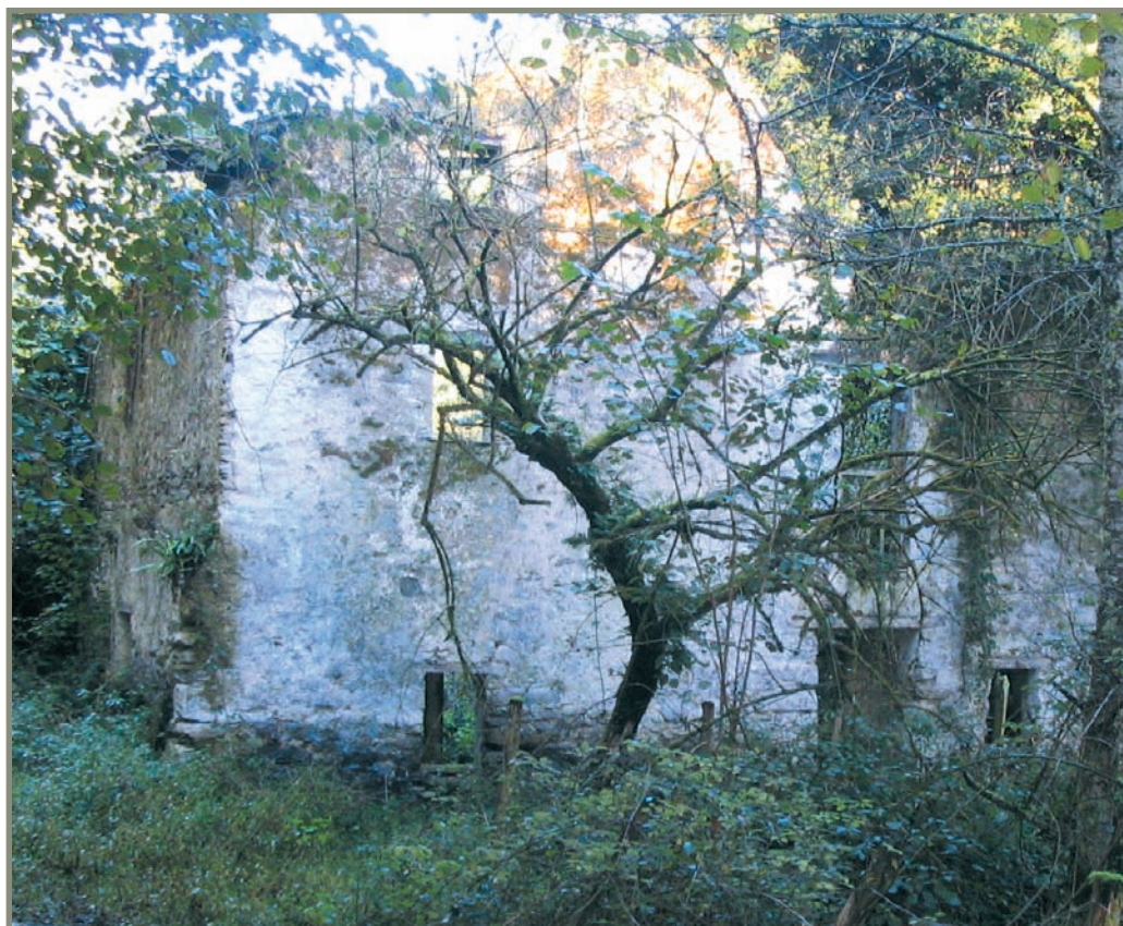
6.14. irudia. Bedamako Errotabarrenaren aurriak.

Aipatutako [XIV. m. 9] agiriko mugak 6.12. irudiko planoan erakusten dira lerro lodiz markatuta. Beraz, gaur egungo Olalde, Olazarraga, Legoiaga, Baltzola..., Endoia eta Arroa osoa Itziar-Debako lurak ziren, eta