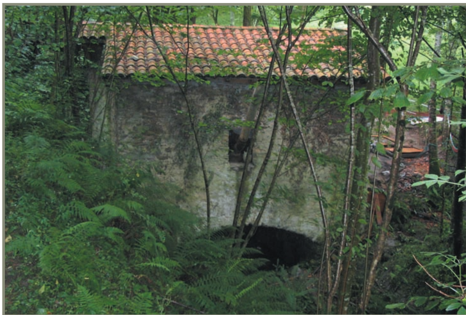
6.1. irudia. Agireta edo Agittako errota berria.

Bi agiri hauetan zenbait leku-izen interesgarri azaltzen da: “Vrdinarana” iturria, adibidez. “Urdanarana” izan daitekeela iruditzen zaigu; izan ere, inguru horretan geroxeago, 1385-VII-18ko beste agiri batean “Vrdanolaeta” azaltzen baita 1 . Beraz, Zestoan garai hartan garrantzitsuak ziren urde edo txerriak bertako abelazkuntzan eta ekonomian.