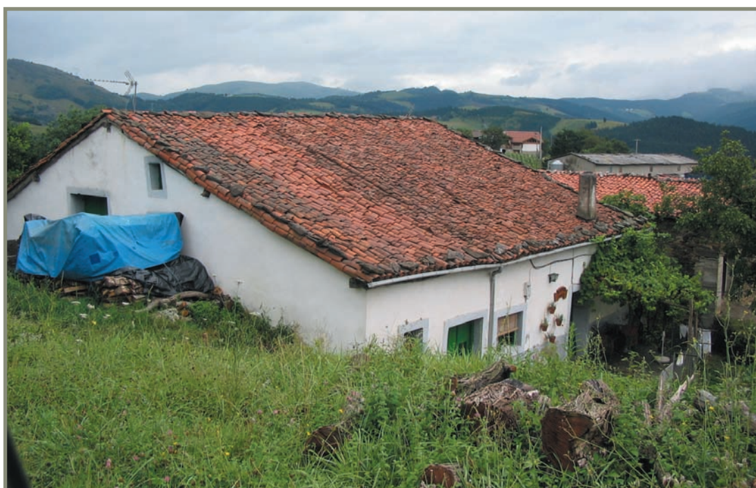
6.2. irudia. Etorrazar baserria.

Bestalde, orain arte aipatu ez ditugun eta Zestoa-koak diren leku-izen batzuk lehen aldiz azaldu zaizkigu delako bi agiri hauetan: “Çeçenarro” (oraingo Ezenarro), “Elaçaua” (Olazabal), “Apategui” (Apategi), “Soroçaua” (Sorozabal edo Sorazabal), “Reçaua” (Erretzabal), “Olascoaga” (ez dakigu Olaskoaga honen kokalekua zein zen), “Hetorra” (Etorra) 7 , “Ayçarnauea” (Aizarnabea edo Aizarnatea?) eta “Ibiatayz” (Ibiakaitz edo Idiakaitz).