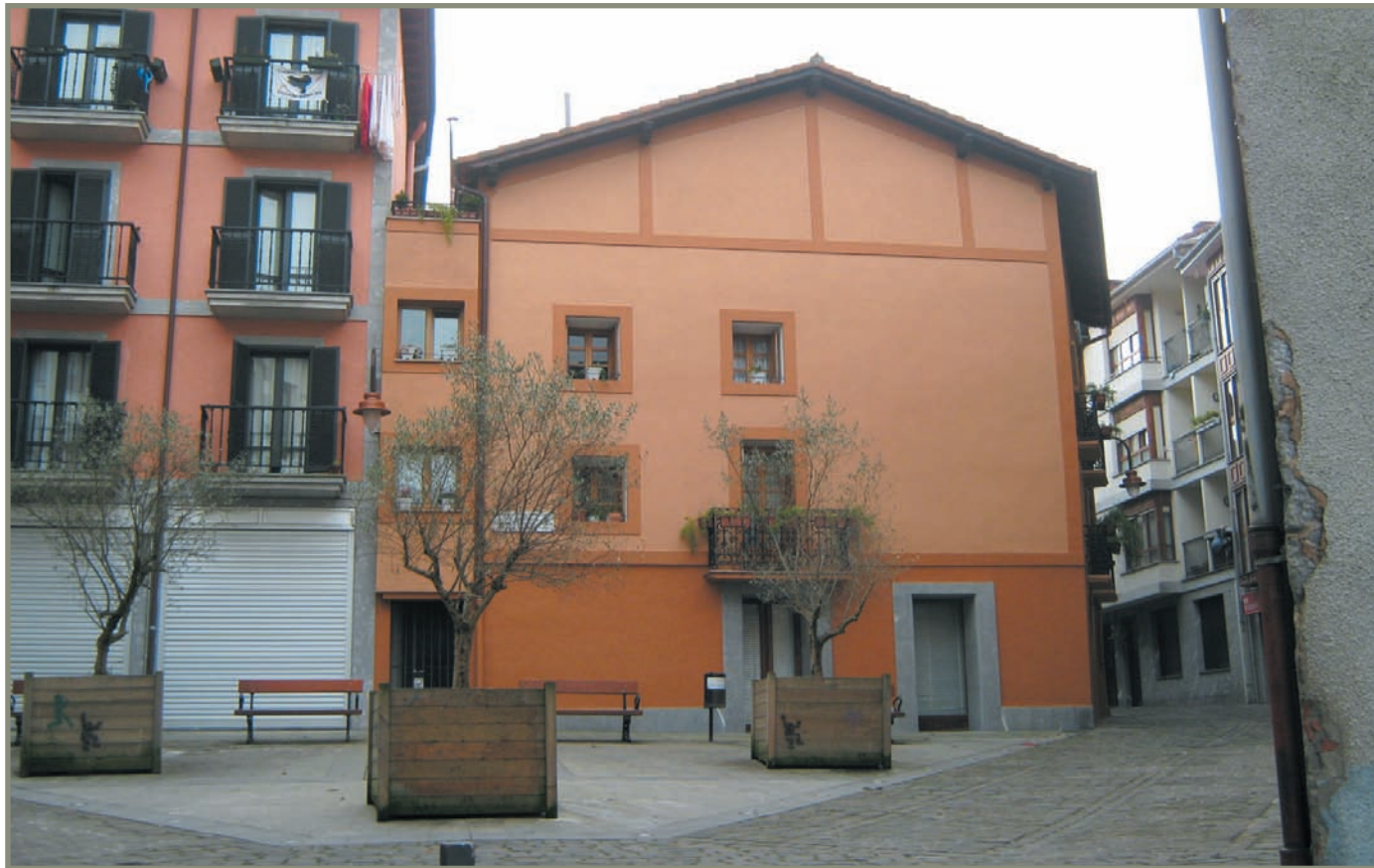
6.10. irudia. Zestoako hiribilduko bi etxe sail. Bien artean argia sartzeko tartea zegoen. Eskuinean "Kaleokerra".

Beste hiribildu batzuek obaloaren antzeko forma dute. Horrelakoak dira, adibidez, Arrasate (3,4 ha), Ordizia (2,4 ha) eta Hernani. Hiru kale dituzte, eta erdikoa da zuzenena. Alboetako bi kaleak okerragoak dira, obaloa ixteko. Elgoibarrek (2,0 ha), Soraluzek (2,1 ha) eta Zestoak bi kale paralelo eta oker dituzte. Leintz Gatzagak eta Debak hiruna kale dituzte, baina forma karratua osatzen dute.