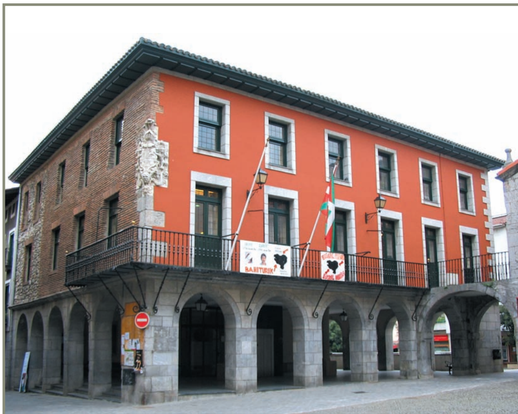
6.11. irudia. Zestoako udaletxea.

Kontzejuko prokuradorea ere hiribilduan hautatzen zuten urtebeterako, Kontzejuak zituen auziak