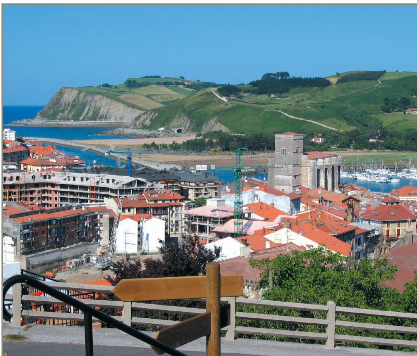
6.18. irudia. Zumaia herria.

baina Martin Zalba apezpikuaren asmoak ez ziren zaldunek aipatutakoak, noski. Izan ere, urte hartan bertan, 1390ean, Donostiako Altzan parrokia izango ez zen zurezko kapera eraikitzeko baimena eman zuen. Altzatarrek, izan ere, legoa bat ibili behar izaten zuten hiribilduraino elizkizunetara joatearren. Kaperan meza emango zuen apaizak, baina San Sebastianen parrokiako benefiziadua izan behar zuen meza-emaileak. Gainera, Pazkoa egunean, Eguberri egunean, Mendekoste egunean eta beste zenbait egun nagusitan parrokiara joan beharko zuten 11 .