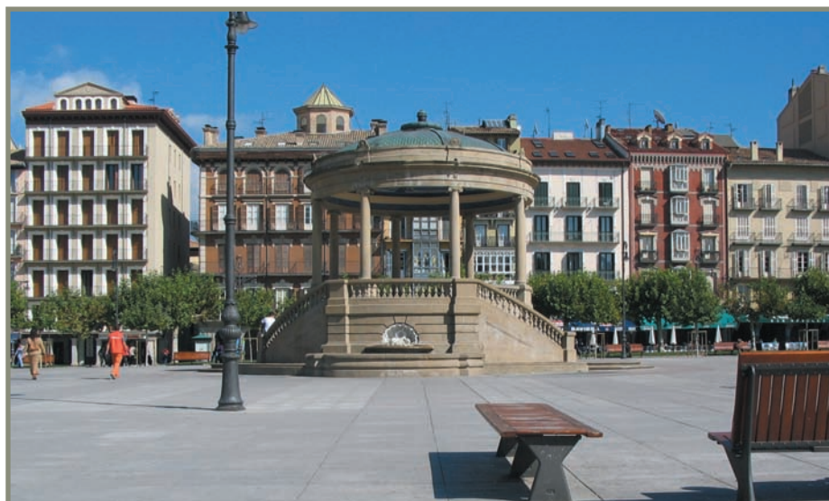
3.29. irudia. Iruñeko Gazteluko plaza.

Toledoko errege bisigodoentzat, kantauriarrak eta baskoiak buruhauste-iturri ziren, beti ere arpilatzekeo ibilaldiak egiten zituztelako. Toledon 694. urtean eta 702. urtean egindako kontzilioetara, adibidez, Iruñeko apezpikurik ez zen joan. Gainera, azken errege bisigodoa, Rodrigo edo Roderiko, Iruñean altxamenduei aurre egiten ari zen, 711. urtean Tarik-en agindupean musulmanak Gibraltarren lehorreratu zirenean 40 .