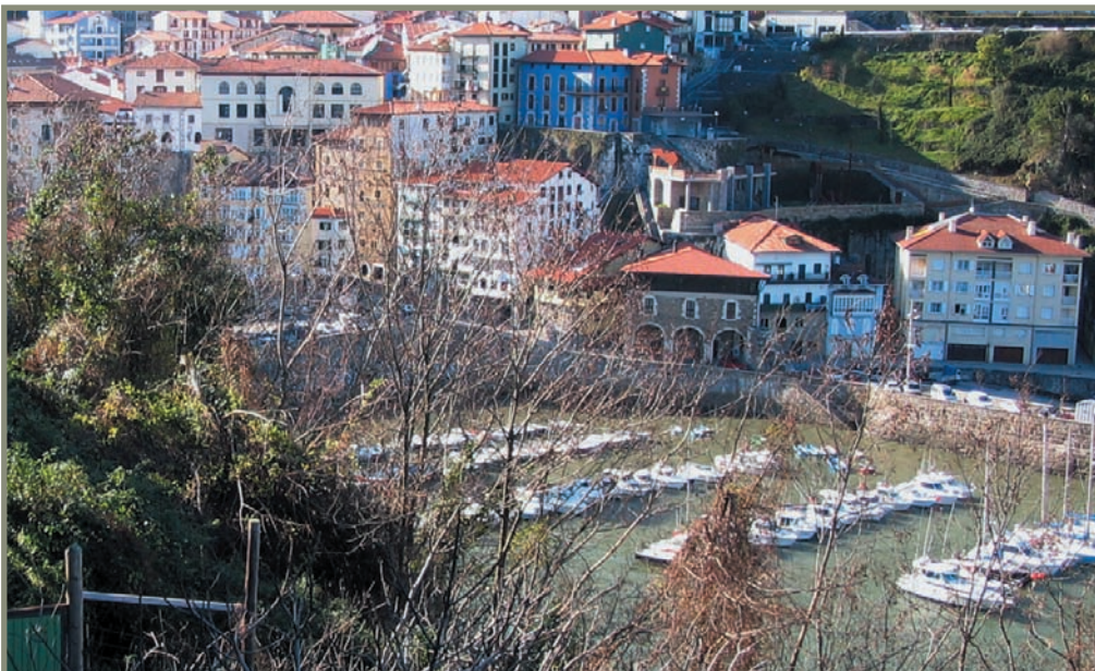
3.16. irudia. Mutriku. Tritium Tuboricum?

barduliarren lurraldean, autrigoienean baizik. Barduliarren lurretan bada beste “Çegondia” edo “Segontia” bat, XIV. mendean geroko agirietan azaltzen dena, Zestoa/Errezilgo mugan, Txorondegin. Tabuca non egon zitekeen ere ez dakigu. Barduliarrek eta baskoiek kostaldean Menlasci ibaia zuten muga (Oiartzun ibaia?) eta barduliarrek eta karistiarrek Divae (Deba) ibaia 13 .