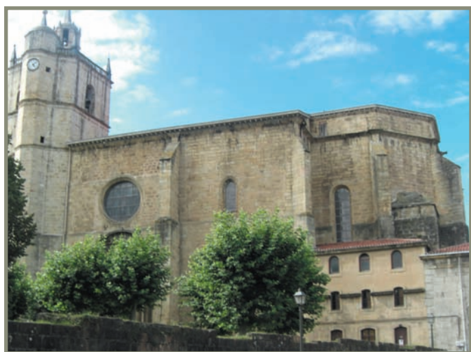
3.11. irudia. Irungo Junkaleko Andre Mariaren parrokia.

Bestalde, Irungo Ama Xantalengo ermitan erromatar garaiko nekropolian aurkitutako ontzi eta errautsak gehienbat K.o. I. edo II. mendekoak dira 7 , lehen mendearen erdi aldean eraiki baitzuten nekropolia. Arditurrin zilar-galena eta burdina ateratzen jarraitu zuten, Hondarribiko Higer lurmuturraren babesean ainguratuta zeuden ontzietan eramateko. Elikagai-garraioa ere bazegoen itsasoz; izan ere, esana dugunez, Lapurdiko Getarian garai hartan arrainak gazitzeko lekuak baitzeuden 13 . Irunen Junkaleko plazan ontziratzeko lekua zegoen, eta Irungo Bentetan, Larraburu baserriaren azpian, zegoen, dirudienez, kai garrantzitsuena. Erromatarren ontziek egunez nabigatzen zuten lurmuturretik lurmuturrera, hiruzpalau korapiloko abiaduraz 4 .