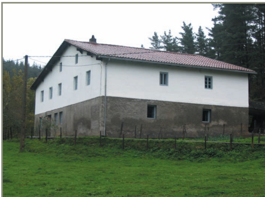
3.8. irudia. Zestoa. Lasako Agerre (edo Agirre) baserria.

Urteko bi herenetan menditarrak ezkurra besterik ez zuten jaten, zeina xehatu eta ogia egiten baitzuten. Izan ere, ogia denbora luzez gorde zezaketen. Gara-gardoa edaten zuten, eta urri zen ardoa, eskuratu ahala, familiako otordu handietan berehala edaten zuten. Olioaren orde zantzaz baliatzen ziren. Hormen inguruan kokaturiko aulkietan eserita jaten