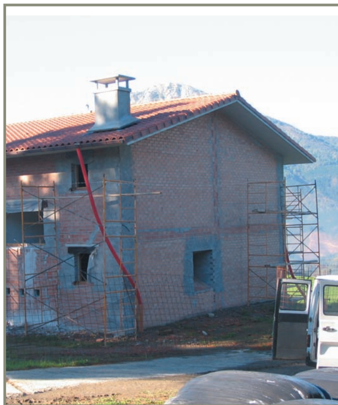
3.21. irudia. Zestoa. Illurdangoikoa baserria.

Inguruko hizkuntzek ez bezala “H asperenduna”, Antzinaroko euskararen ahoskatu egiten zutena, dip-tongoen atzean eta kontsonantearen atzean ere azaltzen da. Antzinateko euskararen, geroagokoan bezala, hitzaren bukaerako “r” hotsa “n” bihurtzen da. Horixe dugu “Ilur-” eta “Ilun-“ alternantzian, esaterako.