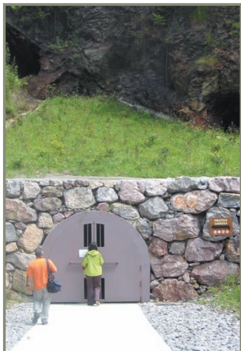
3.22. irudia. Oiartzun. Arditurriko meategie- tarako sarbidea.

Irungo Junkaleko elizako aztarnategian eta Santiago kalekoan zeramikazko piezak topatu ziren. Batzuk trantsizioko Terra Sigillata Hispanica erakoak dira, baina bertako erako torneatu gabeko zeramika eta torneatutakoa ere bazeuden. Higer lurmutur ondoan, urpean, Magnentzio enperadorearen txanpon bat aurkitu zen, 353. urtean egin. Garai hartako zeramikazko piezak ere bazeuden. Oiartzungo San Estebanen egindako indusketan Konstantino (K.o. 330-335) enperadorearen txanpon bat aurkitu zuten 13 .