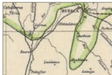
Euskararen mugak VI-VII. mendeetan.