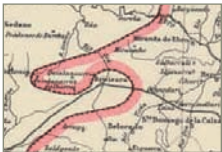
Euskararen mugak IX-XII. mendeetan.