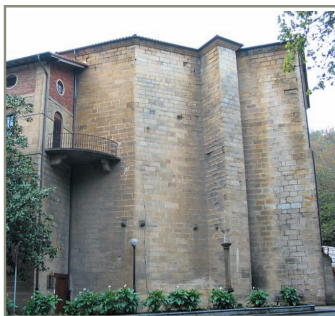
3.19. irudia. Zarauzko Andre Mariaren parrokia.

- Morogi hiriaren kokalekua zein den seguru ez badakigu ere, azkenaldian Donostiako hirian aurkitutako aztarnek bertan egon zitekeela iradokitzen dute. Ardotarako anforaren pieza zeramikoak, K.o. II. mendekoak, aurkitu zituzten Santa Klara uhartearen babesean. Kontxako hondartzan, berriz, Adriano enperadorearen sestertzioa, K.o. 134-138. urte bitartean egina, topatu zuten. Alde Zaharrean ere garai hartako pieza zeramikoak zeuden 13 . Alde Zaharreko Santa Teresa komentuan ere aurkitu ziren K.o. 50-200 bitarteko aztarnak 17 .