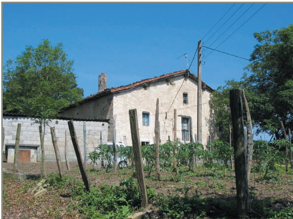
3.27. irudia. Zumaia. Oikiako Urteagazar baserria.