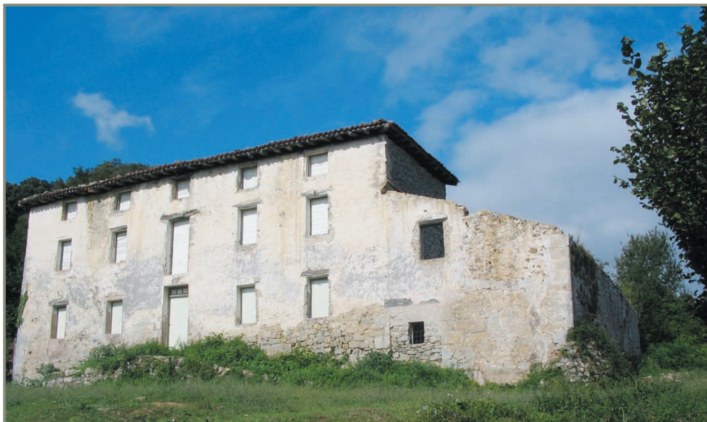
3.24. irudia. Zestoa. Pagio baserria.

Bisigodoek Hispania hartu zutenean, Toledon ezarri zuten erreinuko hiriburua, hiru mendez (711. urtera arte) iraun zuena. Handik gidatzen zituzten beren tropak, eta 472. urtean Iruñea hartu zuten. K.o. V. mendearen erdialdean, Erromako inperioaren aginpidea oso ahulduta zegoela, “bagaudae” izeneko altxamenduak zanpatzen bisigodoak ibili ziren. Bisigodoek etengabeko gatazkak zituzten baskoiekin. Errege bisigodoen kroniketan behin eta berriz azaltzen dira “domuit vascones” (baskoiak menderatu egin zituen) edo “vasconies vastavit” (baskoiak suntsitu egin zituen) esaldiak. Beraz, esaldiok bi gauza adierazten