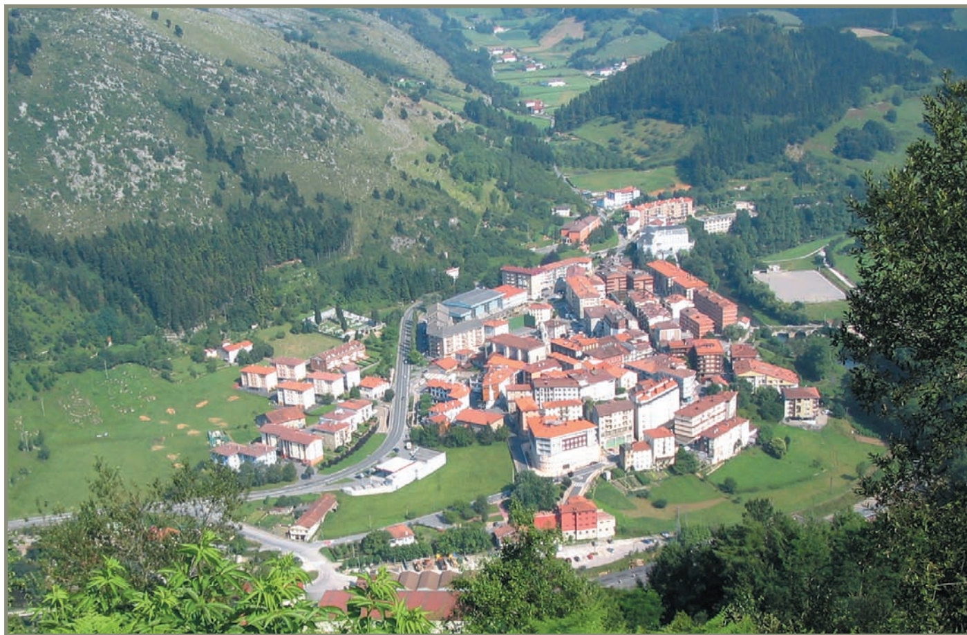
3.28. irudia. Zestoa (Cistonia?).