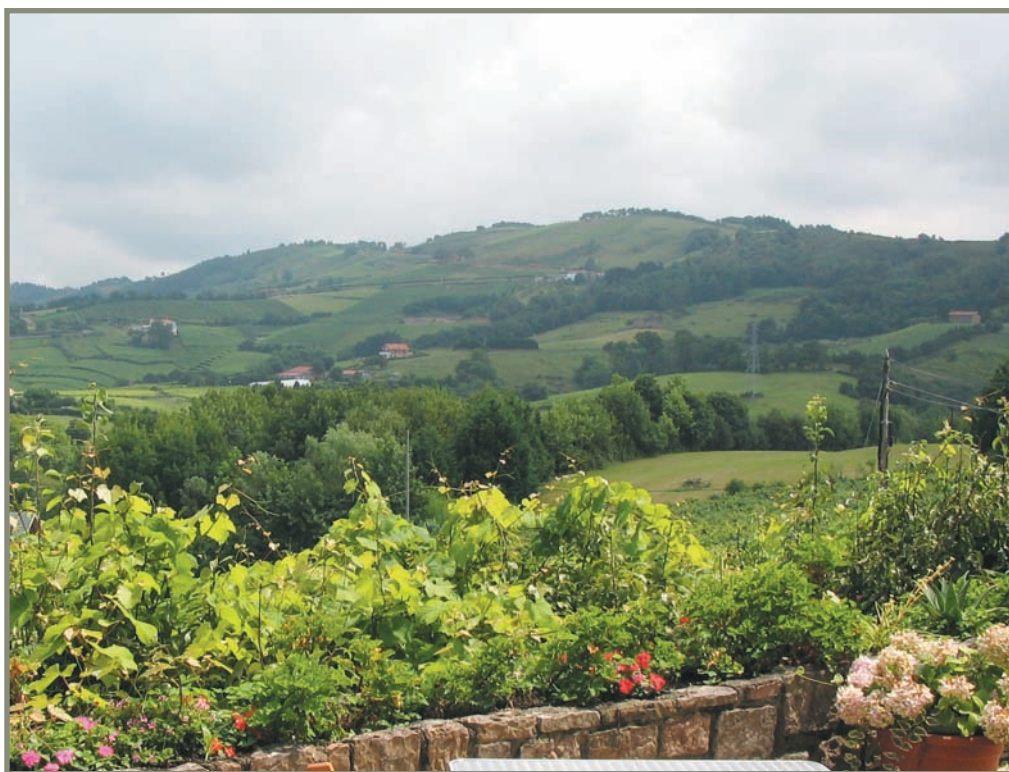
3.17. irudia. Getariako mahastiak.

- Oiaso hiria K.o. II. mendean indartsu mantendu zen. Merkataritza-harremanetarako eremu zabala zuen: lehorrean Garona ibaiaren ezker aldeko lurrak, Ebro ibaiaren erdi aldeko harana eta Pirinioen mendebaldea. Itsasoz, berriz, Bordeletik hasi eta gutxi gorabehera Santander alderainoko eremua zeukan.