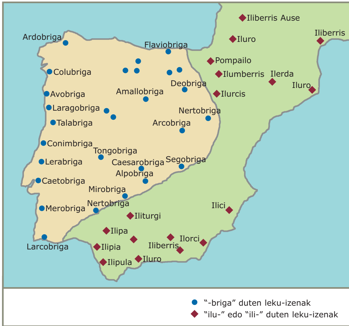
3.1. irudia. “-briga” amaiera eta “ilu-” hasiera duten leku-izenak.

Zestoan ugari dira “-ain” atzizkia duten leku-izenak. Hona hemen batzuk 6 : Urtarain (1483), Muskandain (1483) (Buskandegi), Urriarain (1483), Ibañarrieta (1393), Beaingo San Lorente (1399), Adiestain (1483) (orain Ariztain), Anatxarain (1483), Sastarrain (1543), Illurdain, Benasainburua, Atristain, Sustrain, Zebainerreka... (Zestoan bada Gallaritxo edo Gallegitxo izeneko baserria, eta ondoan, Azpeitiko partean, Gallari edo Gallegi, lehen “Gallain” deitutakoa).