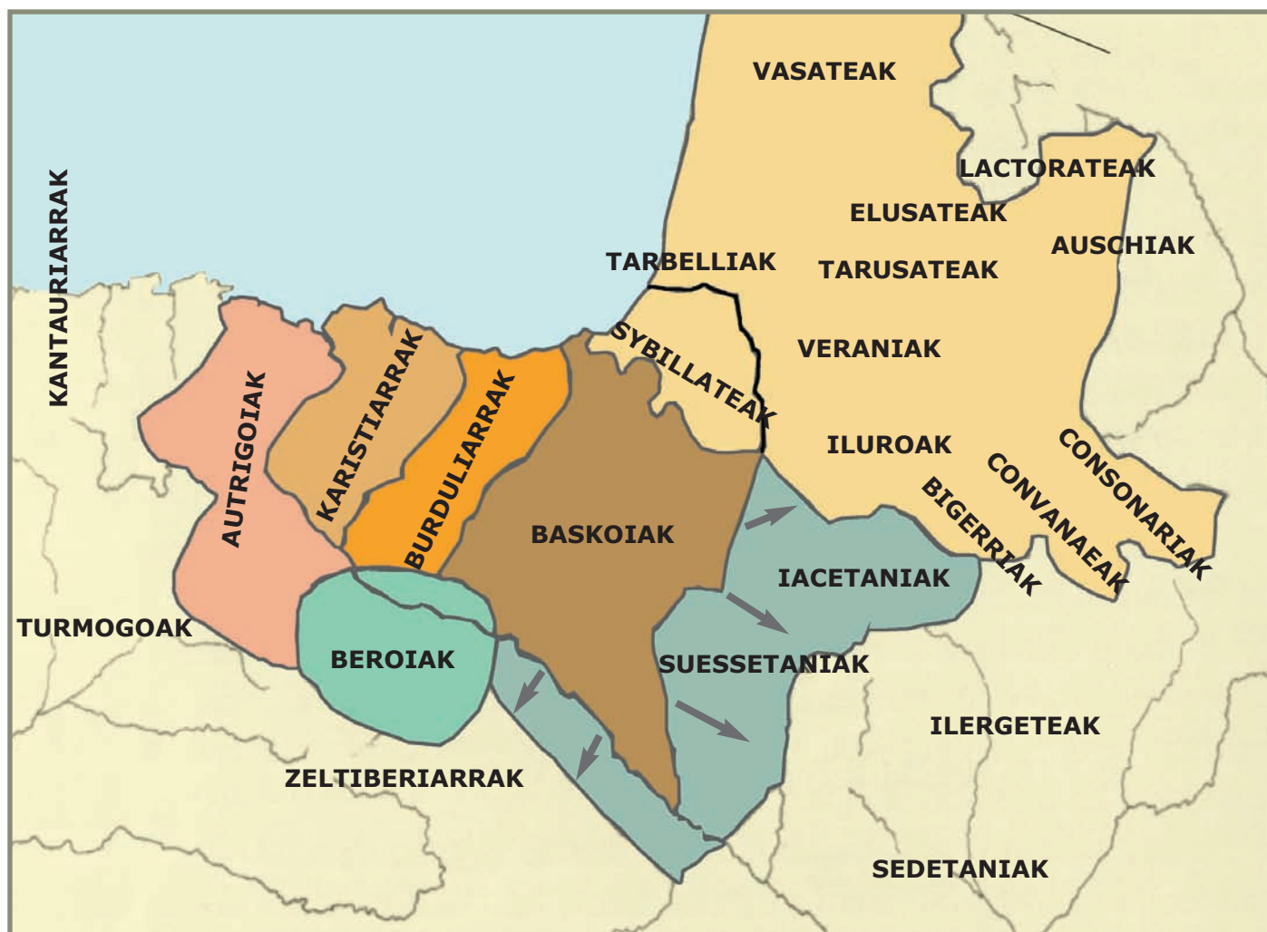
3.4. irudia. Euskal tribuen arteko mugak. Gero baskoiak hedatu egin ziren, besteak beste iacetani eta suessetani herrien lurraldeetara.

harresituak azaldu dira; beraz, hegoaldeko zeltiberiarrekin lotura zutela esan daiteke. Mendebaldean Deba ibaiak bereizten zituen barduliarrak eta karistiarrak. Deba ibaitik Ibaizabal-Nerbioiraino karistiarren lurak zeuden, eta azken bi herri hauen lurak hegoalderantz Ebro ibaiaren aroraino zabaltzen ziren. Gainera, abeltzaintza eta transhumantzia bizi-bizirik zeuden garai hartan 5 . Bertako biztanleek mendia zuten