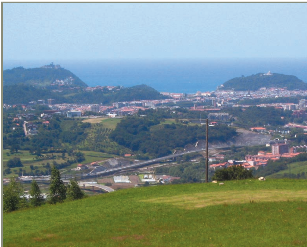
3.18. irudia. Donostia Astigarragako Santiagomenditik.

- Menoscatzat jotzen den lurraldean, hiru aztarnategitan aurkitu dira K.o. II. mendeko arrastoak. Zarautzen Antonino Pioren kobrezko txanpon handi bat jaso zen hondartzan, eta hondartza ondoko kale baten estoldan (Meagako errepidea hasten den lekutik gertu, Trinitate kalean) Adriano enperadorearen sestertzioa ere bai.