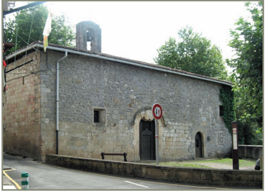
3.15. irudia. Irungo Ama Xantalengo ermita.