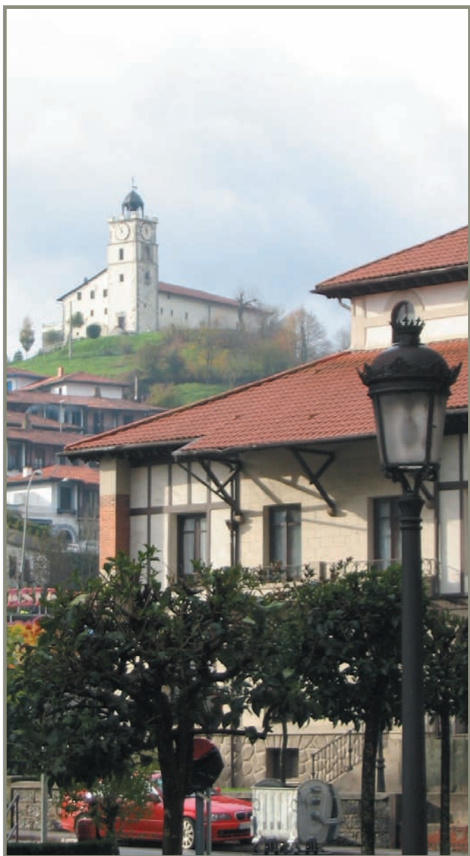
3.14. irudia. Azkoitia. San Martin ermita.

Bestalde, Iruña-Veleia kokalekuak ere garapen aldia zuen.