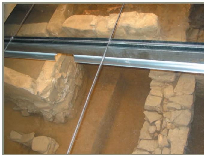
3.12. irudia. Zarautz. Andre Mariaren parrokiako indusketak.

- Menosca herriaren kokalekuaz ere auzia ebatzi gabe dago, nahiz eta Getaria eta Zarautz ingurua hartzen zuela dioen iritzia nagusitzen ari den. Dena den, Zestoatik nahiko gertu daude Zarautz nahiz Getaria, eta pentsatzekoa da Menoscaren eragina mendi-bidetan zehar bertaraino helduko zela.