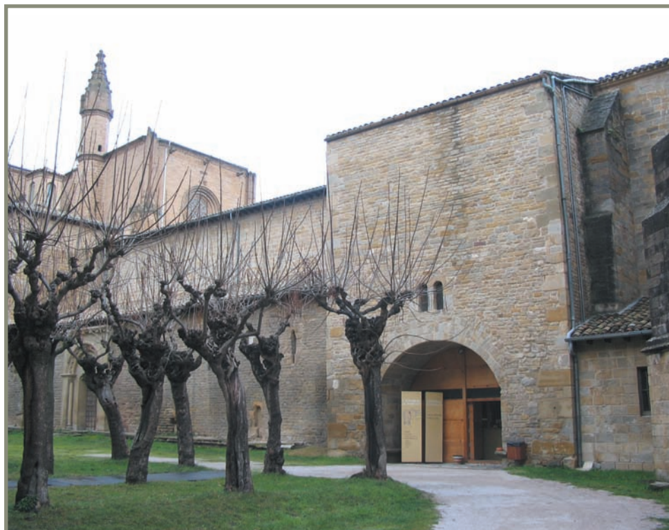
3.25. irudia. Iruñeko katedrala.

Giro hartan Rekaredok 589. urtean apezpikuei dei egin zien Toledon kontzilioa egin zezaten. Iruñeko apezpikua azaltzen den lehen kontzilioa izan zen hura. Aktetan honela baitio: “Liliolus, Pampilonensis ecclesiae episcopus, subscripsi” (hau da, “Liliolo, Iruñeko elizako apezpikua, sinatu dut”). Apezpiku izendatu berria zen Liliolo inola ere. Aktetan, hain zuzen, azken aurren sinatu zuen, eta horrek hau esan nahi du: Liliolo baino apezpiku bakarra zegoela kargua hartu berriagoa. Kontuan hartu behar da guztira 70 apezpiku zeudela.