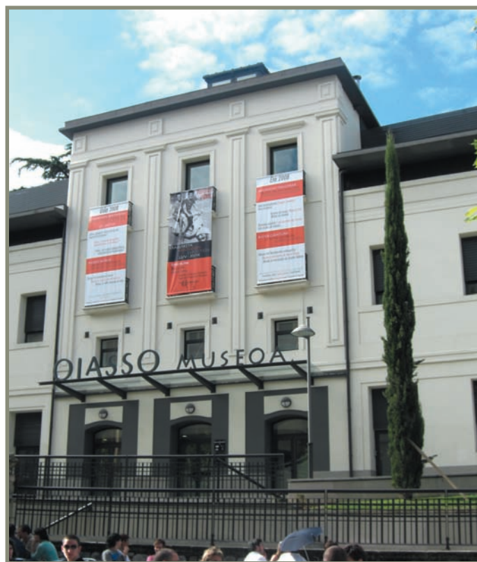
3.9. irudia. Irungo Oiasso museoa.

Haitzuloei dagokienez, Gipuzkoan Debako Ekain IV eta Zestoako Amalda ditugu aipagarri. Ekain IVko aztarnategian zeramikazko zati batzuk eta ugaztunen hezurak azaldu ziren, erromatarren eraginekoak 14 . Amaldan, berriz, indusketako I. mailan harri-industria, zeramika, metalezko piezak eta faunaren hezurak azaldu ziren, garai horretakoak izan daitezkeena. Harri-industriakoak arraspa bat, zulakaitz, bat, zulagailu bat, bi harri-xafla bizkardun, etab. aurkitu ziren. Zeramikari dagokionez, lau ontziren zatiak (batzuk apainduak), ertz zati bat barruan kordioa duela, beste sei zati apaindu, bost ertz zati, hondo lauko bost zati eta abar aipa daitezke. Brontzezko omega erako pieza bat eta kobre/brontzezko eraztun zatia ere bai. Animalia-hezurak, berriz, espezie hauek ziren: zaldi, zezen, basazezen, etxe-ahuntz, ardi, txerri, basurde, orein, uso, txolarre eta abarrenak 9 .