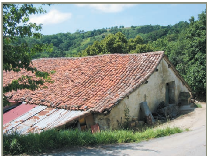
3.13. irudia. Aia. Urozperoetaxiki baserria.

Getarian ere aspaldi hasi ziren (orain hamabost bat urte) herriko zenbait gune induskatzen. 1991ean San Roke kalean, adibidez, erromatarren garaiko arrastak azaldu ziren. Salvatore parrokan ere bai, besteak beste 757 zeramika zati topatu baitzituzten. Kale Nagusiko orube batzuetan ere bazeuden aztarnak. Halaber Elkano kaleko beste batzuetan. Gehienak K.a. I. mendekoak eta hurrengo mendekoak ziren 24 .