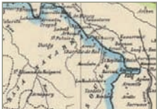
Euskararen mugak XVI. mendean.