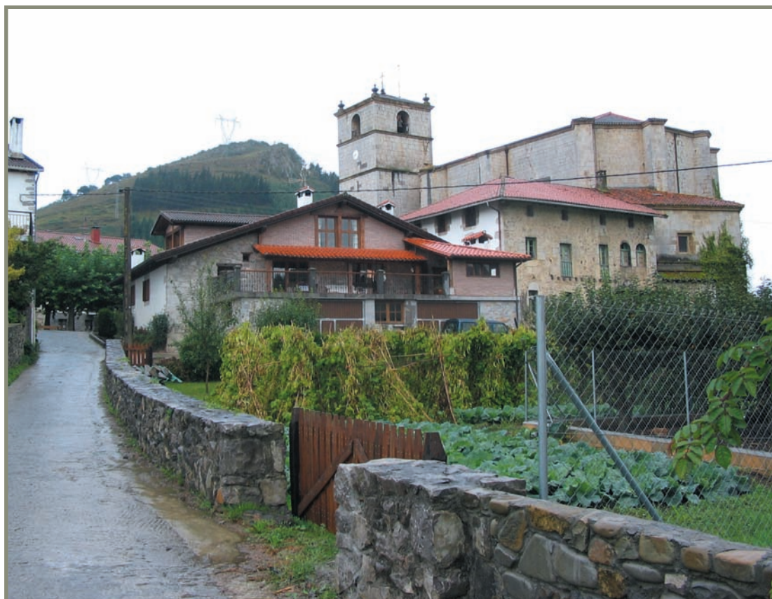
18.3. irudia. Aizarnako bista.