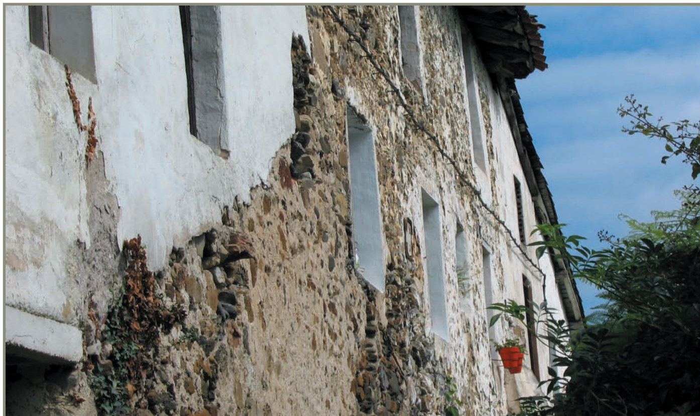
18.4. irudia. Amilibia (Maiordomokoa).