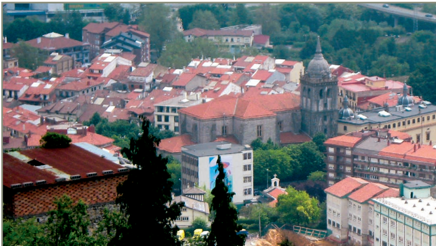
18.8. irudia. Hernani Santa Barbara menditik.

Hernanin 1488. urteko azaroan eta abenduan Gipuzkoako Batzar Nagusiak bildu ziren. Belauntzari,