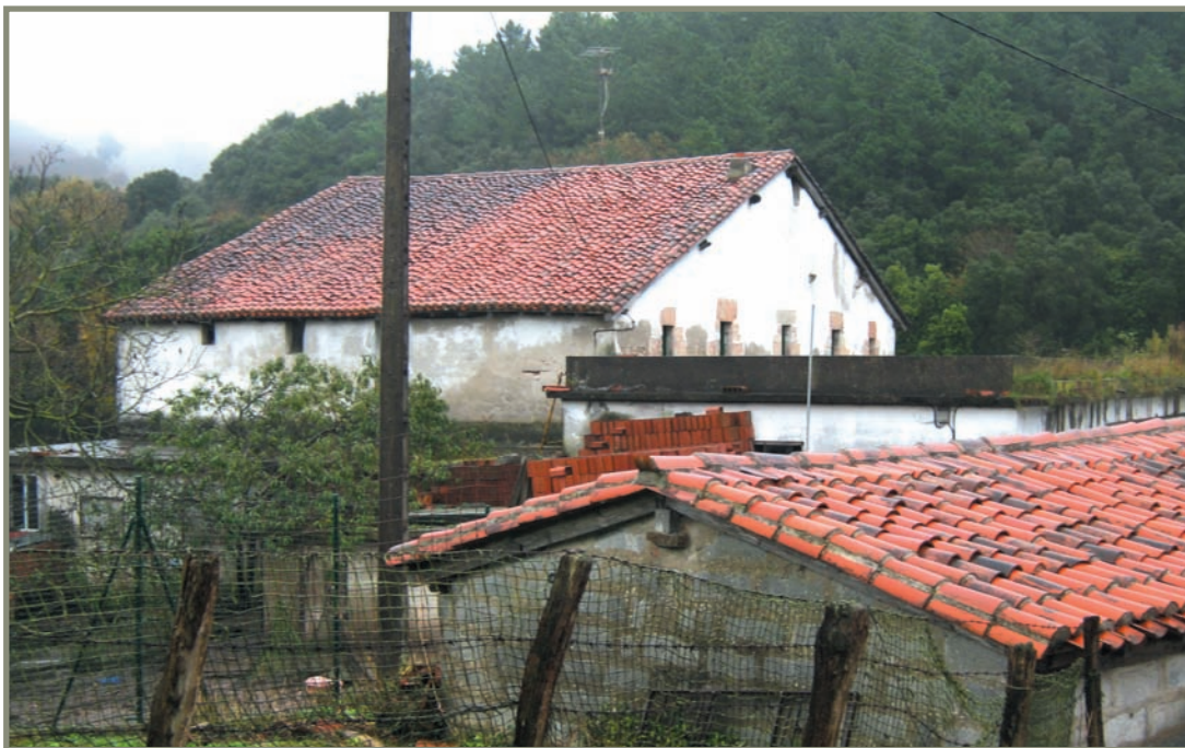
18.2. irudia. Zumaiako Arteaga baserria.