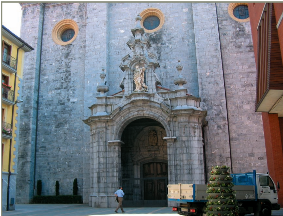
18.15. irudia. Tolosako Andre Mariaren eliza.