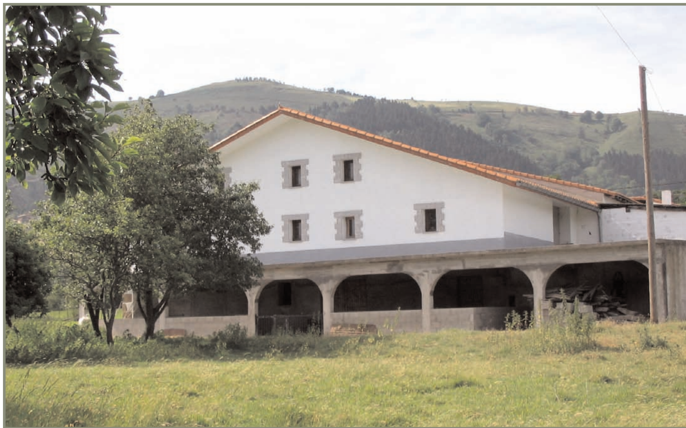
18.18. irudia. Arroako Zugastiaundi baserria.