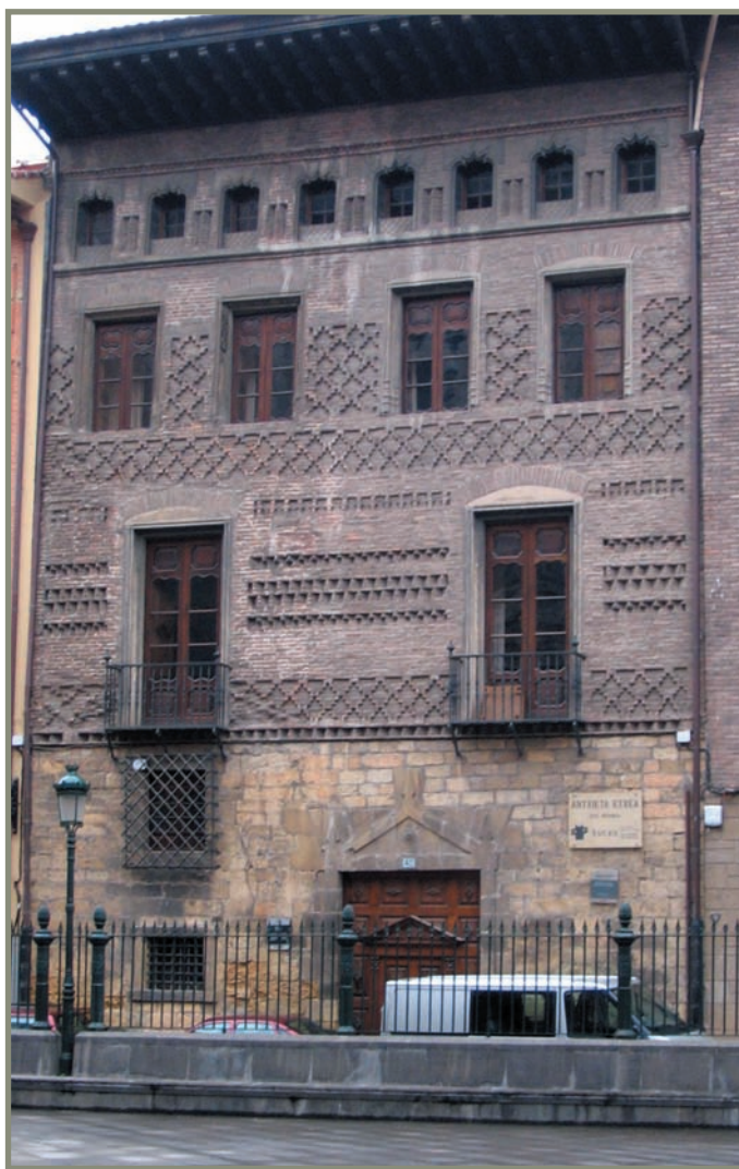
18.16. irudia. Azpeitiko hiribilduko Antxieta etxea.

1489. urtean Errege Katolikoek Gortean musikari famatua zen Joan Antxieta. En memoria de Alexandre izeneko erromantzeari musika ipini zion. Bertan Konstantinoplako sultanak Palestinako kristauen aurka egindakoak gogoratzen ziren; izan ere, sultanak kristauak Granadako Baza konkistatzen musulmanei egindakoagatik mendeku hartu baitzuen. Joan Antxieta Azpeitiko parrokia bikario edo ordezkobidez gobernatu behar izan zuen 5 .