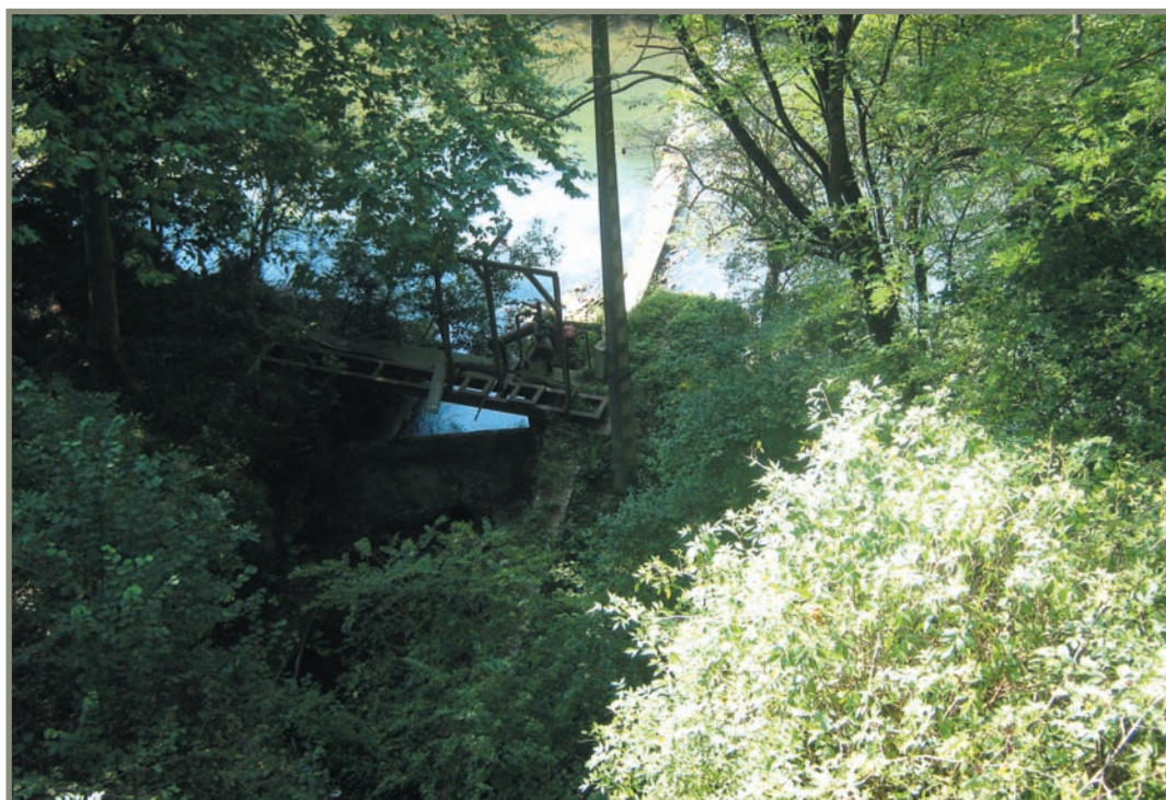
18.13. irudia. Amabiturrieta eta Urolaren elkargunea.