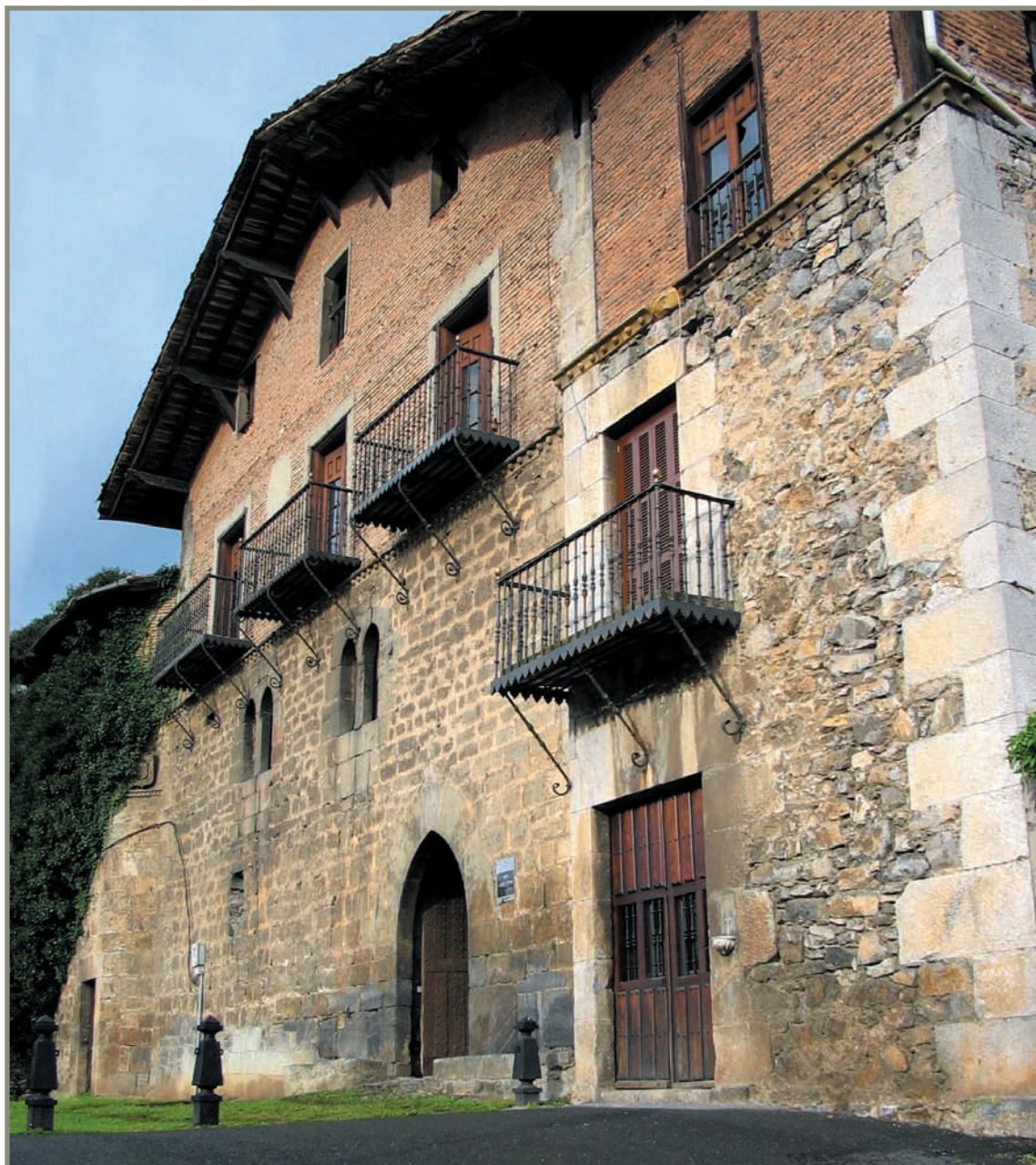
18.6. irudia. Azkoitiko Balda etxea.

zutenez gero, auzia amaitutzat jotzea eskatu zuen (ikus [XV. m. 164] agiria).