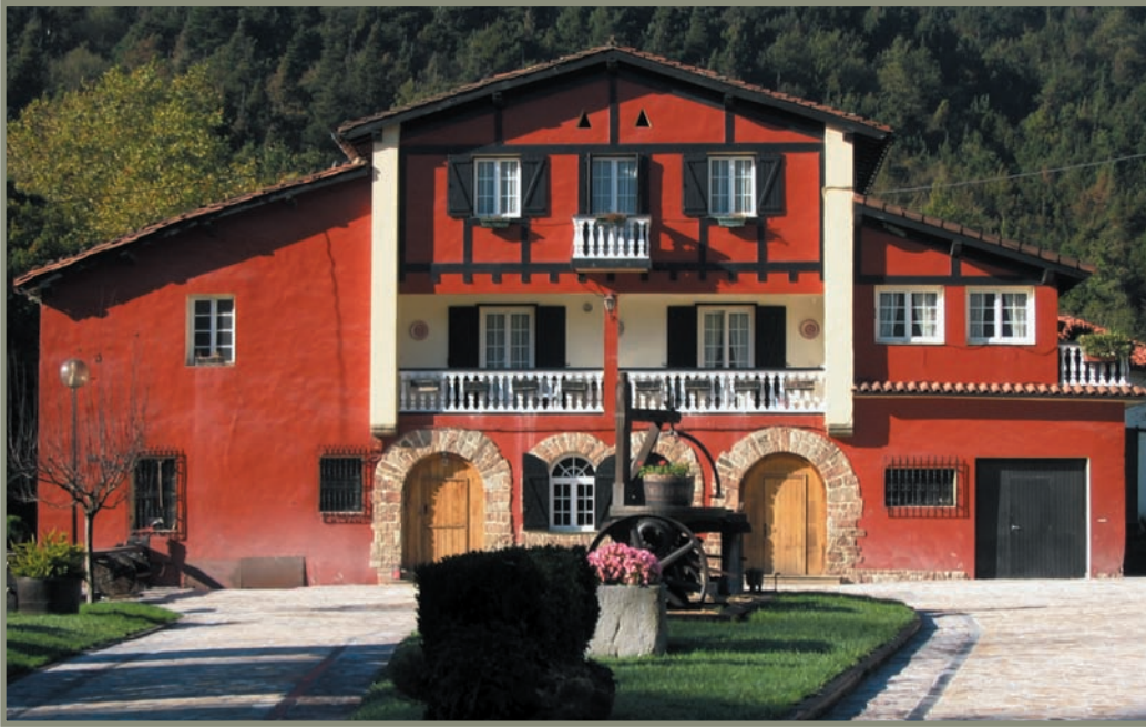
18.1. irudia. Aizarnazabalgo Errezustabekoa.