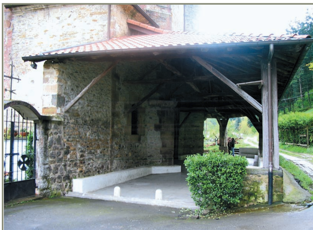
18.9. irudia. Beasain. Arriarango San Pedro eliza.