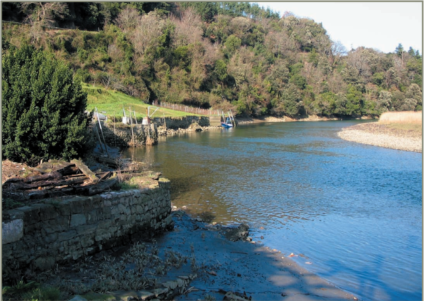
18.11. irudia. Zesto. Beduan ontziola zegoen lekua.