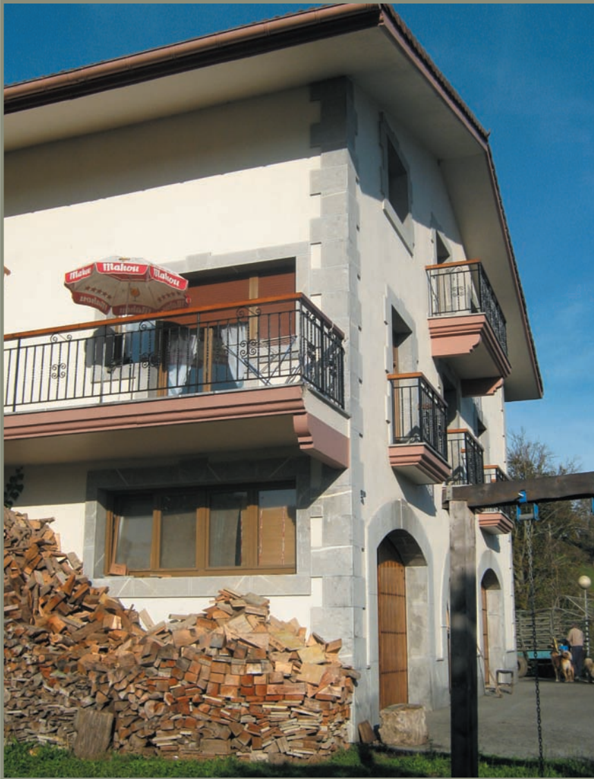
18.20. irudia. Arroako Akertzaberri.