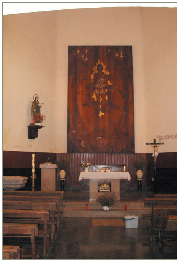
8.10. irudia. Iraetako ermitaren aldarea eta erretaula.

eman zezatela eskatu zien epaileei. Halaxe egin zuten epaitegikoek (ikus [XV. m. 176] agiria).