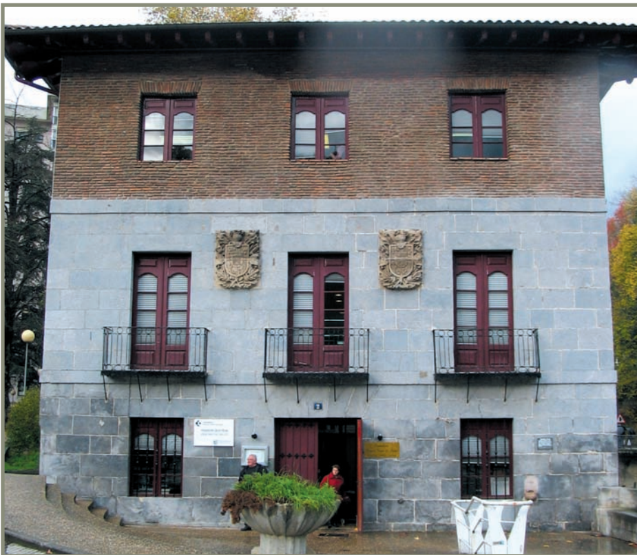
18.7. irudia. Azkoitiko Jausoro etxea.