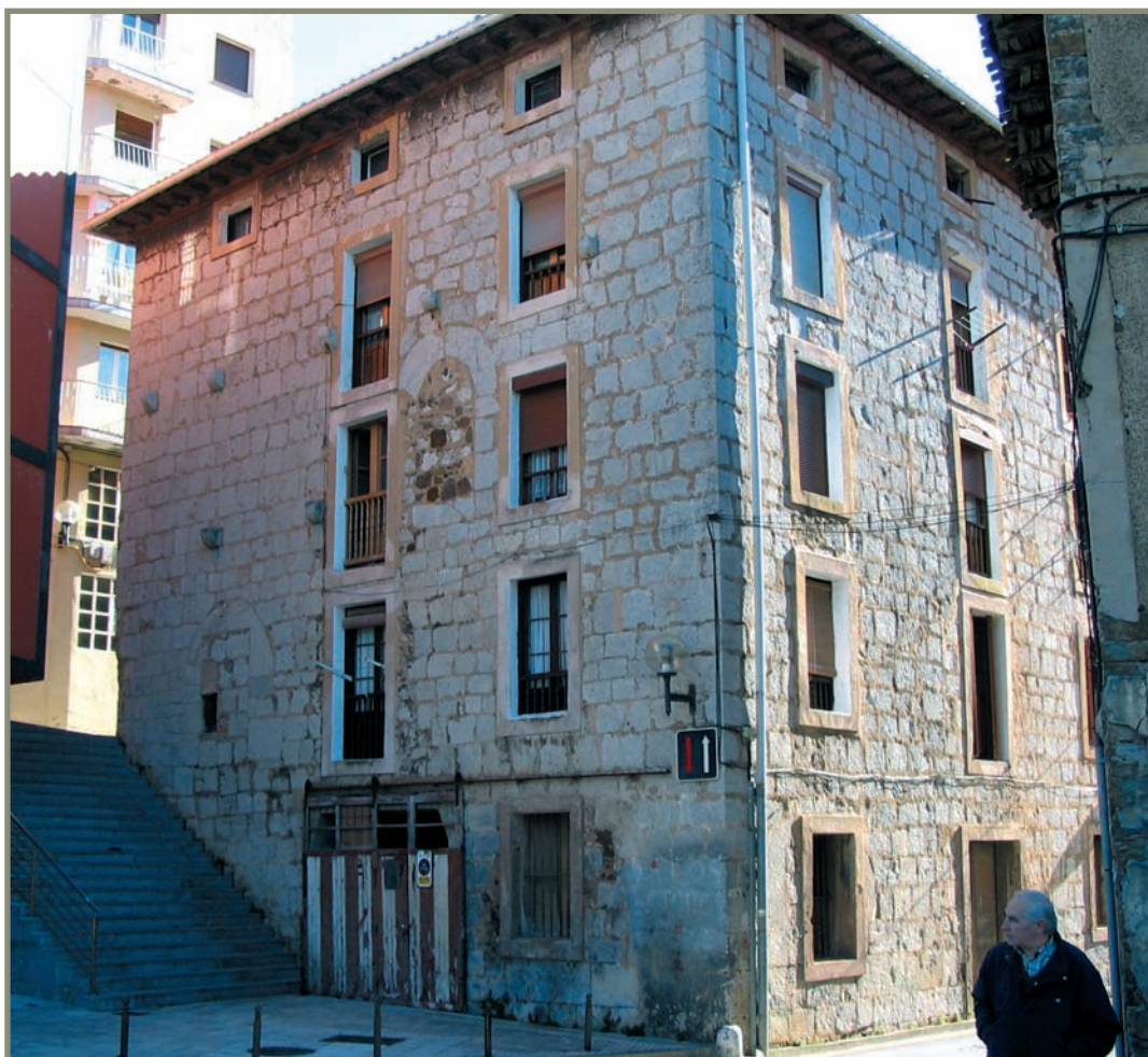
18.14. irudia. Debako Sasiola dorrea.