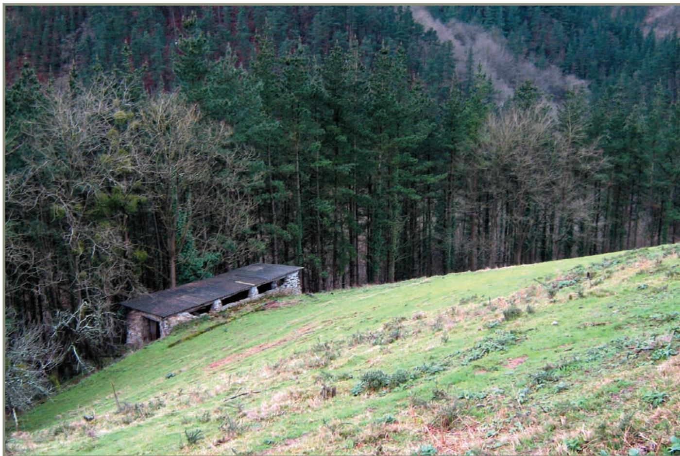
18.5. irudia. Etorrako Gorostiola aldea.