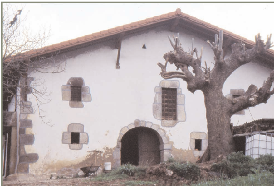
18.19. irudia. Aizarnako Zabala baserria.