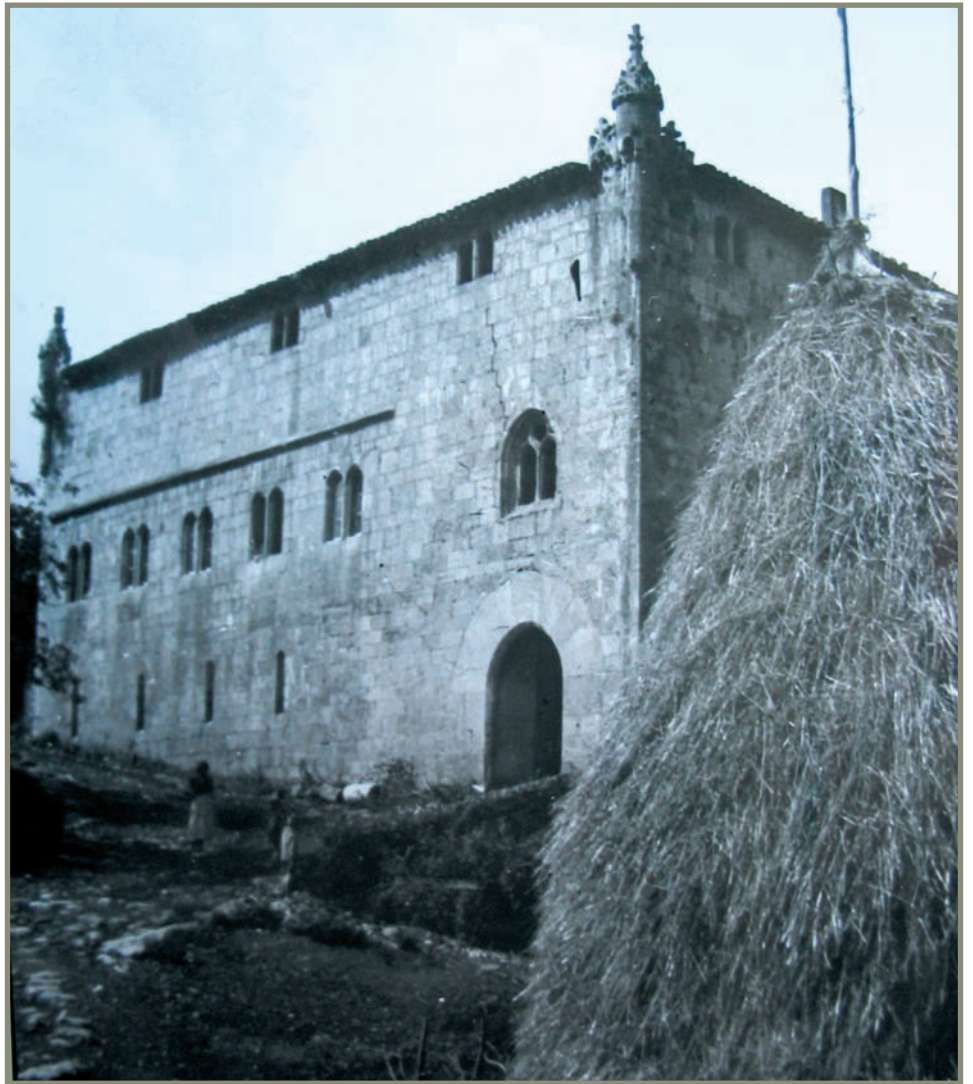
15.4. irudia. Lili jauregia.