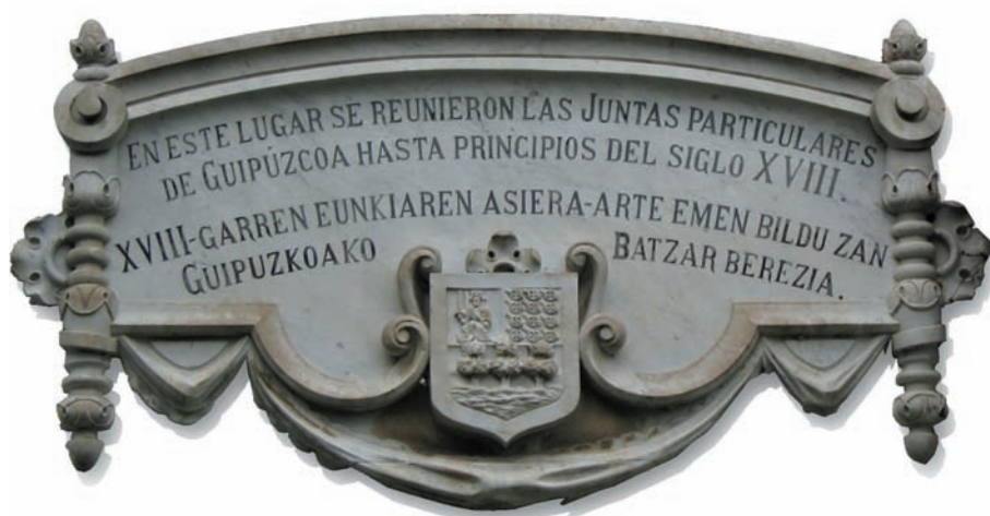
15.6. irudia. Azkoitiko Basarteko Batzarren oroigarria.

Gero, 1475eko apirilaren 22an Azkoitian bildu ziren Probintziako Batzar Nagusiak. Beste Batzar Berezi batzuk Usarragan bildu ziren 1475ean abendu baina lehen, eta bertan errege-erreginei Igorpen-alkatetza Gipuzkoako Probintziaren esku uztea eskatu zieten 3 . 1475-XII-23an Valladoliden idatzitako