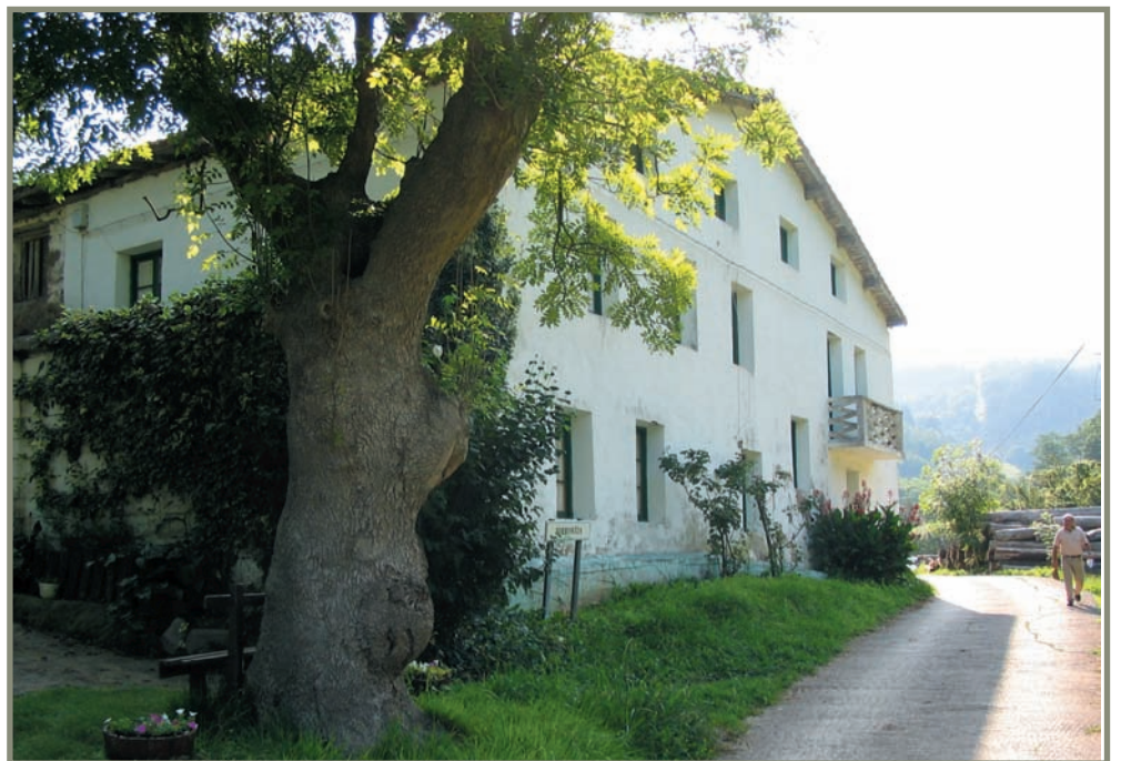
15.17. irudia. Zornotza (edo Zorrontza) baserria.