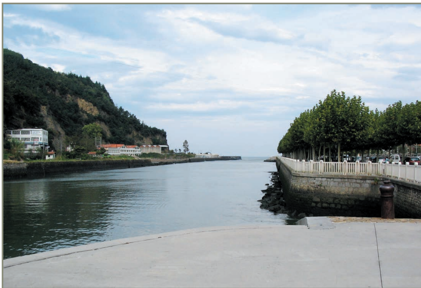
15.9. irudia. Debako itsasadarra.