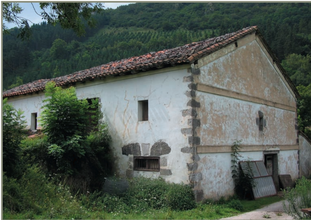
15.15. irudia. Aizarnako Ibarra baserria.