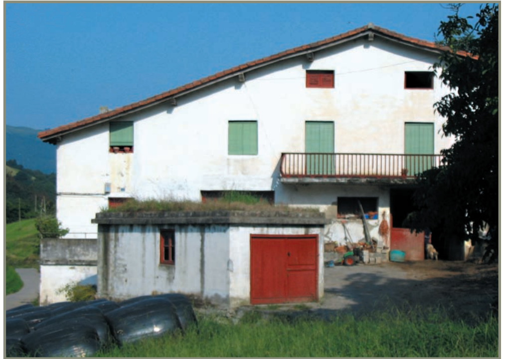
15.14. irudia. Urbieta (edo Urbitta) baserria.