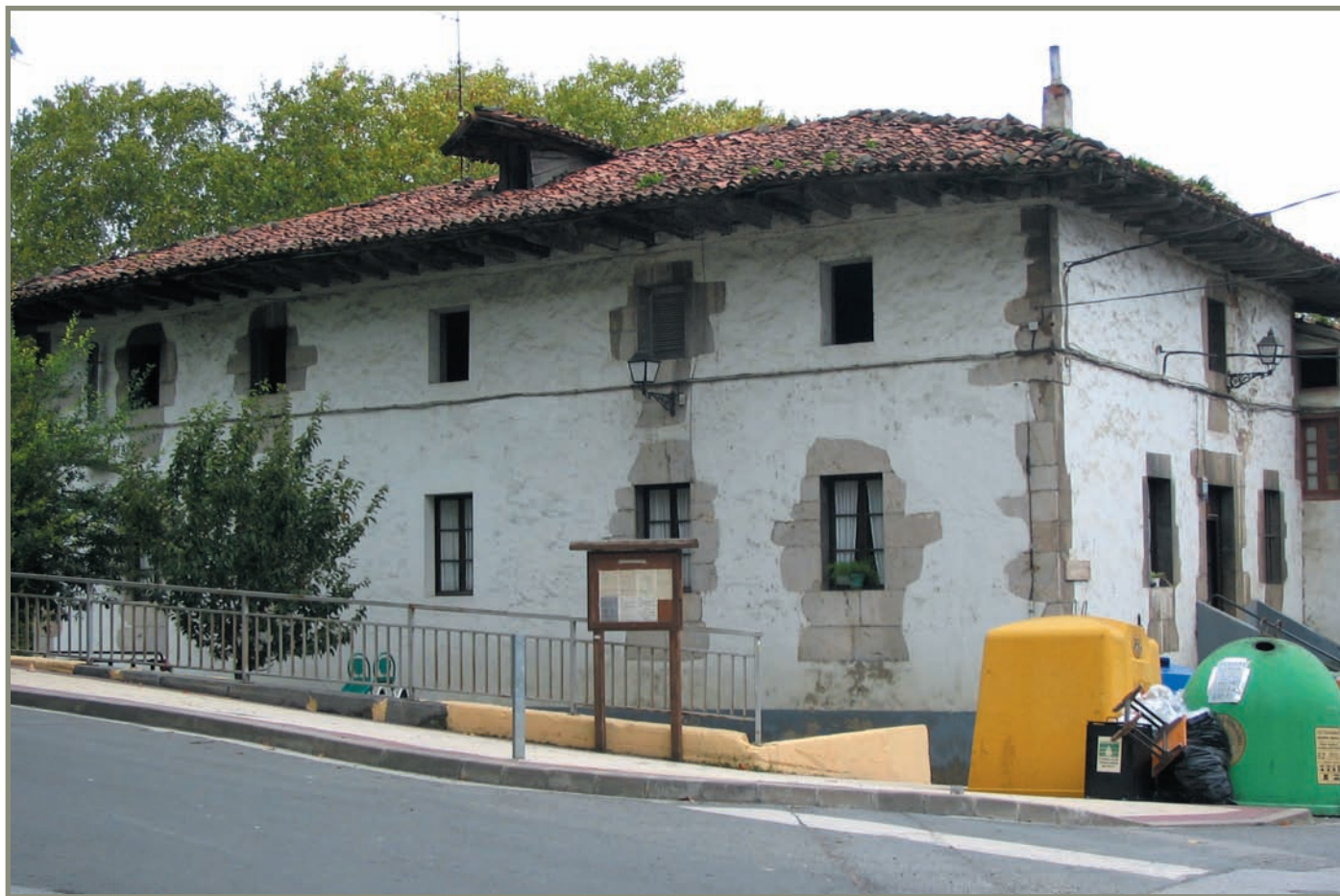
15.11. irudia. Iraetako "Granero" etxea.

zen, haiek erabaki zezaten. Arrasatek ez zituen Gipuzkoan hartu nahi.