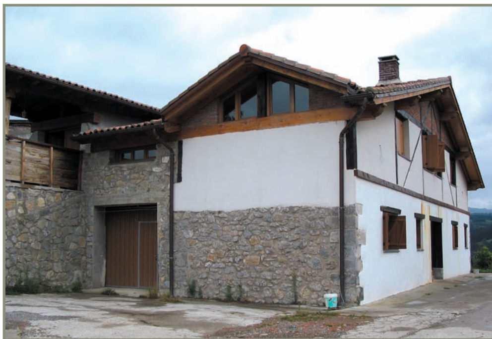
15.16. irudia. Etorrazpi baserria.