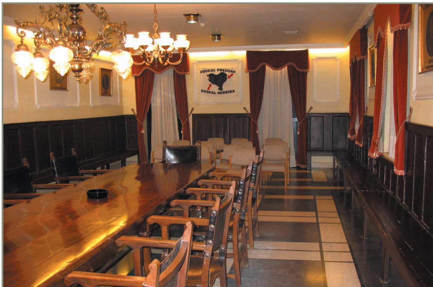
15.2. irudia. Zestoako Batzar Nagusien gela.

Esanda bezala, hurrengo udazkenean, 1472ko azaro-abenduetan, Zestoan bildu ziren Gipuzkoako Batzar Nagusiak. Bertan Aranogibelgo mendi eta larreetan Debak eta Elgoibarrek zuten auziaz epaia