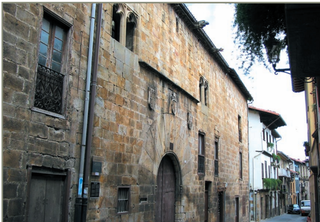
15.22. irudia. Segura. Gebaratarren jauregia.