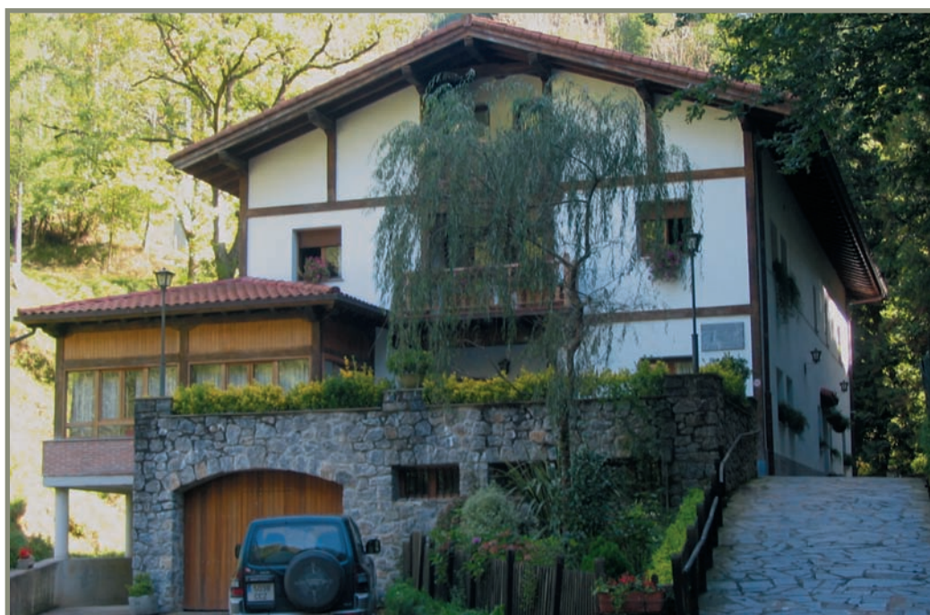
15.21. irudia. Bedama. Granada baserria.