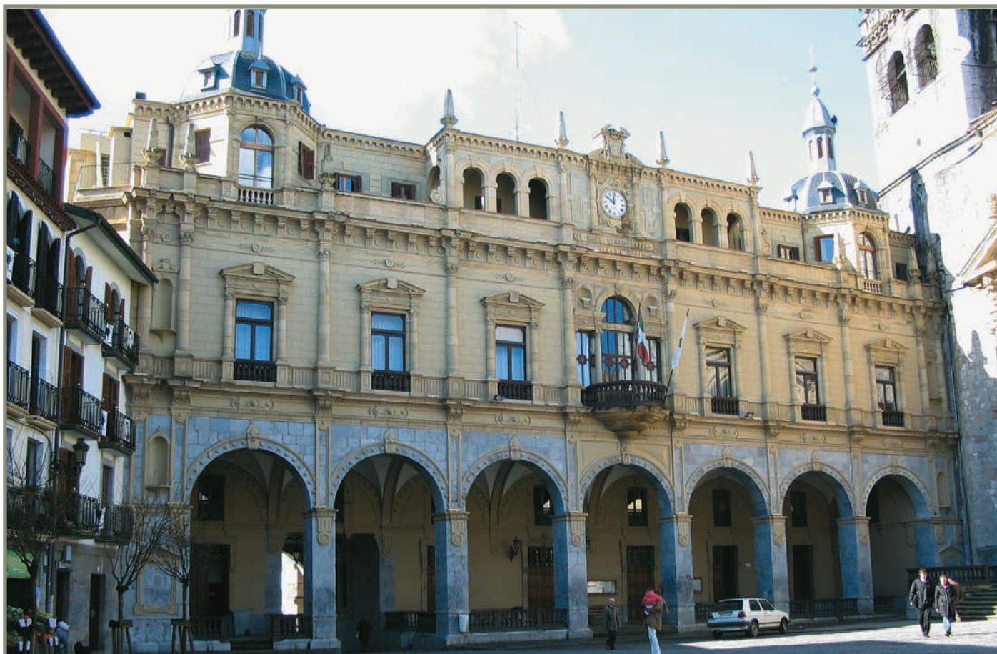
15.19. irudia. Hernaniko udaletxea.

1479-XII-3-6an Hernanin eta Zarautzen Batzar Nagusiak bilduta, ordenantza bat idatzi zuten. Probintziaren prokuradore eta mezulariei buruzkoa zen. Hurrengo urtean, martxoaren 24an, Toledon onetsi zuten errege-erreginek. Batzar haietan Arrasateko altzairugileen kofradiari Probintziak zenbait estatutu bidegabe kentzea agindu zion 1 .