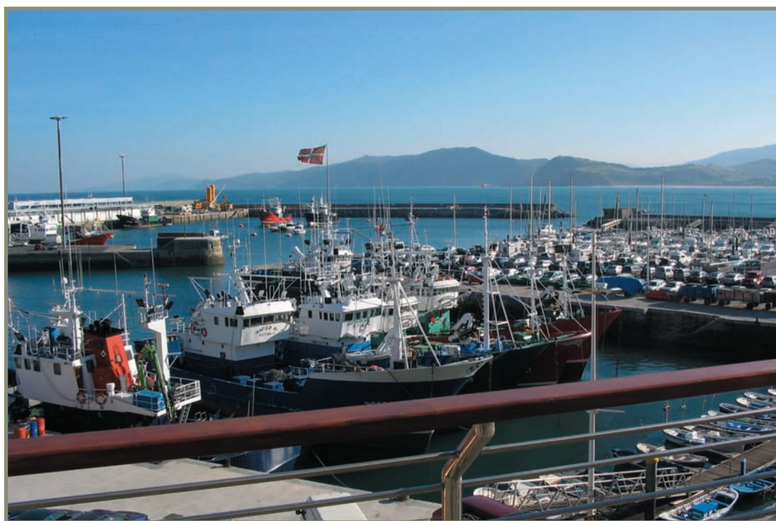
15.3. irudia. Getariako portua.

Trebiñuko kondea ganboatarren buru zen, eta Bizkaian Gaztelako Isabel eta Aragoiko Fernando senar-emazteen alde agertu zen. Hauek Ingalaterraren aldeko eta Frantziaren aurkako ziren, eta Bizkaia eta Gipuzkoa bereganatzen saiatu zen alde bakoitza, bertako itsasontziak gerrarako oso baliagarriak izango zirelakoan 16 .