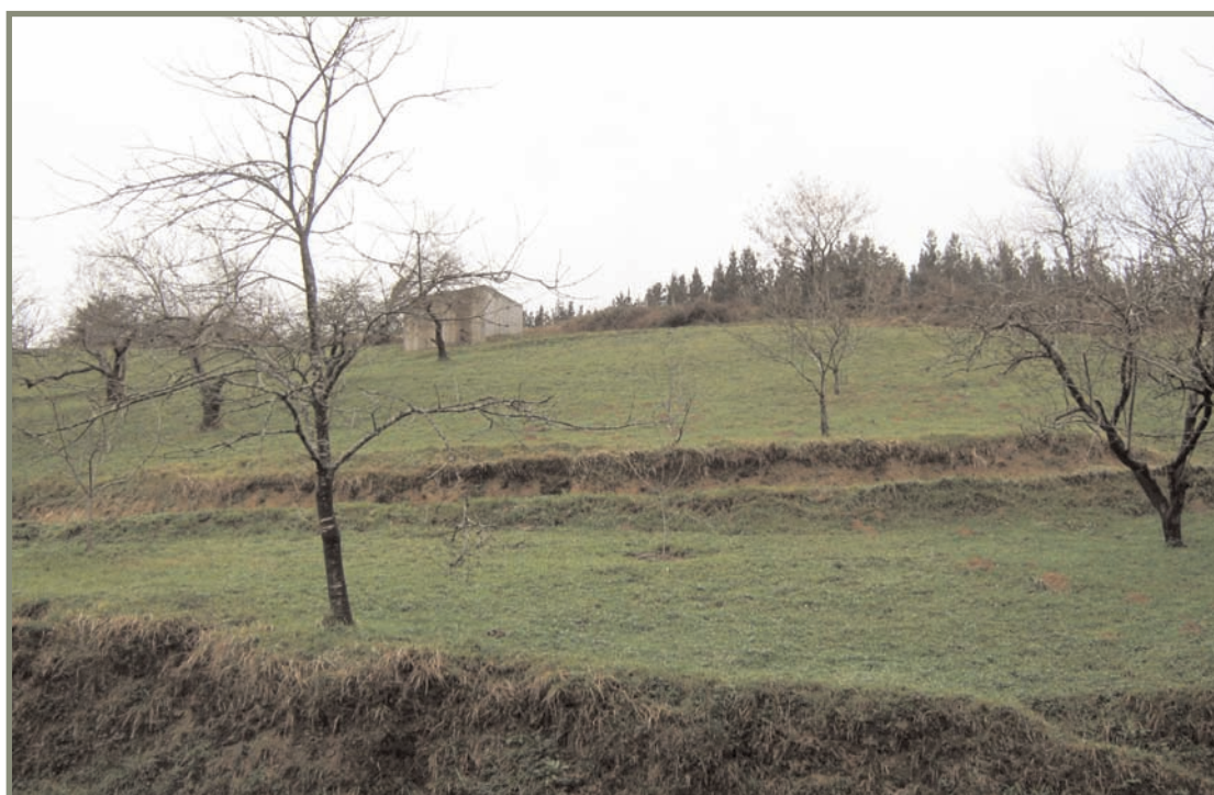
15.5. irudia. Etorrako saroiaren "Austarritza" izeneko lekua Beroaran ondoan.