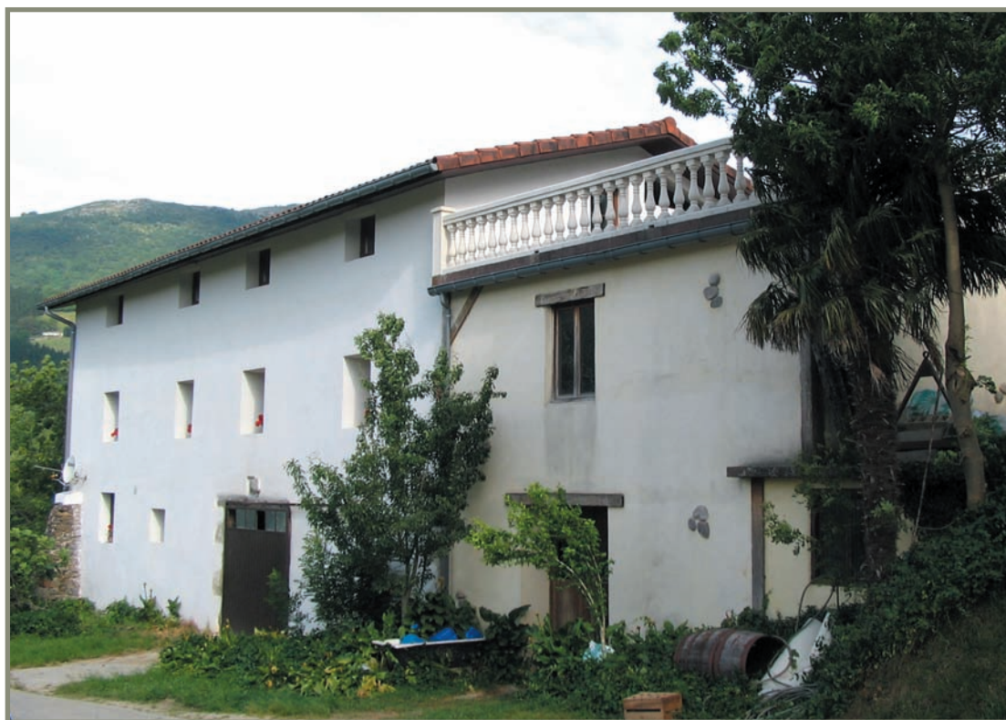
15.12. irudia. Arroerrekako Ibarrola.