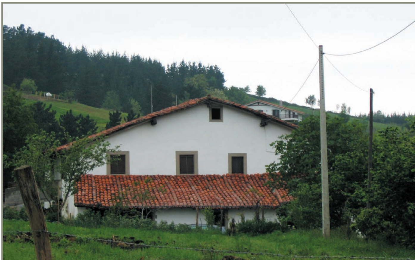
15.7. irudia. Zestoako Areitzaga Joan Domingo baserria.