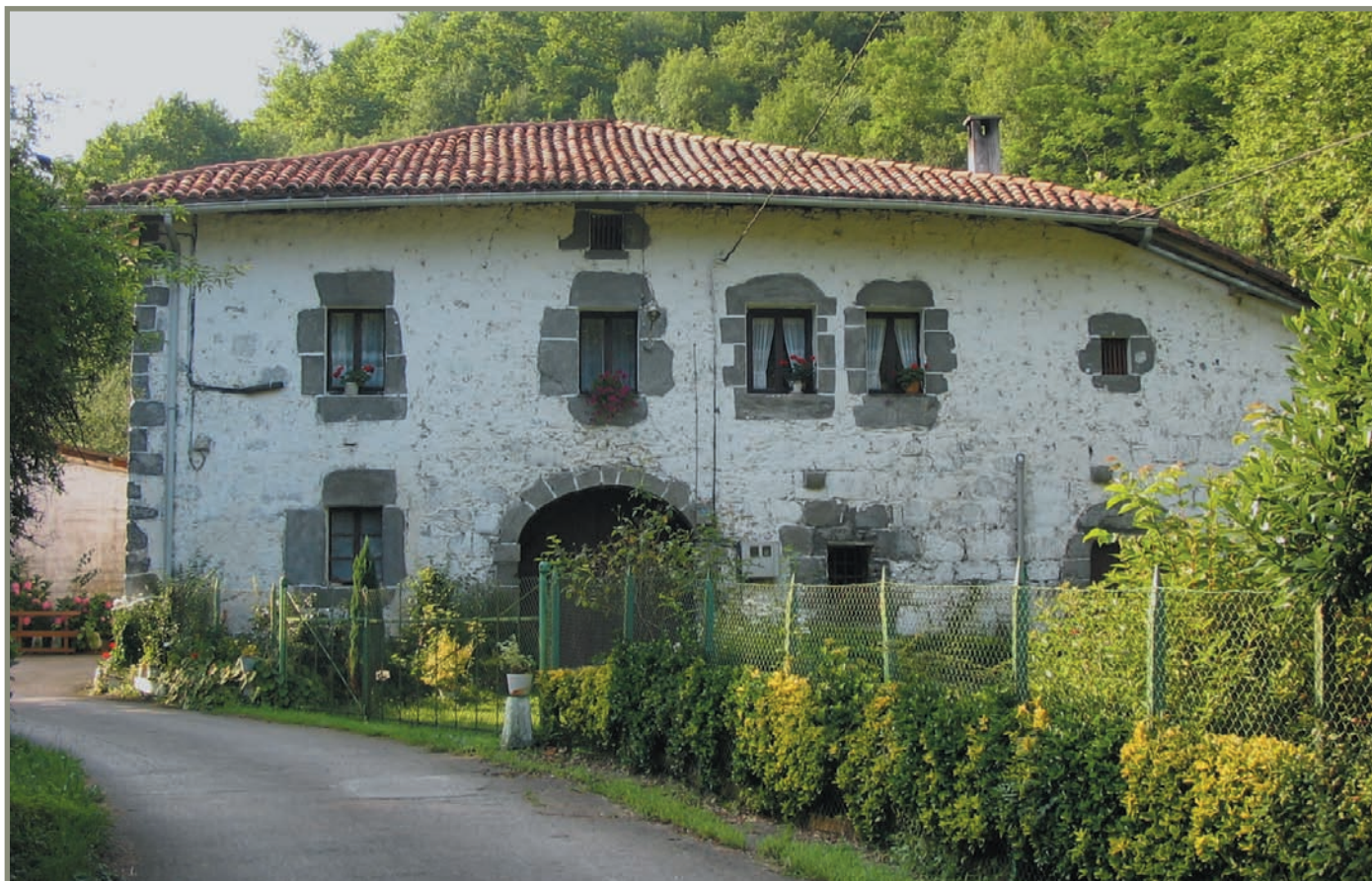
15.13. irudia. Bekola baserria.

kin herri-lurrak bisitatu eta azken 44 urteetan okupatu zirenak libratzeko. Ordezkarri haiek, ordea, ez zuten bere lana ongi egin, eta haiek egina deuseztatuzat jo zuten. Hutsetik hasiko ziren, beraz.