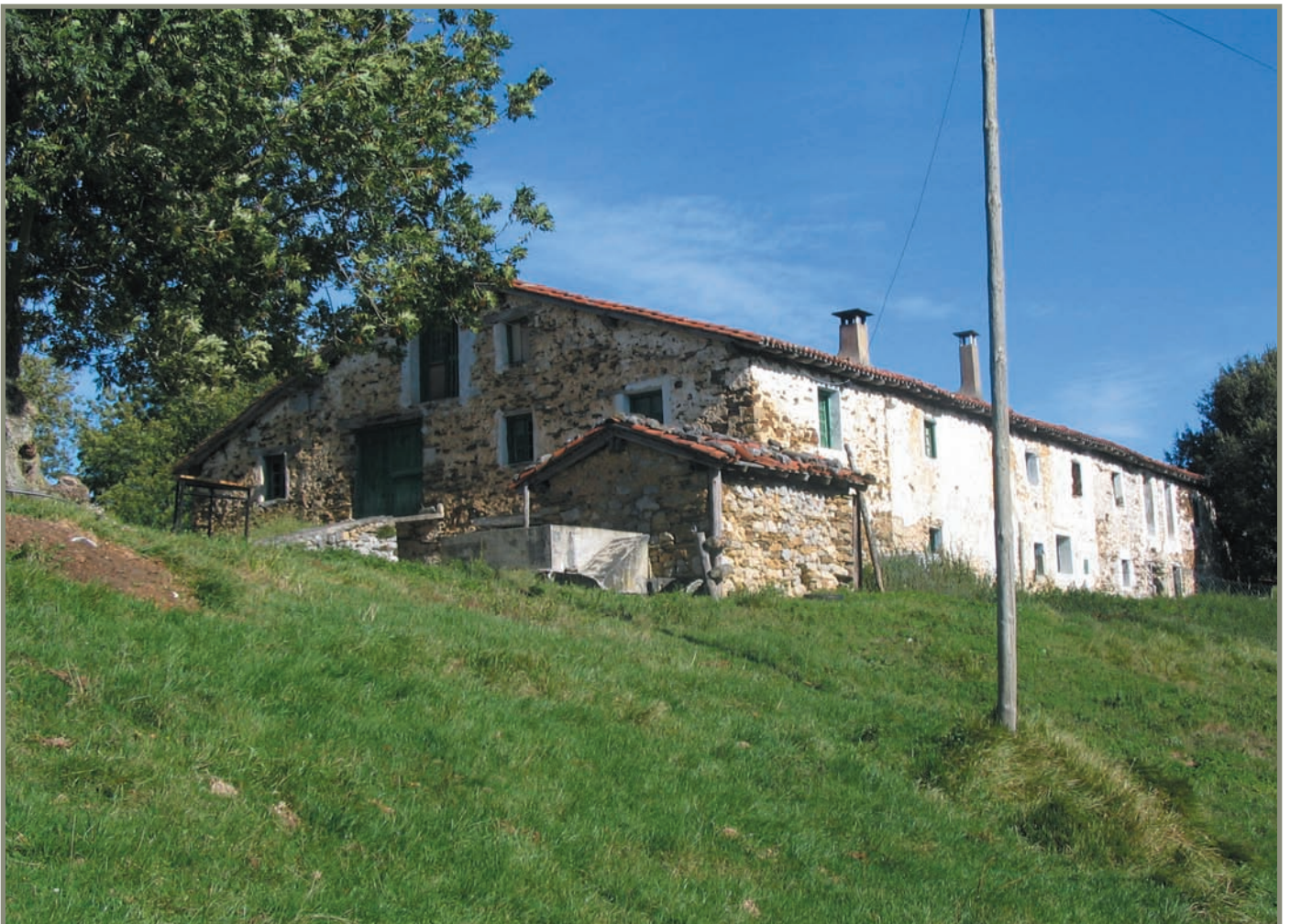
13.3. irudia. Zestoako Ezkurroa baserria.

5) Saroi horiek urdeak hazteko ezkurra edo beste bazkaren bat zutenean, Zestoak bi gizon izendatuko zituen eta Errezilek beste bi. Lau horiek, zin eginda, erabakiko zuten saroi bakoitzean zenbat urderentzako bazka zegoen, eta Zestoak urde edo txerrien erdiak bidaliko zituen bazkaterra, eta Errezilek beste erdiak.