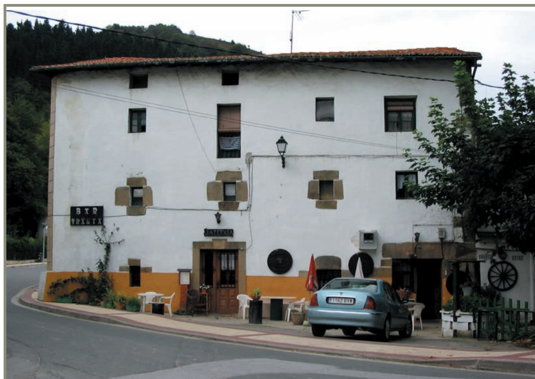
13.5. irudia. Iraetako Errota etxea.

Garai hartan desadostasunak maiz izaten ziren Elizako agintarien eta erreinuko agintari zibilen artean, zenbait kargutarako izendapenak zirela medio. Hain