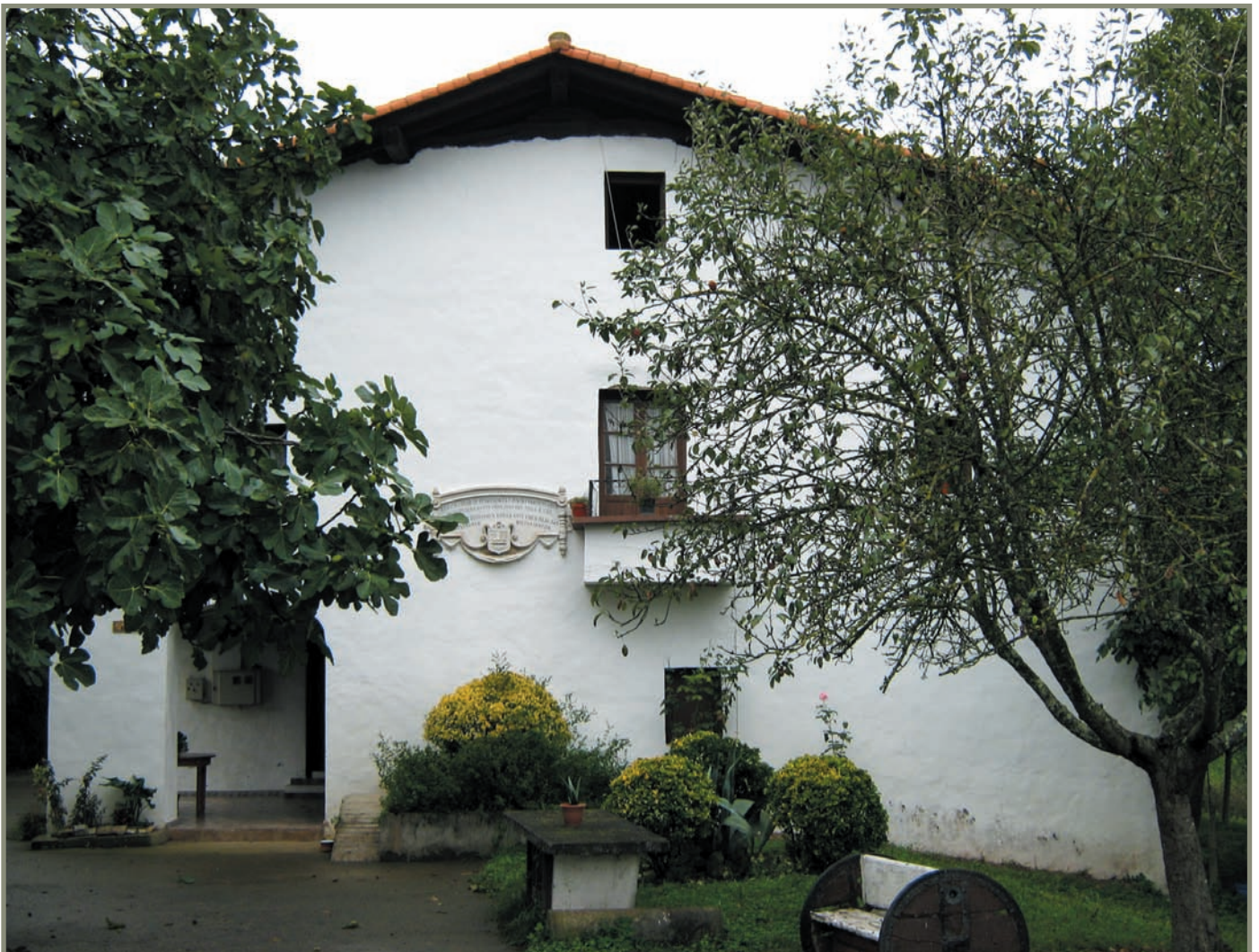
13.8. irudia. Azkoitiko Basarte baserria, Batzar Bereziatarako bilgunea.