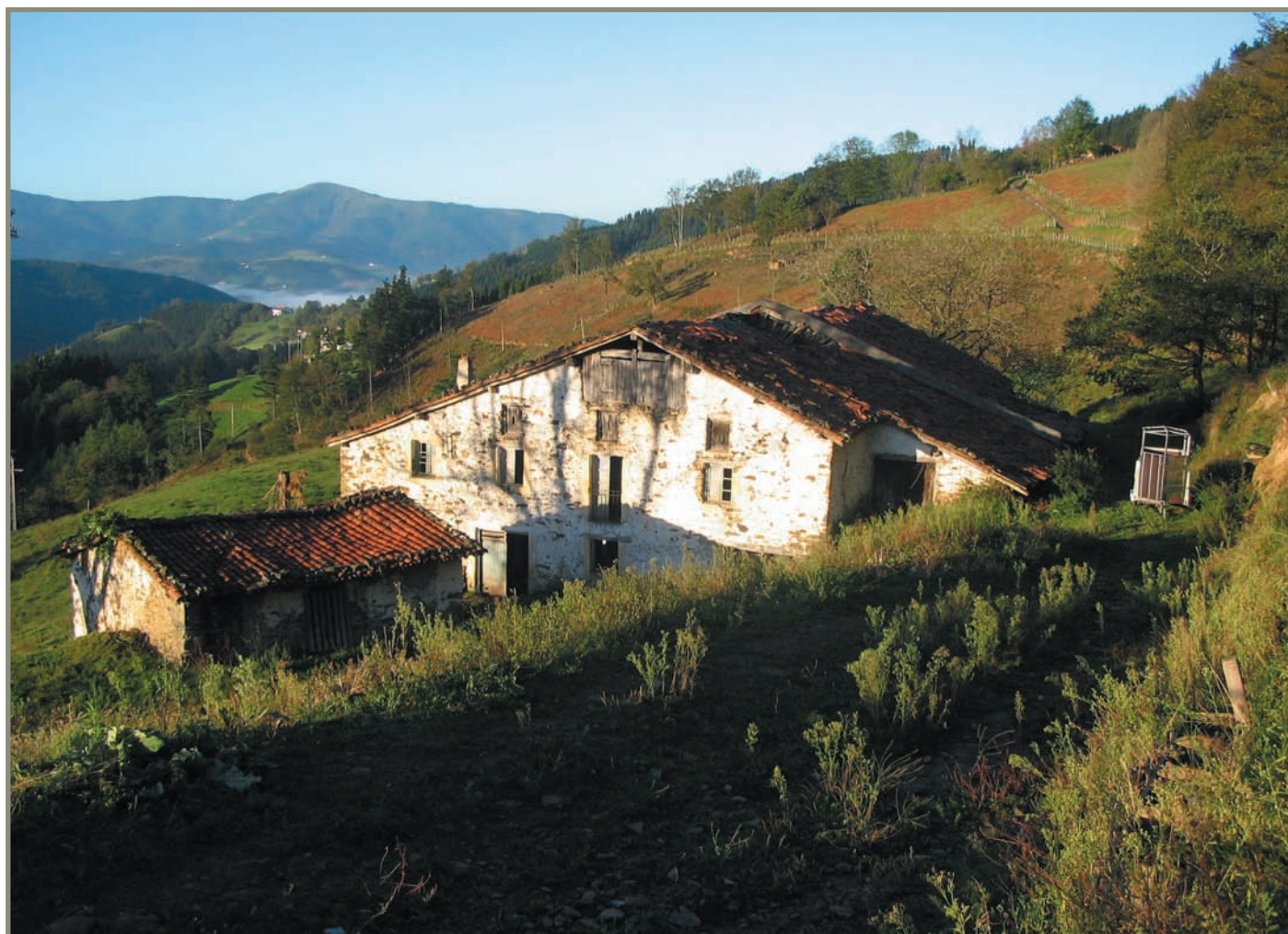
13.2. irudia. Errezilgo Intzitorbibekoa (Antxiturbibekoa) baserria.

(sei gorabilekoa), Komisolatzakoa (sei gorabilekoa), Erdoiztakoa (hamabi gorabilekoa), Gallakuekoa (orain Galleku) (sei gorabilekoa), Barrensaroe (orain Barrenso) (hamabi gorabilekoa), Bedanburukoa (orain Belanburu) (sei gorabilekoa), Adaolatzakoa (orain Aldaolatza) (sei gorabilekoa), Gazumekoa (sei gorabilekoa), Zezenarriagakoa (sei gorabilekoa), Erniogurtzeagakoa (sei gorabilekoa), Elkamengoa (sei gorabilekoa), Elkamengo bestea (sei gorabilekoa), Reabiztakoa (Erdoiztakoa?) (sei gorabilekoa) eta Ezkurroakoa (hamabi gorabilekoa). Gorabilaren neurria Gipuzkoarako erabakitakoa da. Haustarritzatik zirkunferentziarainoko erradioa zen sei gorabilekoa edo hamabi gorabilekoa.