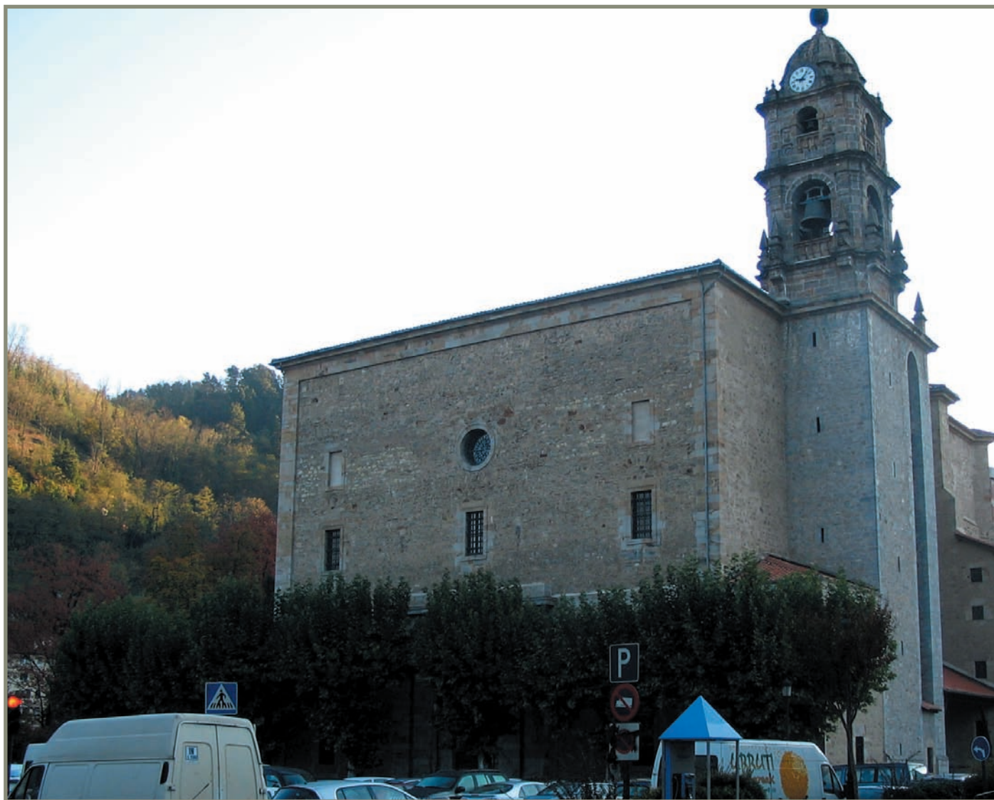
13.7. Bergara. Santa Marina Osirondokoa.