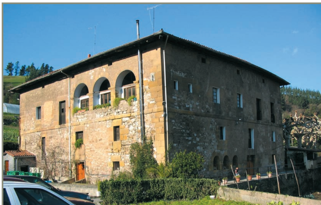
13.15. irudia. Zestoa. Beduaundi.

Nafarroan, berriz, agaramontarrak eta beaumontarrak gerran ibili ondoren, Joan I.a erregeak eta Bianako Printzeak bakea sinatu zuten Batzelonan 1460-I-2an, baina urte hartan bertan, abenduaren 2an, aitak berriz ere semea Lleidan preso hartu zuen 14 .