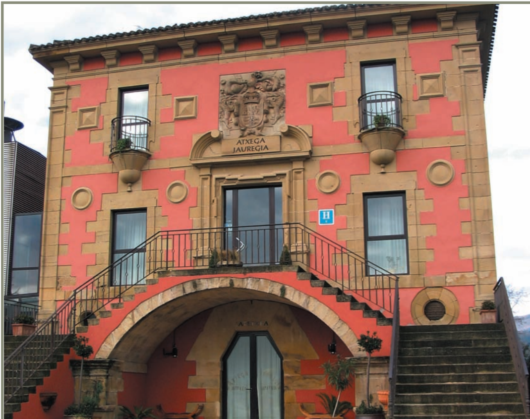
13.9. irudia. Usurbil. Atxaga etxea.

1456. urtean Gipuzkoako Probintziako Ermandadeak gogor jokatu zuen Ahaide Nagusien eta hauen jarraitzaileen aurka. Ermandadeak honako dorretxe hauek eraitsi egin zizkien: Lazkao, Igartza, Amezketta, Ugarte, Altzaga, Zegamako Murgia, San Milian, Asteasu, Zumarraga, Loiola, Balda, Enparan, Zarautz, Atxaga, Elgeta, Iraeta, Bergara eta beste zenbait (22 dorretxe guztira). Olaso eta Untzueta baino ez zituzten osorik utzi. Ahaide Nagusiak erbesteratu eta ondasunak kendu egin zizkieten. Beraz, dorretxeak ez ziren erregearen aginduz 1457. urtean eraitsi, Garibaik hori badio ere, 1456an Gipuzkoako Ermandadearen aginduz baizik.