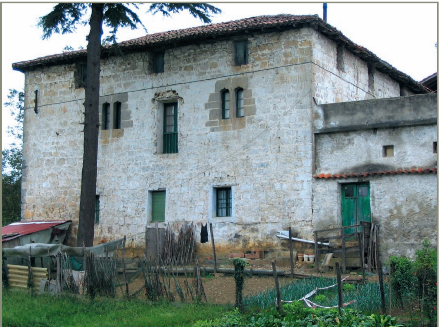
13.11. irudia. Zizurkil. San Milian jauregia.