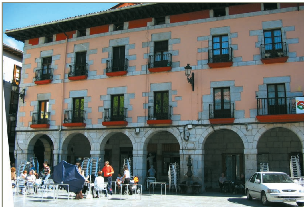
13.10. irudia. Elgoibar. Herriko plaza.