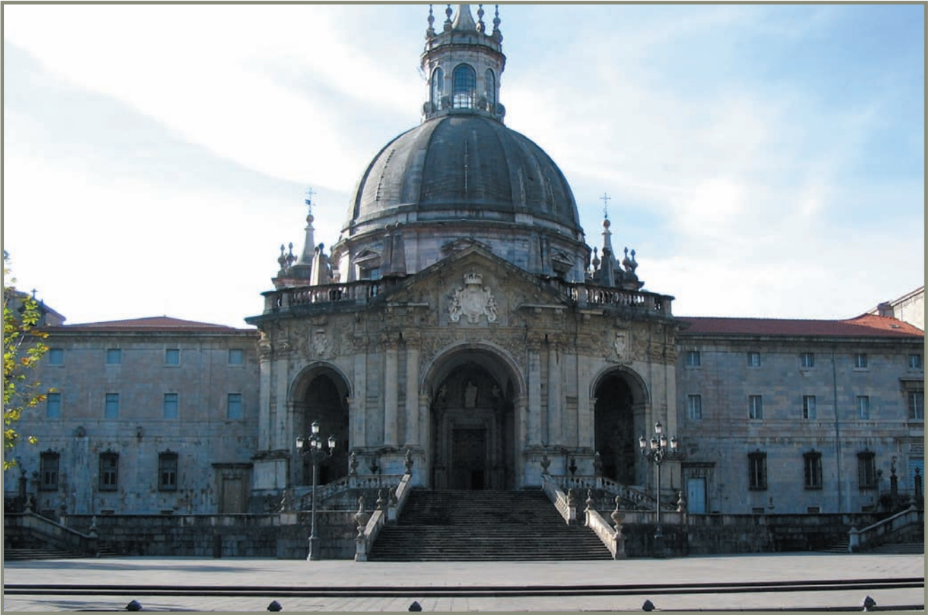
13.1. irudia. Azpeitiko Loiola.

Gipuzkoako Ermandadea 1451an bat etorri zen Gipuzkoako Probintziako orduko lurraldearekin, eta Probintziakoe skribauf ielD omenjonG onzalez Andia-koa izaten 1451n, edo hurrengo urtean, hasi zen 10 .