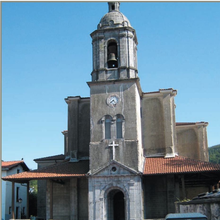
13.6. irudia. Bidegoian. San Bartolome eliza.