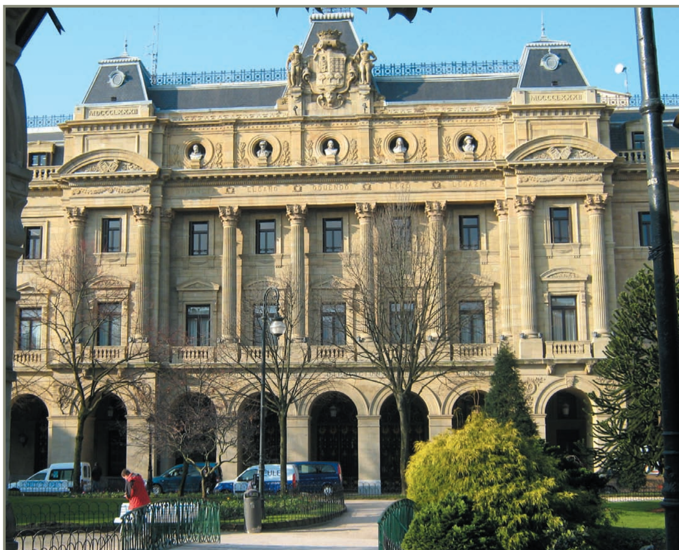
13.13. irudia. Gipuzkoako Foru Aldundia.

1457ko Ordenantzek ziotenez, urtero bi Batzar Nagusi egingo zituzten: udaberrian eta neguan. Uda-berrikoa garizumako Pazko egunetik 13 egunera hasi-ko zen eta azarokoa hilaren 14an. Hamaika eguneko Batzarrak izango ziren gehienez. Udazkeneko txan- dako Batzarrak 1), 3), 5), 7), 9), 11), 13), 15) eta 17) izendatu ditugun hiribilduetan egingo ziren. Udabe- rrikoak, berriz, 2), 4), 6), 8), 10), 12), 14), 16) eta 18) izendatu ditugun hiribilduetan. Azkoitian neguan hasi eta Ordizian amaitzen zen zikloa bederatzirteren buruan. Egia da, hala ere, hainbat urtetan ordena hori ez zela errespetatu.