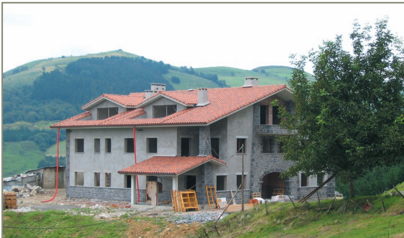
13.12. irudia. Aizarnako Aizarnatea edo Aizarnabate baserria.